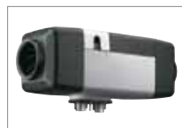
Webasto Air Top