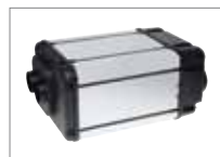
Webasto Dual Top

Compila la cartolina e consegnala al tuo rivenditore di fiducia per avere Webasto Air Top in offerta (compilare in stampatello)