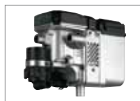
Webasto Thermo Top C Motorcaravan