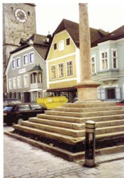
Esempio: Weidhofen (A)