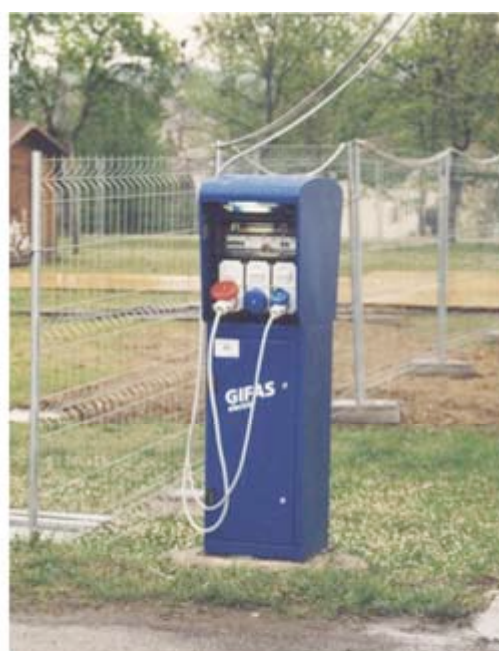
Esempio: pertinenze dell'autodromo di Imola