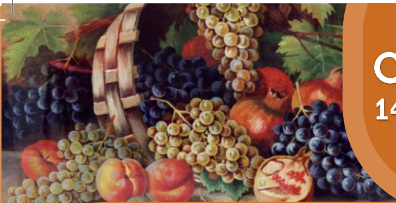
Natura rustica con frutta, olio su tela di Francesco Bo "Cichin in "