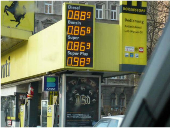
Il gasolio a Vienna costa poco!!