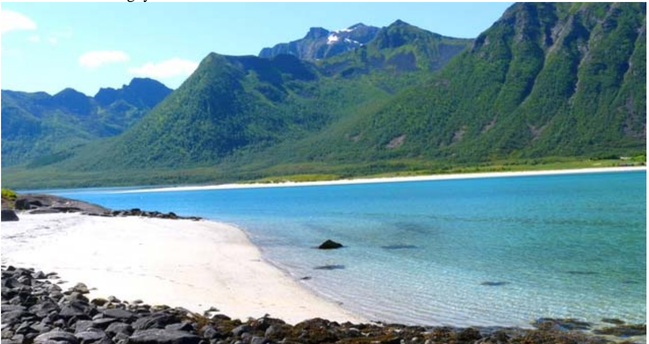
Nella foto sotto : Splendido gioco di spiagge e di correnti nei pressi di Delp sulla costa occidentale dell'isola di Austvagoy.