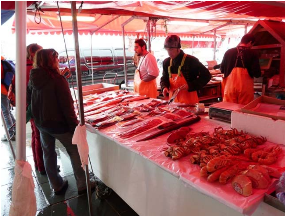
A fianco : Un particolare del suggestivo e multietnico mercato del pesce di Bergen.

Costi : Parcheggio Bergen 12 € per un giorno intero Varie 23 €