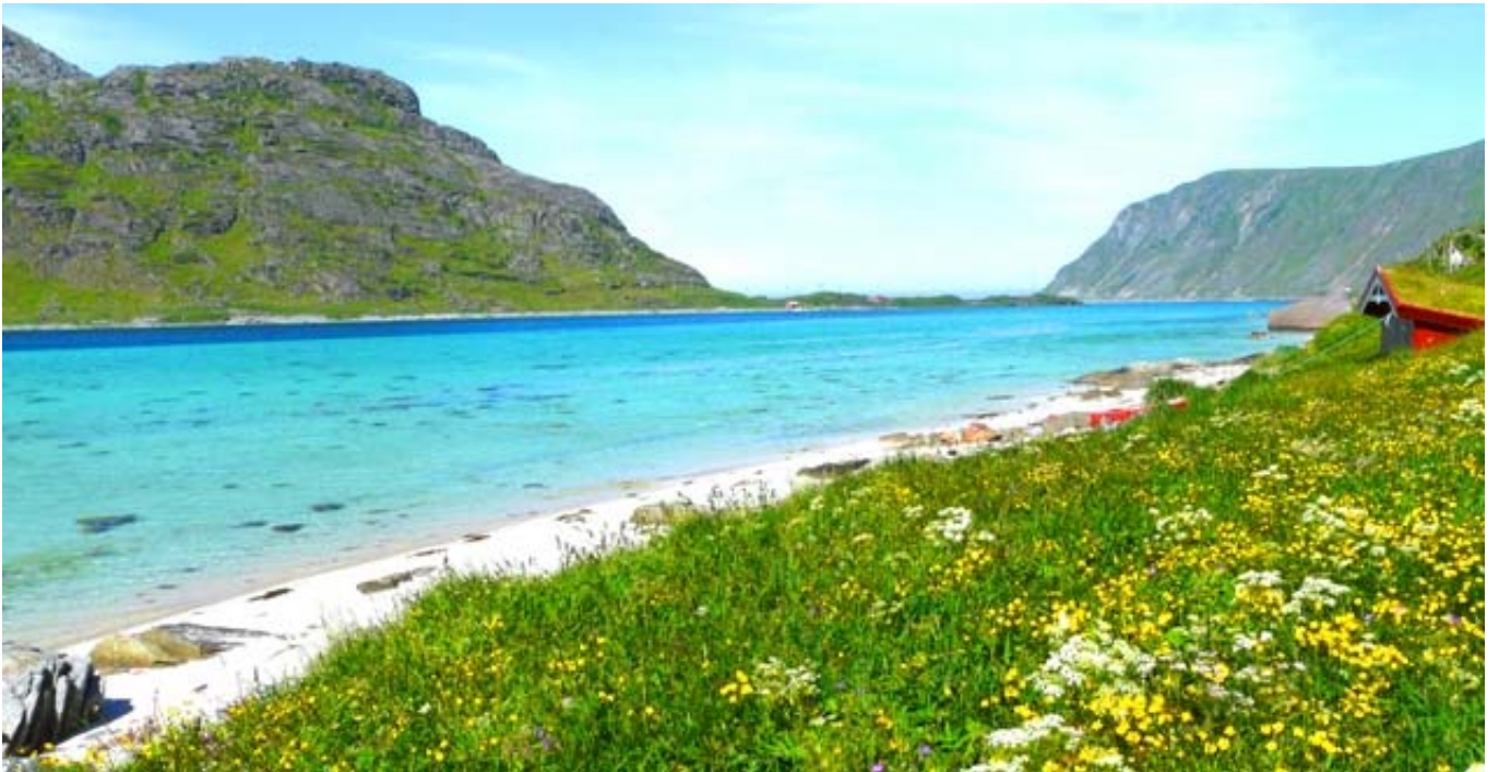
Sotto : 3 vedute panoramiche dell'incantevole paesaggio nei dintorni di Hamnøy