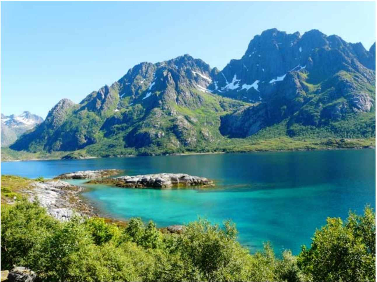
Sotto : Una delle numerose spiagge caraibiche nei pressi di Hadselsand sulla costa settentrionale dell'isola di Austvagoy