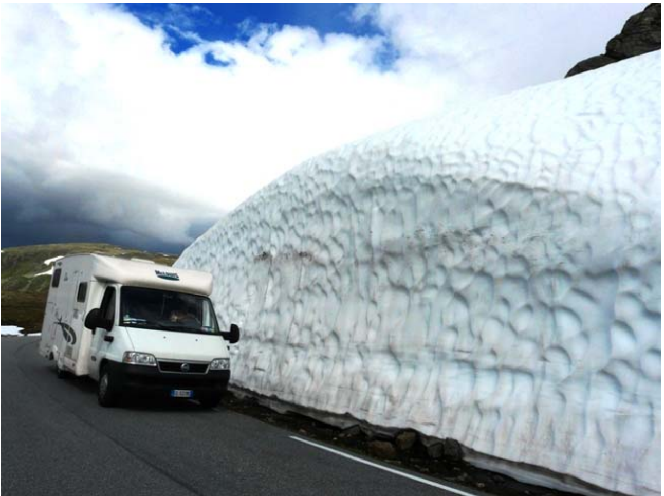
Nella foto sotto : Una Bella veduta panoramica dell' Aurlandsfjord, nei pressi di Aurland.