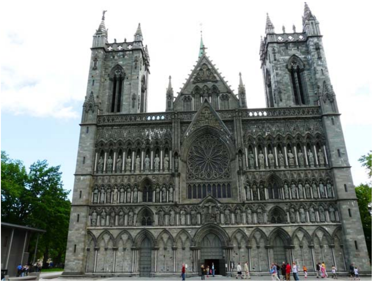
Trondheim : La Cattedrale medioevale ( Domkirke )