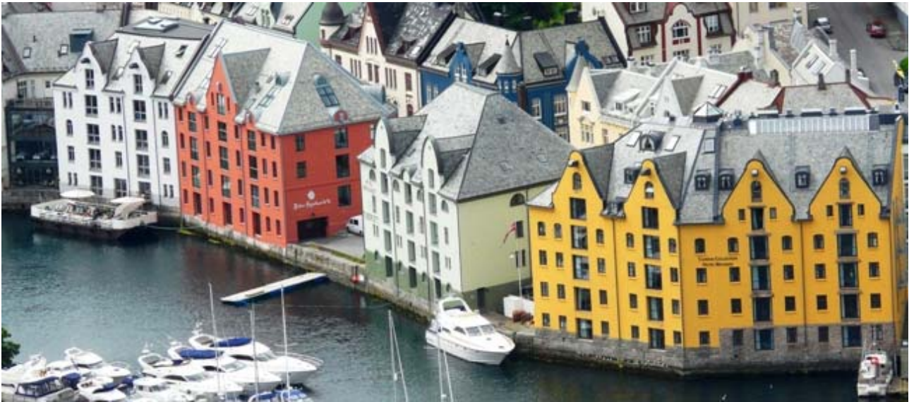
Sopra : Una veduta del canale principale del centro di Alesund.