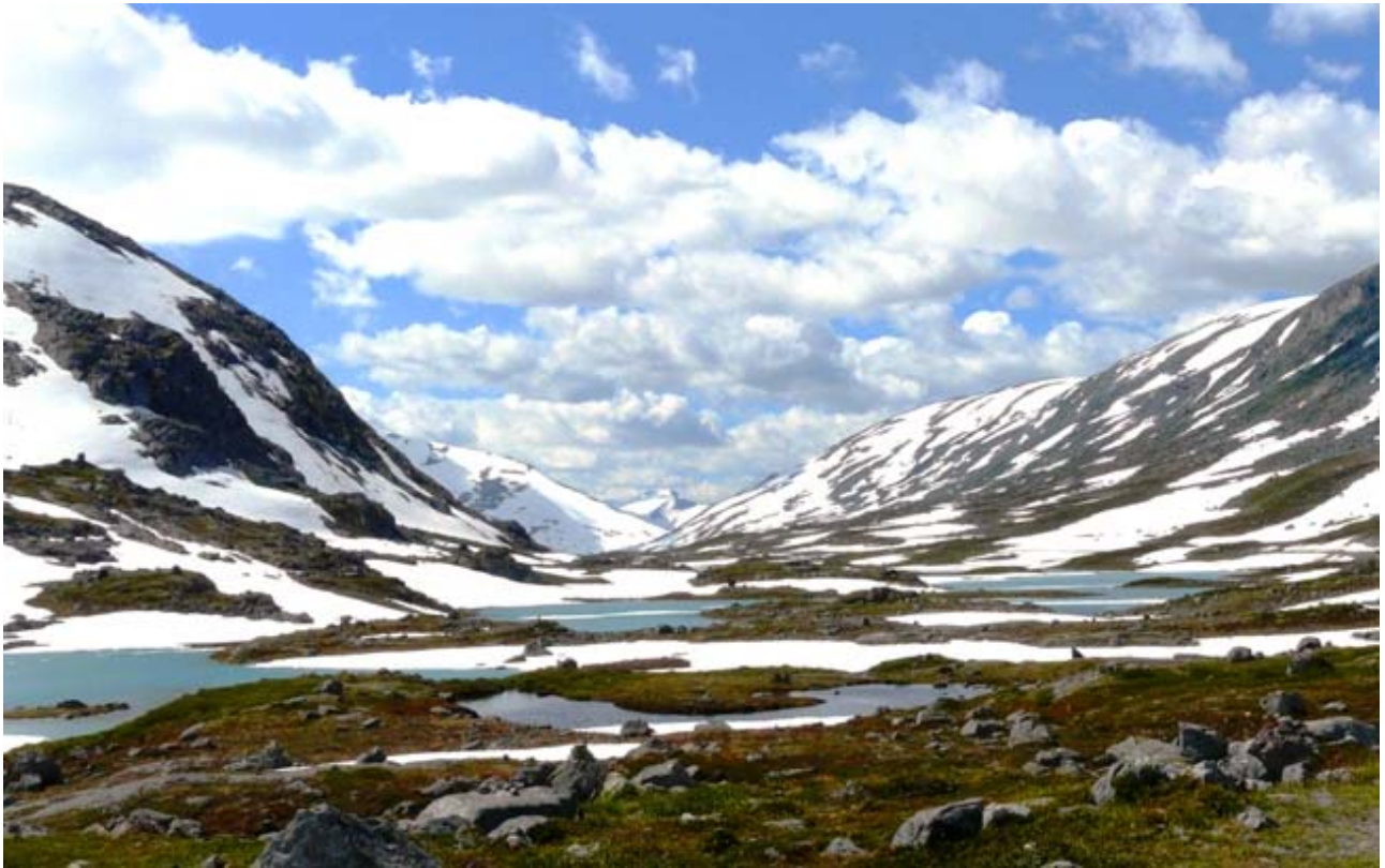
Sotto : Le montagne innevate viste dal monte Dalsnibba.