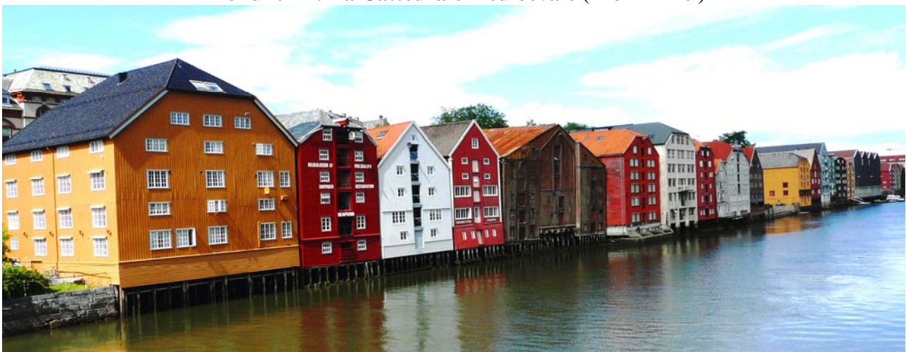
Trondheim : Case a palafitte nel quartiere Bryggene