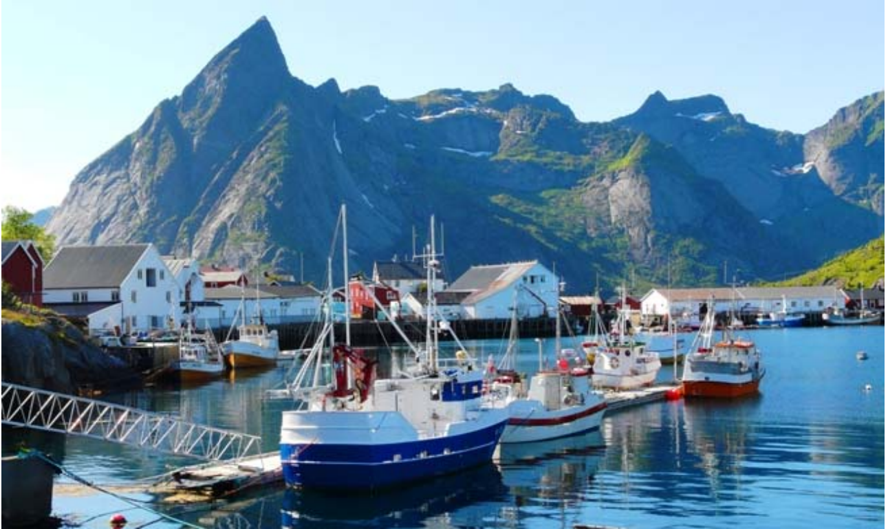
Nella foto sotto : Veduta mozzafiato di Reine “ La Perla delle Lofoten “