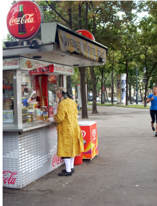
Mozart che si fa un hot dog!!!!