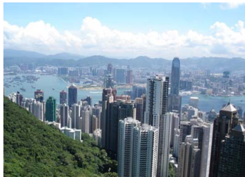
Baia Honk Kong

La mattina del 31 Luglio ci incontriamo all’aeroporto di Cagliari intorno alle 6 del mattino così da partire con il primo volo per Roma. Dopo la solita trafila di documenti e passaporti, ci sediamo comodi in aereo e i motori si accendono. Da Roma prendiamo il volo per Honk Kong e entusiasti e felici siamo pronti a passare queste dodici ore con tanto desiderio di arrivare in fretta per poter iniziare la nostra avventura.