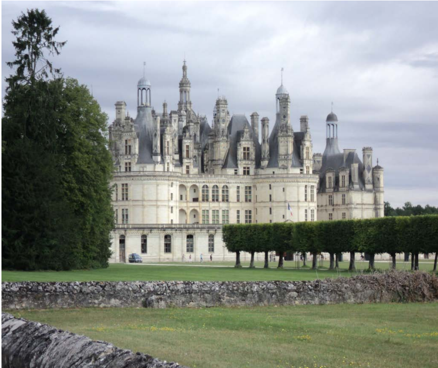
CASTELLO DI CHAMBORD

2-08 pagato camping a Bracieux(2 notti con luce € 39,50) Bracieux citta di Porthos