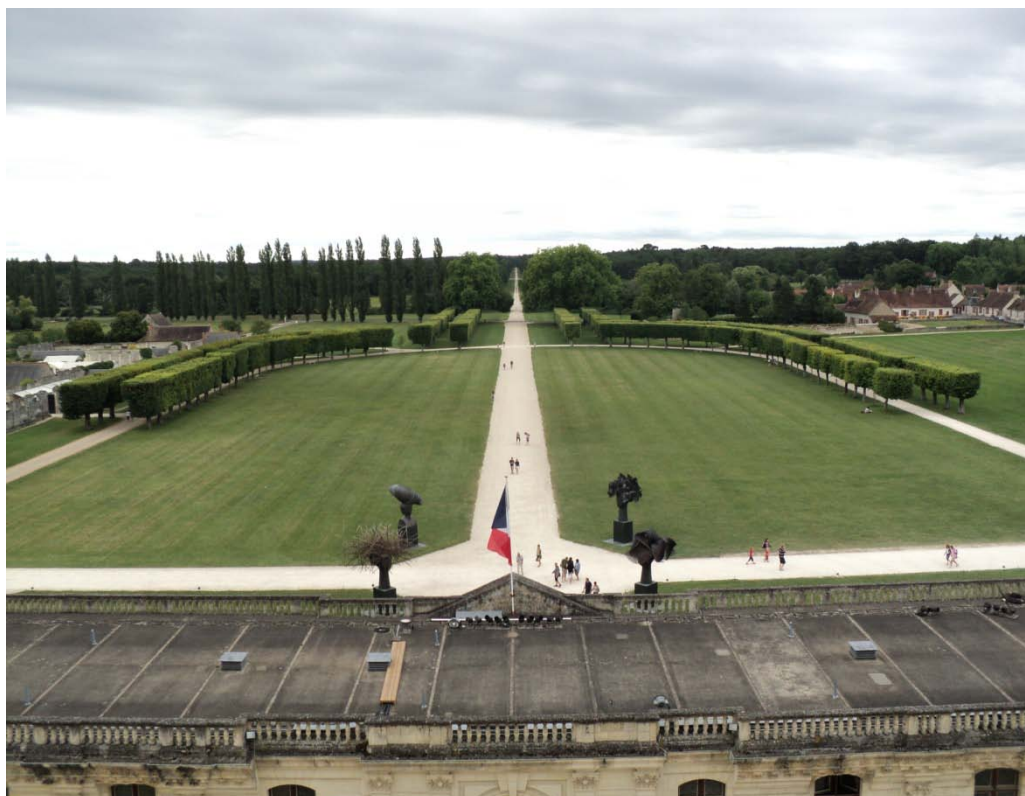
CASTELLO DI CHAMBORD

Nel pomeriggio ,trasferimento al camping de chateaux in Bracieaux(co:N47°32'58"E1°32'50") piazzolegrandi ottime,1-08 partenza in bici per visita castello di Chambord (km 16 A.R.)tempo di visita ore 1,45 molto bello e immenso Costo €.19.00+8,00 audioguida