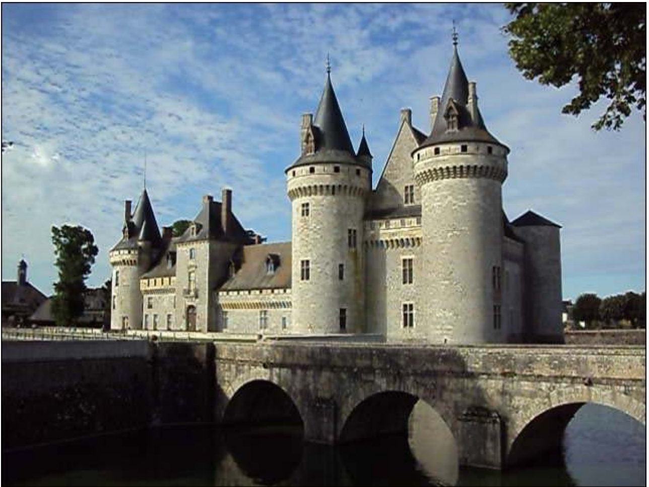
Sully sur Loire