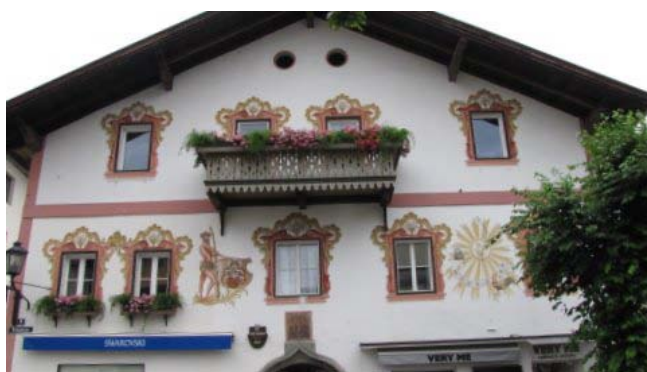
8 - Zell am See

dall’architettura gotico-romana con l’interno abbastanza austero, in controfacciata archi in gotico fiammeggiante sorreggono la tribuna dell’organo.