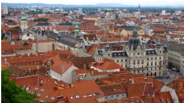
23 – Graz (la Hauptplatz e il Rathaus)

Oggi invertiamo la direzione di marcia, si torna verso ovest diretti a Graz il capoluogo della Stiria, vi arriviamo poco dopo le 10,00 dopo 189 chilometri; ci fermiamo in un parcheggio a pagamento nei pressi del centro della città e nelle immediate vicinanze del duomo. La domkirche, assieme al mausoleo dell'imperatore Ferdinando II, è purtroppo stretta fra gli edifici circostanti e non se ne coglie in pieno l'architettura esterna. L'interno, molto luminoso e a tre navate, nonostante altare e arredi barocchi, risulta molto armonioso e singolare per la copertura con volte fittamente reticolate. Percorriamo poi la Harren Gasse contornata da edifici antichi e moderni fino a giungere alla Hauptplatz con una maestosa fontana e il Rathaus. Dall'alto della torre dell'orologio, la Uhrturn,