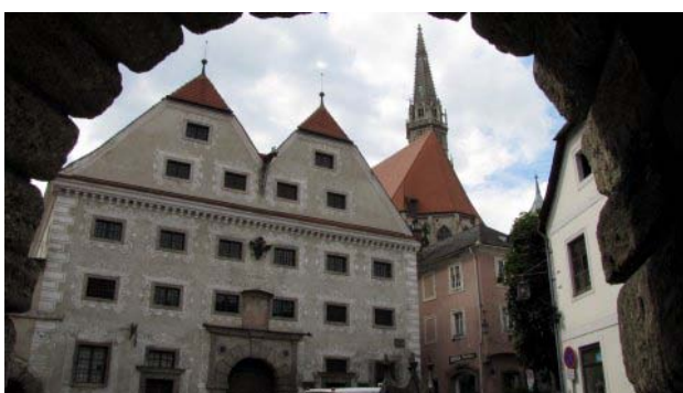
12 - Steyr

Alle 15,00 dopo il consueto riposino pomeridiano prendiamo la strada per Steyr.