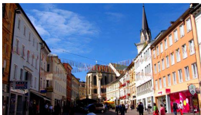
28 - Villach

Terminiamo la visita prima dell'arrivo del gruppo e alle 8,45 dopo aver salutato e ringraziato il signore che ci ha aperto la chiesa, ci muoviamo alla volta di Villach.