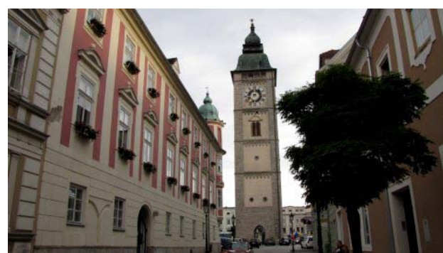
13 - Enns

Alle 15,40 (27 km) troviamo un ottimo parcheggio all’ombra , al centro della città. Steyr, una fra le cittadine più caratteristiche dell’Alta Austria, sorge alla confluenza di due fiumi sui quali, dall’alto di un castello barocco, si aprono bellissimi scorci. Notevole è il suo centro storico il cui cuore è la lunga piazza circondata da edifici gotici e palazzine rinascimentali, con negozi e vetrine dalle tipiche insegne in ferro battuto. Lasciata questa bella cittadina verso le 18,00 dopo 50 minuti e 26 km ci sistemiamo in un parcheggio alberato ad Enns, un paese piccolino ma carino e tenuto bene. Passiamo tranquillamente la notte.