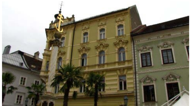
26 – Klagenfurt (l'Alter Platz)

Alle 16.15, dopo 48 chilometri, ci fermiamo in un parcheggio a pagamento a Klagenfurt capoluogo della Carinzia. Ci aggiriamo per la parte più antica il cui centro è occupato dall'ampia piazza con la fontana del drago, poi passeggiando fra eleganti edifici raggiungiamo l'Alter Platz e il palazzo del governo regionale.