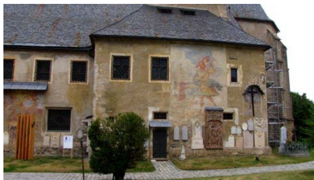
27 – Maria Saal (il S. Cristoforo)

Le nostre ormai consuete abitudini mattutine ci portano già alle 8,00 fuori dal camper e con grande sorpresa scopriamo la parrocchiale di Maria Saal, un edificio religioso stilisticamente tra i più integri fra quelli visti durante questo viaggio: una severa architettura gotica sovrastata da un tetto spiovente e da due poderose torri campanarie. Murati nella fiancata destra numerosi reperti romanici e sempre su questa parete alcuni affreschi fra cui un enorme S. Cristoforo.