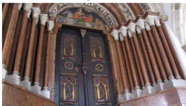
21 – Pannonhalma (il portale d'ingresso)

Riprendiamo l'autostrada, superiamo Győr per dirigerci verso Pannonhalma nota per la sua millenaria abbazia benedettina. Raggiungiamo il piazzale di ingresso e, non trovando aree per la sosta, torniamo indietro e parcheggiamo (ore 9,55 – km 37) in prossimità di una costruzione moderna che scopriamo essere il centro visite. La visita guidata è alle ore 11,00, non è purtroppo in italiano (7,50 €x1) e dura poco più di un'ora. L'abbazia, dell'XI secolo, è la seconda d'Europa per grandezza dopo quella di Montecassino. Il complesso monastico conserva una basilica a tre navate in stile gotico con alte volte a crociera, un notevole portale in marmo rosso del XIII secolo e la cripta. Interessanti sono anche la biblioteca monumentale che ospita numerosissimi libri e antichi manoscritti e un refettorio barocco. La facciata e la maggior parte della muratura esterna risale al XVIII secolo.