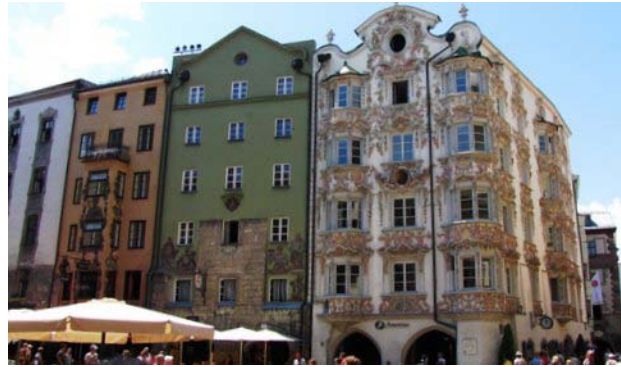
4 - Innsbruck (edificio sulla Friedrich-Strasse)

C'eravamo fermati a Innsbruck nel precedente viaggio in Austria e della città ricordavamo solo il Goldnes Dachl, in realtà tutta la Friedrich – Strasse e le strade circostanti sono contornate da case e palazzi con belle finestre e loggiati sporgenti riccamente ornati, anche la cattedrale di St. Jakob si rivela molto interessante.