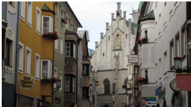
5- Schwaz (la F. Joseph-Strasse e la Pfarrkirche)

Dopo due ore lasciamo la città, la giornata è abbastanza calda e cerchiamo un po' di refrigerio all'interno di un supermercato facendo i primi acquisti. Puntiamo verso Hall in Tirolo e arriviamo alla cittadina (km 12) alle 15,50, senza accorgercene la superiamo e proseguiamo per Schwaz (ore 16,40 - km 22) dove troviamo l'unica AA (4 €) di tutto il viaggio, ottimamente segnalata e a cinque minuti dal centro.