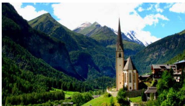
29 – Heilingenblut

Questa famosa strada panoramica collega la regione della Carinzia a quella di Salisburgo partendo da Heilingenblut fino a raggiungere Zell am See; un tratto di strada poco dopo Heilingenblut devia verso il rifugio Franz Josefs Hohe (m.2422) dominato dal massiccio del Grossglockner e dal ghiacciaio del Pasterze. Per non allontanarci troppo dal confine, scegliamo di percorrere solo questo tratto. Ripartiamo da Villach alle 11,20 e siamo a Heilingenblut alle 14,15 (km 130), dove sostiamo in un piazzale riservato agli autobus