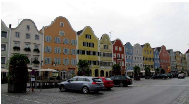
9 - Scharding

quando arriviamo a Gmunden alle 12,20 (56 km) e ci fermiamo in un parcheggio la pioggia è tale da non permetterci neanche di mettere il naso fuori dal camper, ne approfittiamo per pranzare e riposare. Alle 14,30 decidiamo di proseguire. La visita a queste ultime tre località lacustri è stata certamente compromessa.