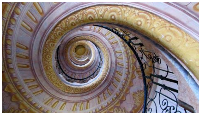
15 - Abbazia di Melk (l'imponente scala a chiocciola)

Come al solito, alla buon'ora, lasciamo il parcheggio di Enns e ci dirigiamo verso Linz, capoluogo dell'Austria Superiore. Alle 8,00 dopo 25 km siamo in un parcheeggio a pagamento abbastanza vicino al centro. La città è molto rumorosa e abbastanza deludente dopo un paio di ore siamo già sul camper per riprendere la romantikstrasse fino all'abbazia di Melk nella regione dell'Austria Inferiore. Arrivati a destinazione (ore 12,00 – km 104)