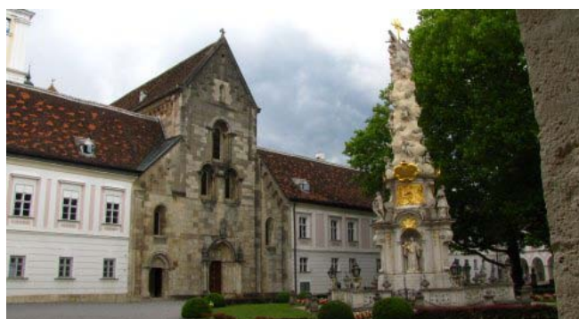
18 - Heilingenkreuz

all'estremità orientale dell'Austria, troviamo Heilingenkreuz, un villaggio sorto attorno