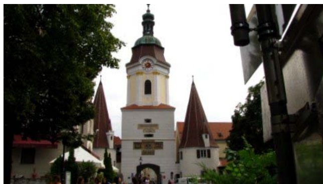
17 – Krems an der Donau (la Steiner Tor)

A 6 km da Durnstein troviamo la cittadina di Stein tutt'uno con Krems an der Donau. Lasciamo il camper in un parcheggio libero all'inizio di Stein e, attraversando questa prima cittadina, dopo una passeggiata di qualche chilometro, arriviamo a Krems, la giornata è luminosa, non fa molto caldo e ci intratteniamo piacevolmente fra le due località fino ad ora di pranzo. Al rientro, con il camper all'ombra, ci godiamo la meritata siesta.