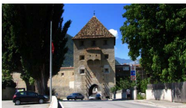
1 - Glorenza (una delle porte)

Partiamo da Bologna alle 6,40, un orario non insolito per noi, e dopo una sosta in un'area di servizio per il rifornimento di carburante usciamo a Bolzano Sud alle 10,15 (km 287) 18,40 € di pedaggio, arriviamo a Glorenza alle 11,50 (km 79). Parcheggiamo in un' area che segnaliamo come adatta anche per la sosta notturna, siamo a 100 metri da una delle porte del paese, la sosta per l'intera giornata è di 2€ La cittadina è molto carina e in un'ora la si percorre in lungo e in largo; approfittiamo di un chiosco e di tavolini lungo il torrente per un panino e una bibita, poi tornati al camper che è all'ombra di alti pioppi ci concediamo un riposino.