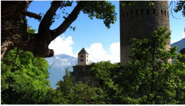
2 - Malles

Partiamo alle 15,40 verso Malles, una cittadina a pochi chilometri da Glorenza (km 7), ci siamo accorti di non aver portato antibiotici (non si sa mai!) e cerchiamo una farmacia. Dopo un quarto d'ora parcheggiamo in una piazzetta vicino al centro di Malles, troviamo una farmacia ma, naturalmente, senza ricetta medica niente antibiotico, ci consoliamo acquistando speck e altri prodotti tipici in un negozio vicino.