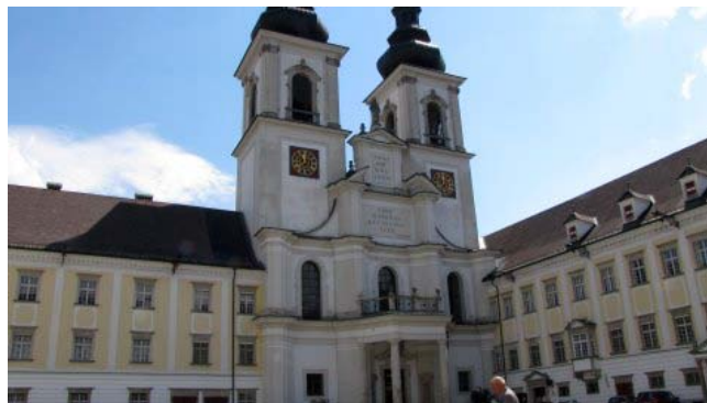
11 - Kremsmunster

Dopo qualche sosta lungo l’autostrada, arriviamo all’abbazia di Kremsmunster alle 11,15 dopo 48 km, ci fermiamo nell’ ampio parcheggio dell’abbazia, all’ombra di alberi. Rimaniamo un po’ delusi perché non troviamo nessuna indicazione per la visita, ci aggiriamo da soli per i pochi locali aperti. Arriviamo a un ricco salone decorato nel momento in cui, al termine del primo tempo di un concerto, ne