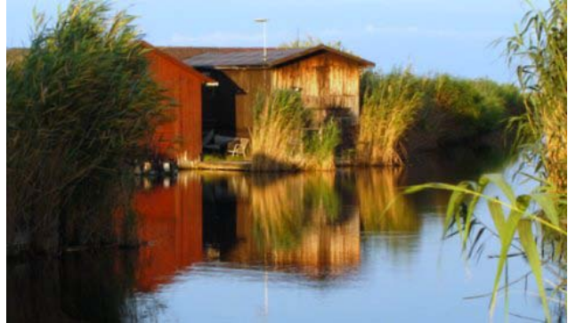
22 – Rust (capanno di pesca sul Neusiedler See)

ammirare la vegetazione di canneti attorno all'intrico dei canali dai quali, nella luce di uno splendido tramonto, emergono i tetti dei capanni di pesca e gli alberi delle barche. Dormiamo ancora a Rust accompagnati dal leggero picchietto della pioggia sul tetto del camper.