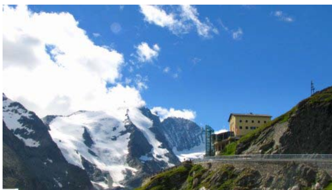
30 – Grossglockner (il rifugio Franz Josefs Kaiser)

per un rapido spuntino. Alle 14,50 iniziamo, in forte salita, il tratto iniziale della strada panoramica, dopo poco più di un chilometro ci fermiamo alla barriera per il pagamento del pedaggio (28 €). La cifra (la stessa per tutto il tratto di circa 60 km) che può sembrare eccessiva per i soli 16 chilometri che abbiamo deciso di percorrere è ampiamente compensata dalla bellezza e dalla spettacolarità dei panorami. Alle 15,40 siamo nel parcheggio vicino al rifugio F. J. K., lo spettacolo che