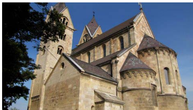
20 – Lebeny (la chiesa di St. Jakob)

La nostra prima meta è Lebeny, dove qualche guida ci segnala una delle più importanti chiese romaniche dell'Ungheria. Troviamo questo villaggio con un po' di fatica (ore 8,50 – km 38) le cartine del navigatore, forse perché non aggiornate, non danno molti dettagli della zona. Nonostante ciò riusciamo a trovare la magnifica chiesa dedicata a S. Giacomo dietro la quale parcheggiamo : scopriamo con sorpresa che l'imponente chiesa che abbiamo di fronte è la stessa che aveva attirato la nostra attenzione nel 2000 durante il nostro viaggio verso Budapest. Ammiriamo ancora una volta il gioco delle tre absidi e le preziose decorazioni dei due portali, purtroppo l'edificio è chiuso e non possiamo rivederne l'interno.