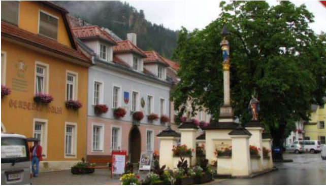
24 - Oberwolz

Verso le 8,00 piove ancora: rinunciamo a visitare Judenburg e decidiamo di proseguire per