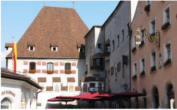
6 - Hall in Tirol (la Oberer Stadplatz)

destra rispetto all'asse della navata centrale. La giornata è ancora fresca, passeggiando nella parte bassa della cittadina raggiungiamo la Burg Hassegg, la torre della zecca con coronamento superiore a dodici lati.