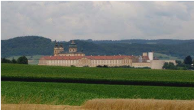
14 - Abbazia di Melk

sostiamo in un parcheeggio gratuito dalla parte del Danubio e decidiamo di salire all'abbazia dopo esserci rifocillati e riposati.