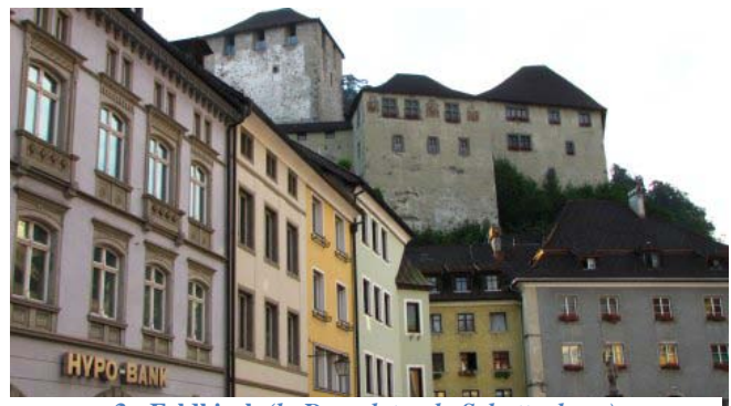
3 - Feldkirch (la Domplatz e lo Schattenburg)

Arriviamo a Feldkirch (km 159) alle 19,30 giriamo un po' per la cittadina cercando di trovare un'area adatta anche alla sosta notturna, alla fine ritorniamo indietro all'ingresso del paese dove abbiamo visto in precedenza l'indicazione di un parcheggio in direzione del castello che sovrasta il centro urbano (lo Schattenburg), ci dirigiamo in questa direzione e, in alto, in ottima posizione, troviamo un parcheggio alberato con piazzole ampie e livellate: è un parcheggio a pagamento dalle 8,00 alle 18,00 ma gratuito a quest'ora della sera, pertanto decidiamo di parcheggiare e fermarci lì anche per la notte. Poco dopo arriva un altro camper con due ragazzi svizzeri.