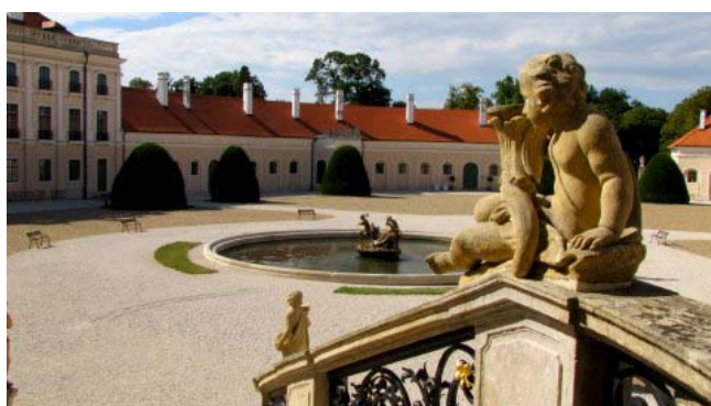
22 – Fertod (Palazzo Esterházy)

Verso le 14,00 si riparte in direzione di Fertod dove arriviamo alle 15,20 dopo 79 km, sostiamo in un ampio parcheggio pagando 260 fiorini (circa 1 €).