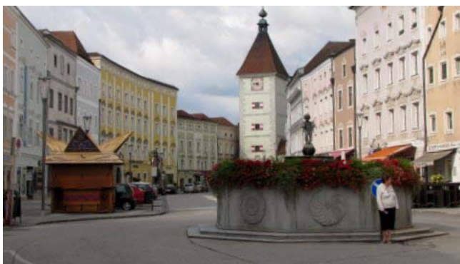
10 - Wels (la stadplatz)

Alle 7.30, dopo una notte di pioggia, un timido sole sembra promettere bene; il tempo necessario per qualche ultima foto a Scharding vista dall’altra parte dell’Inn e, ripercorrendo un pezzo della strada del giorno prima, ci dirigiamo lungo la romantikstrasse .