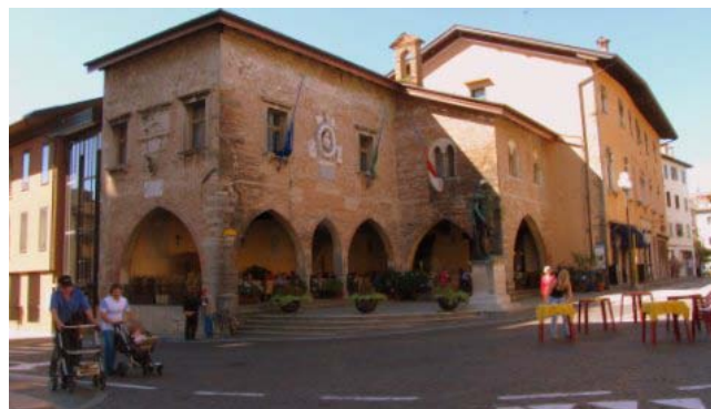
31 – Cividale del Friuli (il palazzo comunale)

alpina selvaggia e a tratti quasi inospitale, rovine di fortini militari sembrano ricordarci il costo di un'assurda difesa del sacro suolo e dei confini. Solo dopo Bovec l'orizzonte si allarga e dopo aver attraversato Caporetto (Kobarid) rientriamo in Italia e alle 9,45 (80 km) siamo a Cividale.