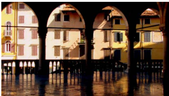
32 – Udine (Loggia del Lionello)

Prima del viaggio ci era capitato di vedere, da qualche parte, uno scorcio del centro storico di Udine così ci è venuta la curiosità di vedere questa città da vicino. Parcheggiamo in piazza Primo maggio