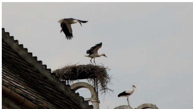
19 – Rust (le cicogne)

Quasi tutti i comignoli della cittadina di Rust ospitano famiglie di cicogne e il paese è molto caratteristico; la vicinanza all'Ungheria si riflette nell'architettura del centro urbano costituito da basse case dai tetti spioventi, con facciate dipinte e decorate con colori luminosi ma senza i fregi dorati tipici delle altre cittadine austriache. Molto bella la piazzetta prospiciente la chiesa dei pescatori. Dormiamo tranquilli come al solito.