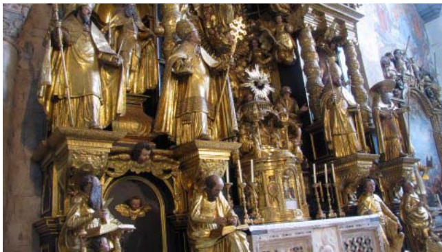
25 – Abbazia di Gurk (l'altare maggiore)

Arriviamo a Gurk (ore 11,35 – km 60) dove parcheggiamo a ridosso del muro di cinta del cimitero all'interno del quale sorge la possente cattedrale dell'abbazia. Apprendiamo con sorpresa che è prevista una visita guidata in Italiano alle ore 14,00, pertanto decidiamo di tornare in camper per