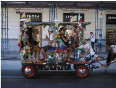
Mezzi di locomozione

Oggi riposo all'ombra degli ulivi al campeggio dopo aver fatto un giro per il paese al mattino ed aver comprato il pesce da mangiare questa sera.