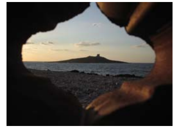
Isola delle Femmine