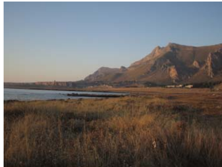
Piana di Macari