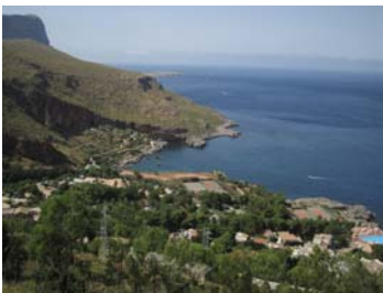
Riserva dello Zingaro

Mattina sul tender (finalmente il motore funziona). Purtroppo non peschiamo molto e a causa dell'aumento delle onde, ritorniamo velocemente. Anche il tempo cambia e decidiamo di metterci in viaggio. Alle 15.30 partiamo e andiamo a vedere la Riserva dello Zingaro da San Vito lo Capo. Incontriamo delle capre in posizione strana sopra ad una fontanella, praticamente erano in posa per la foto. Vista la Riserva ci dirigiamo a Busto Palizzolo per fare carico\scarico dell'acqua e ci dirigiamo ad Alcamo. AIUTOOOOO, salite e discese sperverse con grossi avvallamenti e niente parcheggi. Scappiamo e ci fermiamo a fare un po' di spesa (31€) e poi ci dirigiamo a Calatafimi e, dopo due inversioni di marcia da panico, raggiungiamo un parcheggio come punto sosta per la notte, (parcheggio non proprio in piano). Siamo quasi tentati di raggiungere Segesta, per vedere le rovine al tramonto ma per fortuna troviamo dei camperisti di Modena che ci sono appena andati e alle 19 hanno trovato il parcheggio chiuso. Mangiamo i pesciolini pescati al mattino e poi a nanna, un po' storti per dire la verità.