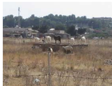
Capre sulla fontana