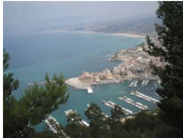
Castellammare del golfo