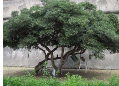
Giardino dei pensionati a Palermo