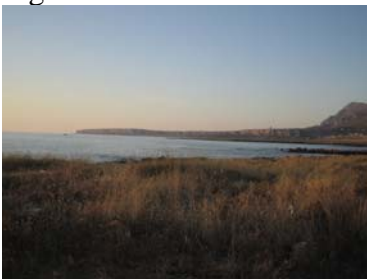
Piana di Macari

Alle 18.30 arriviamo finalmente in paradiso, alla Piana di Macari, sono passati 12 mesi da quando l'abbiamo lasciata, ma è rimasta scolpita nelle nostre menti e in quella di Toby, appena parcheggiato e aperto la porta, l'ammasso di pelo si è lanciato in acqua, naturalmente l'abbiamo seguito volentieri.