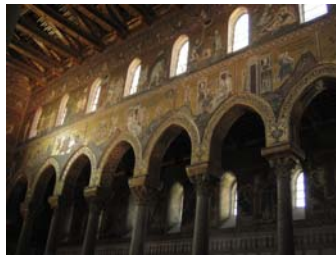
Cattedrale di Monreale