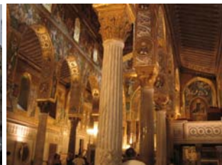
P.zza Pretoria; La martorana e S. Cataldo; Cattedrale; Cappella Palatina