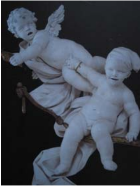
Oratorio di San Lorenzo