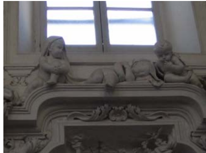
Oratorio di Santa Cita