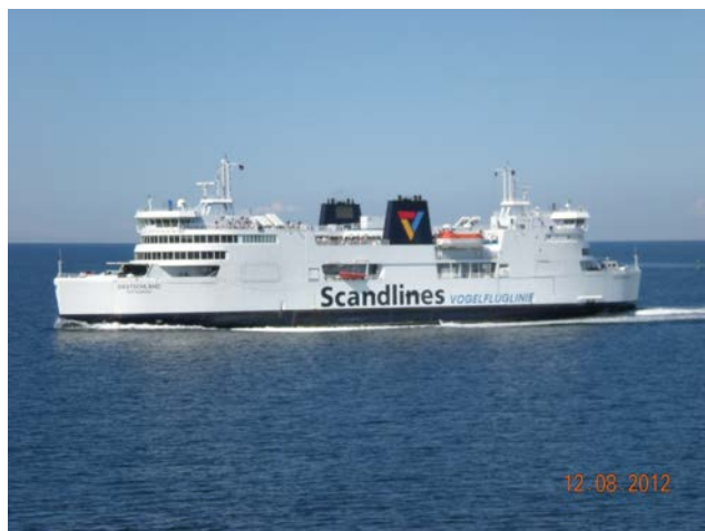
TRAGHETTO PER LA DANIMARCA

Giriamo un po' la penisola di MON e dopo si riprende l'autostrada per la Capitale, arriviamo alle 17:30 e subito troviamo il CityCamp (unico per i camper) ma un posto lo troviamo! Il gestore parla un poco l'Italiano quindi no problem... attrezzato per bene direi! Corrente, docce, C.S. (non ombreggiato) ma visto il tempo bello e arieggiato non ci interessa! Dopo la sistemazione e cena (anche se stanchi) si fa (come dire) i quattro passi e lo merita veramente non ci crediamo ai nostri occhi...tutto sembra una favola, i colori, l'arietta che rinfresca, ci dimentichiamo la stanchezza...ma bisogna pensare al domani, non possiamo farlo a letto! € 35,00 al giorno GPS 55°39'35" N 12°33'32" E Costo traghetto € 83,00 + 4,00 per camper < a 6 Mt (senza bici) Km 559