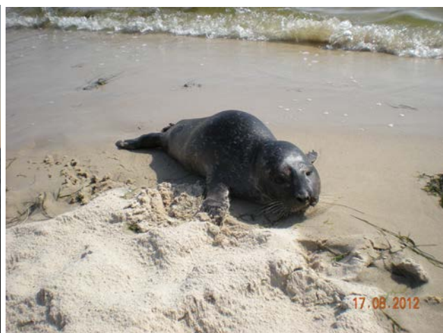
E CUCCILO DI FOCA

Sabato 18 Stanotte è passata una perturbazione e la pioggia ha fatto fresco, ma la giornata si presenta ottima.