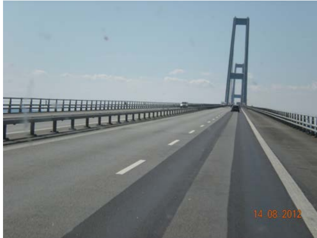
IL PONTE DI STOREBAELT