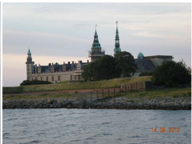
IL CASTELLO DI AMLETO

Mercoledì 15 Riposato bene, e si riparte direzione ARHUS la nostra meta è sempre nord per adesso! Il porto ci ospita (come sempre) e li ci sono dei camper Italiani, ci si scambia varie informazioni, e visitiamo il centro molto affollato e con tanti negozi, ma come sempre merita! Poi ci spostiamo a EBELTOFT paese molto caratteristico con un bellissimo veliero in porto, e la case con il tetto di paglia...sembra che il tempo si sia fermato... Strada facendo ci fermiamo a GRENA e poi a UDBYHOS e li si deve traghettare per passare un fiordo, il costo è di 90 DKK E finalmente arriviamo alla meta SKACEN (il faro di GRENEM) si parcheggia a pagamento dalle 9 alle 18 = 12 DKK all'ora e dalle 22 alle 9 = 150 DKK il buco dalle 18 alle 22 è gratis, quello che ci permetterà di fare la visita a questo punto del nord dove i mari si incrociano (mare del nord e mar baltico) A queste latitudini il sole comincia a fare gli straordinari e noi ne approfittiamo visto il tempo stupendo!!!! Ci spostiamo al porto dove trascorreremo la notte (gratis) GPS 57°43'07" N 10°35'23" E Km 410