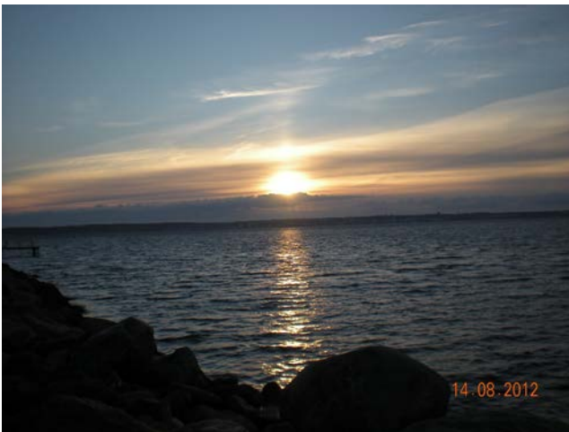
ALBA A HELSINGOR