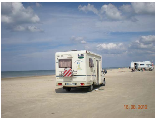
LA SPIAGGIA DI LOKKEN