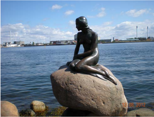
LA SIRENETTA DI COPENAGHEN