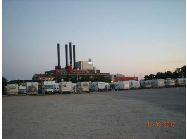
CITYCAMP DI COPENAGHEN

Copenaghen...la donna al mondo più amata e fotografata... era in programma il tour in battello ma non ci siamo riusciti...e dopo la doccia e un riposino, siamo partiti direzione ELSINGOR 50 Km a nord, dove troviamo il Park al porto, con la possibilità di C.S. (gratis) e, a 300 Mt si trova il castello di Kromborg (Amleto) e li pernottiamo assieme a camper Italiani!