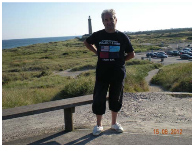
IL FARO GRELEN (IL PUNTO + A NOR DELL DANIMARCA)