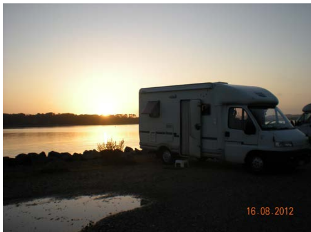
SOSTA AL PORTO DI HVIDE SAMDE