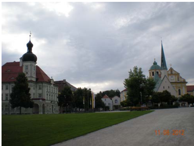
SANTUARIO DI ALTOTTING

Sabato 11 Alle ore 8 sveglia, e visita al Santuario che si trova a 5 minuti dal Park, la giornata è bella! Molto interessante, piccolo come struttura, rivestito in legno con tantissime targhe di grazie ricevute! E all'interno tutto in argento. Anche il paese è molto bello e dopo la visita si parte riprendendo l'autostrada che a causa dei lavori si percorre a singhiozzo.