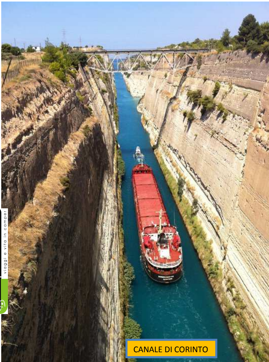
CANALE DI CORINTO

Sabato 20 Agosto: Sveglia, e spiaggia, sarà l'ultimo bagno. Poi vuotiamo il tutto e partiamo, vogliamo vedere l'istmo. Ci perdiamo, non troviamo i cartelli e anche a chiedere nessuno mi aiuta. Così decido per l'autostrada, se vado verso Atene sicuramente lo passo. Peccato solo che l'autostrada mi tocca pagarla per fare solo 7 km ed uscire per tornare indietro. Alla fine però riusciamo a fermarci ed addirittura fare una foto mentre lo attraversano. Dal vivo è meglio molto meglio.