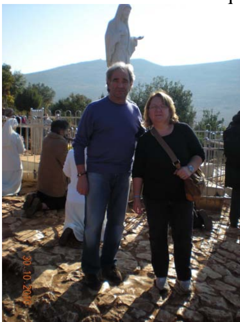
La nostra presenza