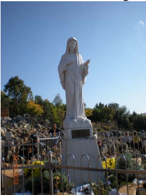
La Madonna al Podprodo

Ci incamminiamo verso la salita che non è difficoltosa, con attenzione la possono fare tutti, ci fa compagnia il SILENZIO e molti pellegrini raccolti in preghiera, piano piano arriviamo alla Madonna (un grande statua che è stata offerta da un Pellegrinaggio Coreano).