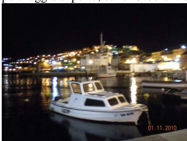
Porticciolo di Senj

Sempre direzione Fiume e poi si raggiunge Senj, arriviamo alle 22:30 si parcheggia al porto, dalle 19:00 alle 07:00 gratis. Km. 320