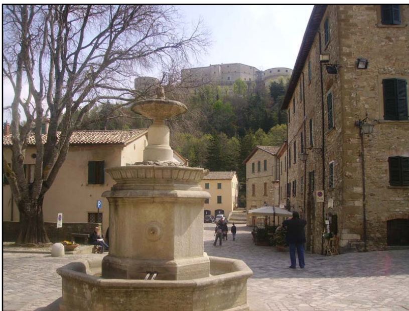
Il castello visto dalla Piazza del Borgo

Entrati in paese i negozi che espongono prodotti tipici locali (pecorino di fossa di Talamello, pecorino sotto le foglie di noci, prosciutto di Carpegna , miele di San Leo) stanno aprendo ma prima di addentrarci nelle compere e nella visita del borgo decidiamo di compiere la salita verso la Rocca.