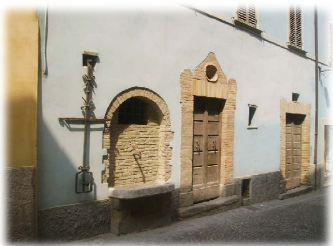
una vecchia pompa per l'acqua con fontana

Con nostra grande delusione non ci è stato possibile la visita interna in quanto la Chiesa resta aperta solo la mattina fino alle 12,30. L'antico chiostro del convento è l'attuale Piazza San Francesco, su cui si affaccia la Sala del Capitolo, con due bifore gotiche e il Museo di S. Francesco. Passeggiando attraverso il borgo incontriamo altri importanti monumenti: LA Chiesa Di Santa Chiara (riedificata nel 1646), il monastero e casa natale di santa Veronica Giuliani, il Palazzo ducale (XV SEC.) attribuito a Giorgio Martini, il palazzaccio (sec. XVI), il Monte di Pietà (fondata nel 1516) ma ciò che ci affascina sono i vicoletti e gli scorci tipicamente di atmosfera medioevale.