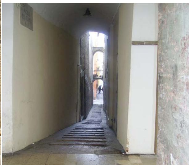
Due immagine del corso a Fossombrone

E' propria questa caratteristica che notiamo e respiriamo nelle sue viuzze e non solo nel Corso e ciò rende questa cittadina notevolmente diversa rispetto alle altre finora visitate.