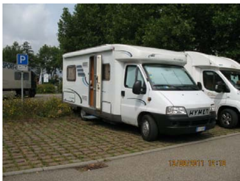
BAD MERGENTHEIM La sosta diurna