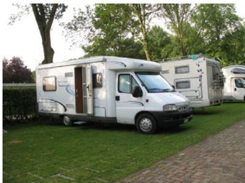
DELFT Il Camping Delftse Hout (N 52.01740 E 4.37882)