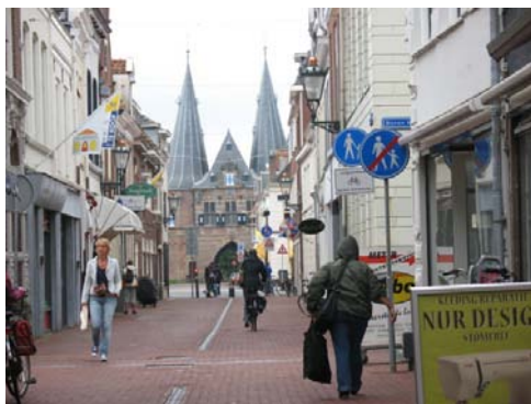
KAMPEN La città