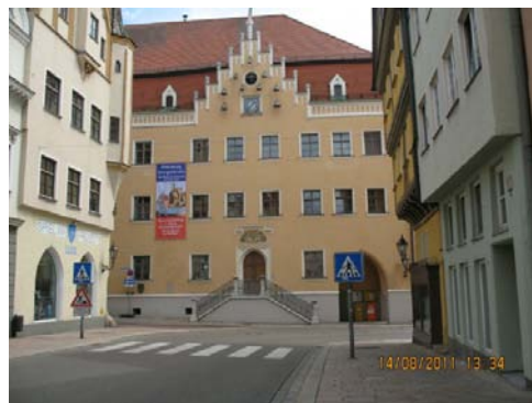
DONAUWÖRTH La Reichsstrasse (particolare)