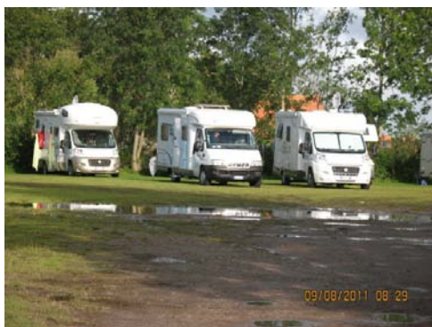
GIETHOORN Il campeggio (N 52.72134 E 6.07449)