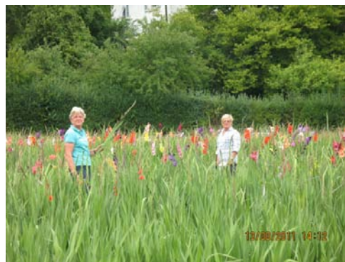
WEIKERSHEIM Il campo di gladioli