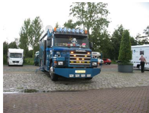
KAMPEN L'Area di sosta