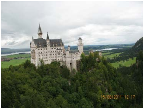
NEUSCHWANSTEIN Il castello