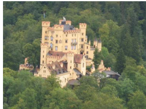
HOHENSCHWANGAU Il castello