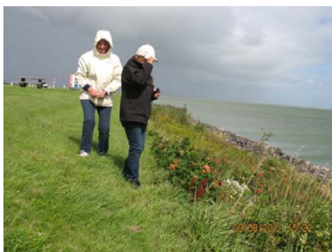
AFSLUITDIJK La sosta sulla diga