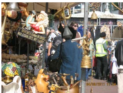
AMSTERDAM Waterlooplein (il mercato all'aperto)