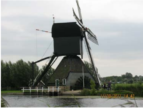
KINDERDIJK (uno dei mulini)