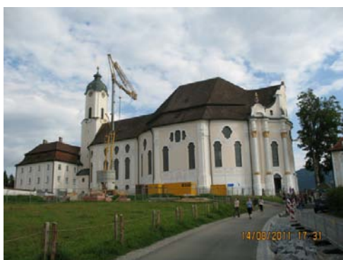
WIESKIRCHE Il Santuario