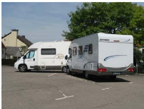
DONAUWÖRTH Il parcheggio diurno

Con la dispendiosa costruzione dei castelli, con lo stile di vita sregolato e con un appoggio troppo generoso al suo amico Wagner accumulò debiti eccessivi e divenne sempre più imbarazzante per la casa reale della Baviera. Dichiarato pazzo, morì poi a quarantuno anni in condizioni misteriose. Neuschwanstein sembra uscito da una favola medievale, Hohenschwangau è il castello dei genitori. Troviamo posto in un parcheggio per auto, per l'occasione anche per la sosta camper per favorire l'affluenza dei turisti in occasione di un tipico mercatino artigianale (N 47.57336 E 10.73679). La cittadina non offre alcun interesse turistico, per cui - dopo una piacevole passeggiata - alle 21.00 rientriamo ai camper.