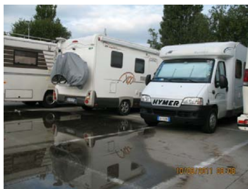
DEN HELDER Il parcheggio per la sosta notturna (N 52.95476 E 4.76447)