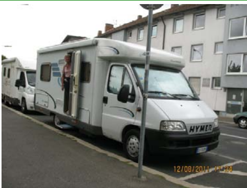
WURZBURG Dreikronenstrasse - La sosta diurna