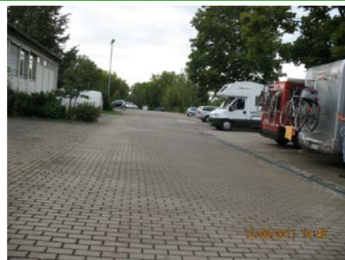
TAUBERBISCHOFSSHEIM La sosta notturna (N 49.62103 E 9.66643)