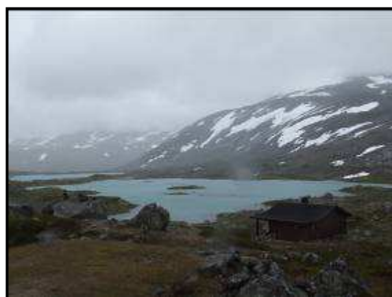
Panorama sulla strada 258

Riprendiamo poi la strada e giunti a Grotti deviamo lungo la 258 (su suggerimento dei sardi incontrati a Vallidal). Il primo km è in mezzo ad una vegetazione più che normale, ma subito dopo la veduta si trasforma in laghi azzurri e limpidissimi, prati, montagne innevate... semplicemente stupendo!!!