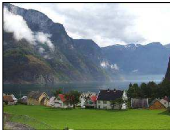
Il piccolo paese di Undredal

Riprendiamo la E16 fino a Voss. Lungo la strada ci sono dei bei torrenti e decidiamo di fermarci x pranzo in un'area pic nic.