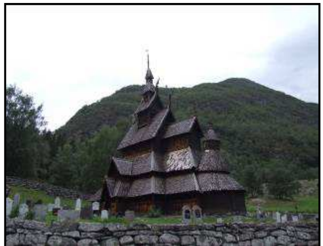
La stavkirke di Borgund