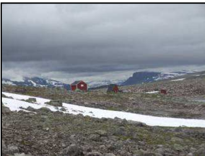
Panorama della strada antica

Dormiamo ad Aurland insieme con altri camper sul porto.