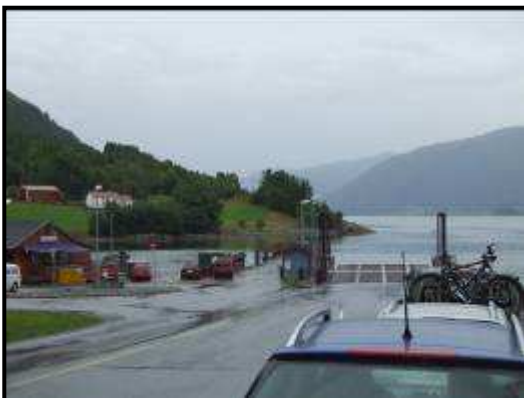
Solsnes: imbarco per Afarnes

Sostiamo nel parcheggio camper sul porto di Andalsnes insieme ad altri camper.