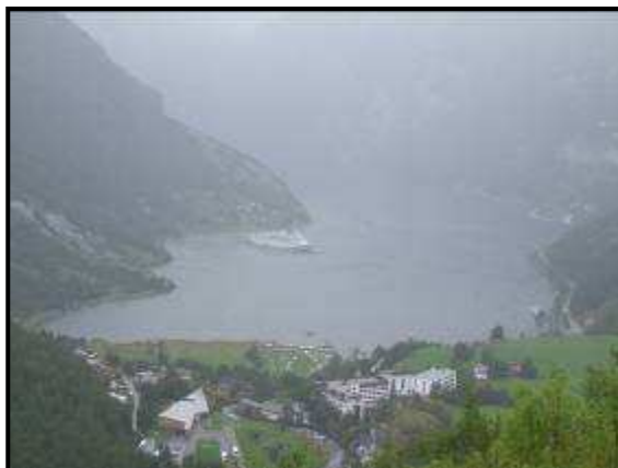
Il fiordo di Geiranger