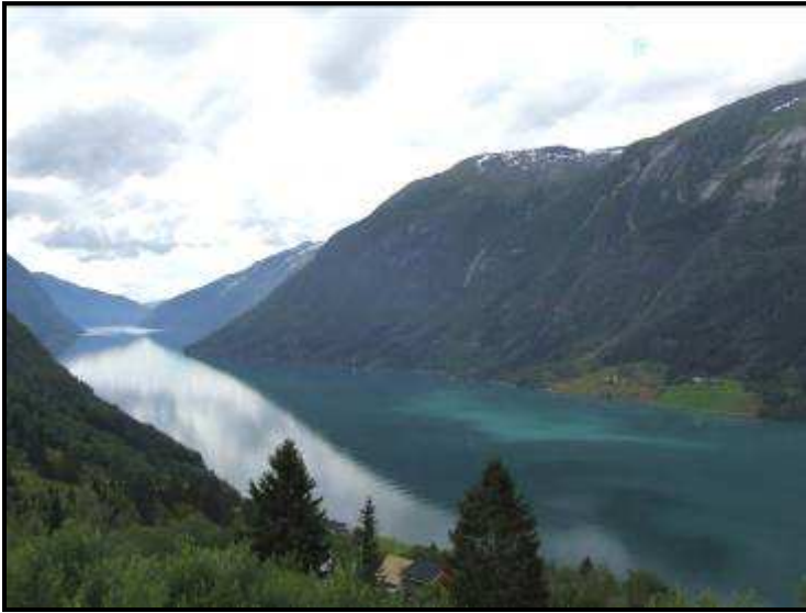
Il fiordo di Sogndal

Al mattino partiamo e salutiamo, dopo una chiacchierata di quasi un'ora, la simpatica signora spagnola e che ci chiede di inviarle la foto che abbiamo fatto insieme... che carina!!!