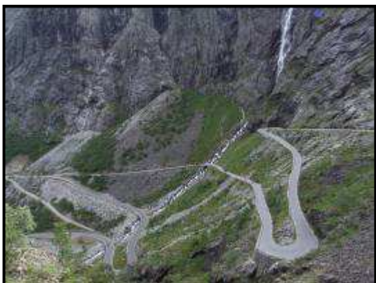
La strada dei Trolls