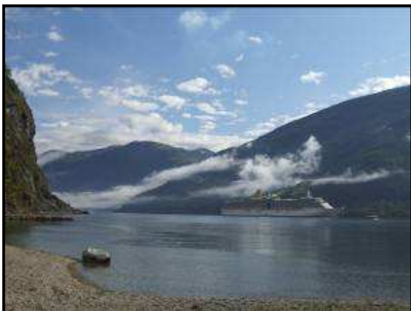
Una nave Costa Crociera

Così a malincuore abbiamo proseguito il viaggio. Abbiamo deviato sulla E16 per la 601 per comprare dei formaggi tipici in un piccolo paesino, Undredal. Qui si trova anche la più piccola stavkirke della Norvegia, con soli 40 posti.