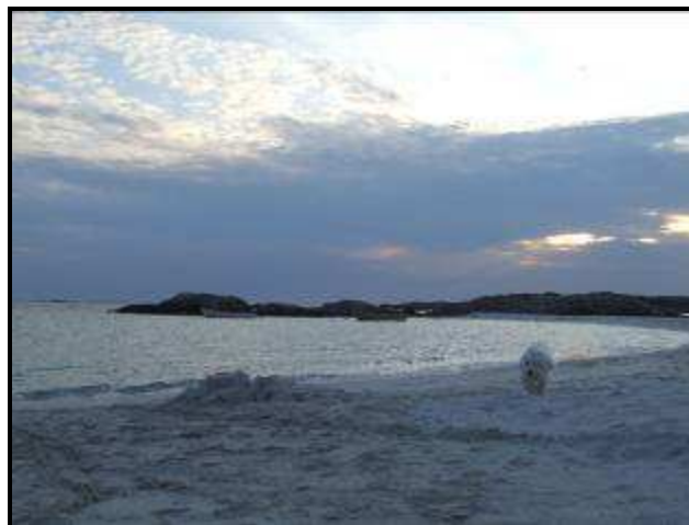
Sparky in esplorazione

Ci divertiamo con Sparky a scorrazzare sulla spiaggia per un'oretta, poi riprendiamo la 47 e poi la 39 in direzione Stavanger e arriviamo sull'Isola di Ognoy dove il paesaggio ricorda quello della Strada Atlantica. Troviamo un'area pic nic nascosta lungo la strada e ci fermiamo a dormire. Il paesaggio è bellissimo, siamo in pratica su un piccolo isolotto in mezzo al mare.