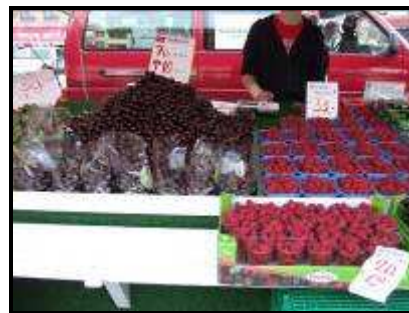
Il Mercato del pesce