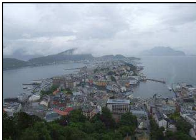
Vista di Alesund