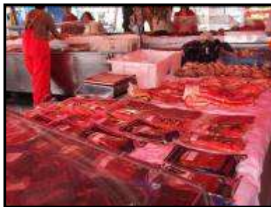
Il mercato del pesce