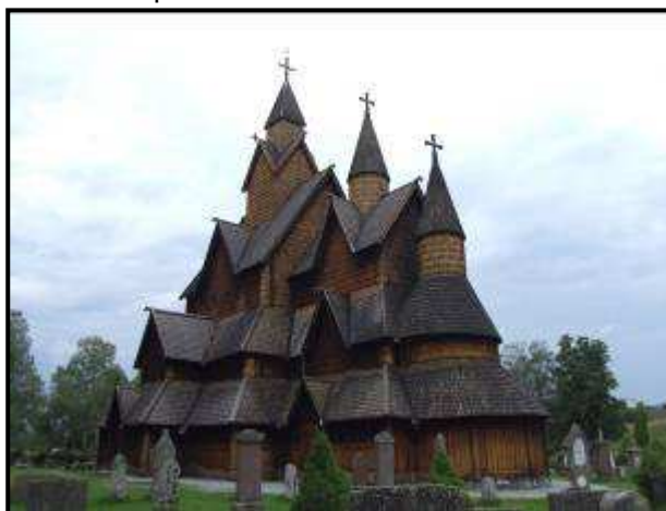
La stavkirke di Heddal

Data la sua posizione particolare, viene spesso chiamata "la cattedrale".