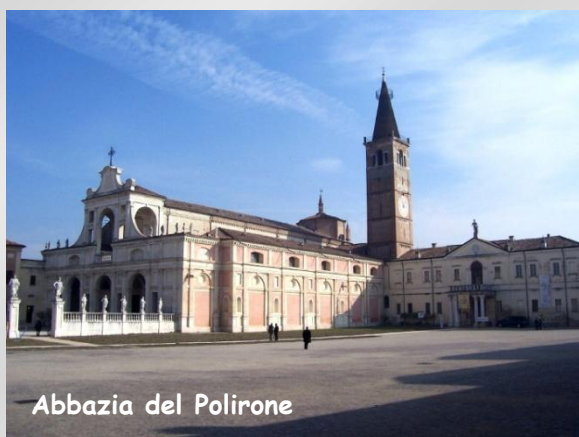
Abbazia del Polirone

La prima tappa di oggi è San Benedetto Po, la cui storia è legata inescindibilmente con la nascita, la vita, lo sviluppo e la soppressione napoleonica dell'Abbazia del Polirone, uno dei siti cluniacensi