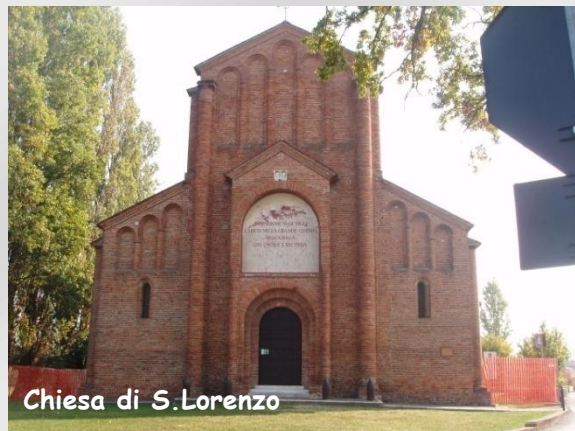
Chiesa di S. Lorenzo

Due significativi restauri furono eseguiti nel XVIII sec. E negli anni 1924-32, quando fu destinata a Famedio dei Caduti della prima guerra mondiale. (Il famedio è una costruzione destinata alla sepoltura o alla memoria di personaggi illustri. Costruito a forma di tempio è generalmente posto all'ingresso del cimitero. Talvolta indica anche il luogo in memoria dei caduti in guerra).