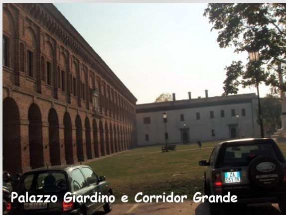
Palazzo Giardino e Corridor Grande

➤ Palazzo Giardino , villa suburbana, parte della zona della città