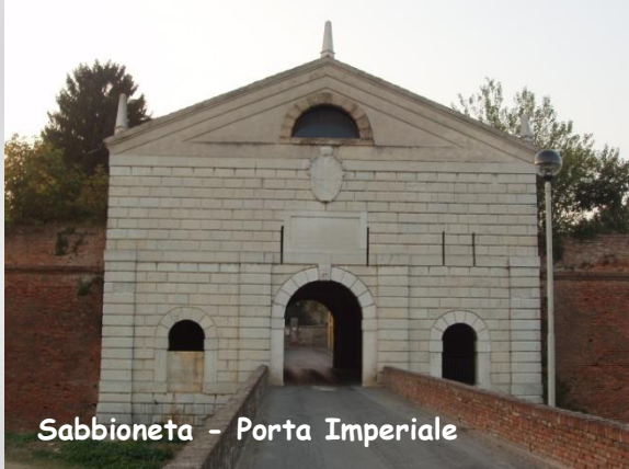
Sabbioneta - Porta Imperiale

Terminata la visita a Viadana, continuiamo il viaggio spostandoci a Sabbioneta. Dopo il capoluogo, Sabbioneta è il centro mantovano di maggior interesse artistico. Autentica "città ideale" del Cinquecento, pensata e costruita dal suo principe-mecenate Vespasiano Gonzaga (1531-1591) sul modello delle antiche città romane. Il borgo, chiuso da un'imponente cintura muraria difensiva, al quale si accede attraverso due austere e imponenti porte monumentali, contiene