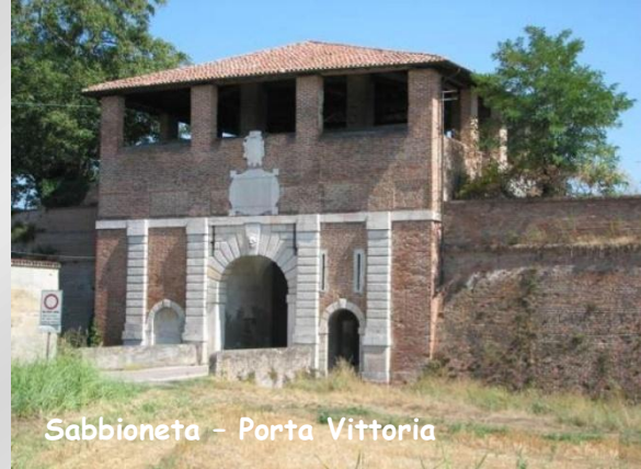
Sabbioneta - Porta Vittoria

eccellenti esempi di architettura e arte pittorica tardo rinascimentale.