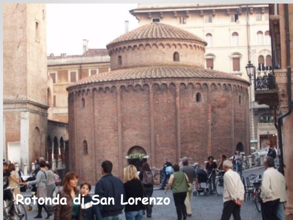
Rotonda di San Lorenzo

Sempre sulla piazza si trova la romanica Rotonda di San Lorenzo , la