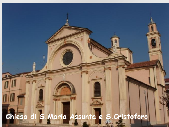
Chiesa di S. Maria Assunta e S. Cristoforo

Approfittando del parcheggio comodo e poco frequentato (N 44,98948; E 10,86376) preparo il consueto barbecue a base di pancetta e costine di maiale e bracioline di castrato. Come sempre, ne resta una generosa porzione per i nostri bimbi che la divorano con avidità.