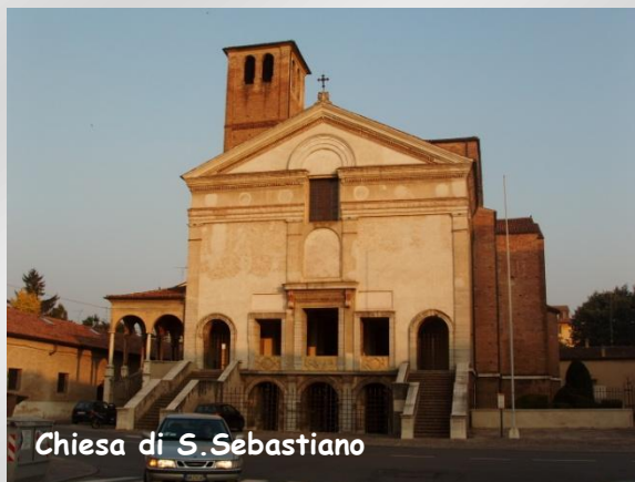
Chiesa di S. Sebastiano

Nel percorso di rientro al camper, incontriamo la Chiesa di San Sebastiano in cui il grande teorico ed architetto rinascimentale Leon Battista Alberti lasciò il segno del suo proficuo rapporto con la famiglia Gonzaga.