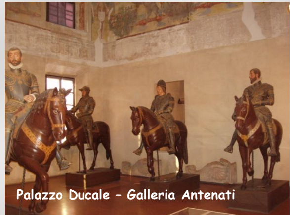
Palazzo Ducale - Galleria Antenati

➤ Palazzo Ducale , fu la dimora del duca, è a due piani con portico rialzato e terrazzo a torretta centrale, porticato al pianterreno; finestre con cornice marmoree e mensoloni che segnano la facciata. L'interno è costituito da una serie di sale e di ambienti affrescati e decorati da diversi artisti. Splendidi i soffitti lignei; spiccano nella Galleria degli Antenati i ventuno ritratti gonzagheschi in stucco, opera di Alberto Cavalli e le quattro statue lignee di personaggi a cavallo (Vespasiano Gonzaga e tre suoi ascendenti).