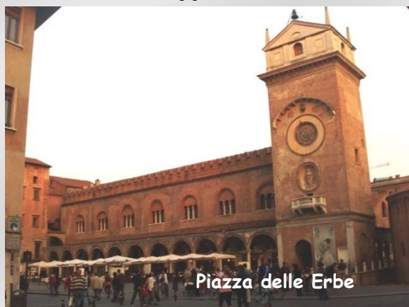
Piazza delle Erbe

Questa fu costruita a pianta rettangolare nel 1472 su progetto di Luca Fancelli e vi fu collocato, nel 1473, l'orologio a funzionamento meccanico di Bartolomeo Manfredi.