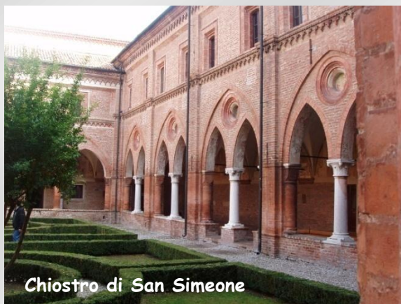
Chiostro di San Simeone

Benedetto Po cessano come per magia e ci si ritrova immersi in un silenzio assoluto, carico di suggestione. L'itinerario nella "cittadella benedettina", ben restaurata per il millenario, prosegue con la Sala del Capitolo , dove gli scavi hanno portato alla luce le tombe di alcuni abati; il grande chiostro di San Benedetto, con due soli lati superstiti; l'infermeria, adattata nel tempo agli usi più diversi, da bottonificio (lo ricorda l'incongrua ciminiera installata nel cortile) ad albergo di lusso, oggi chiuso.