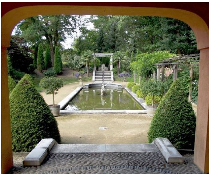
Arcen – Parco del castello “giardino Italiano”

La visita prosegue con il castello, la parte visitabile è molto limitata. La visita a questo parco dovrebbe essere inclusa in ogni viaggio in Olanda.