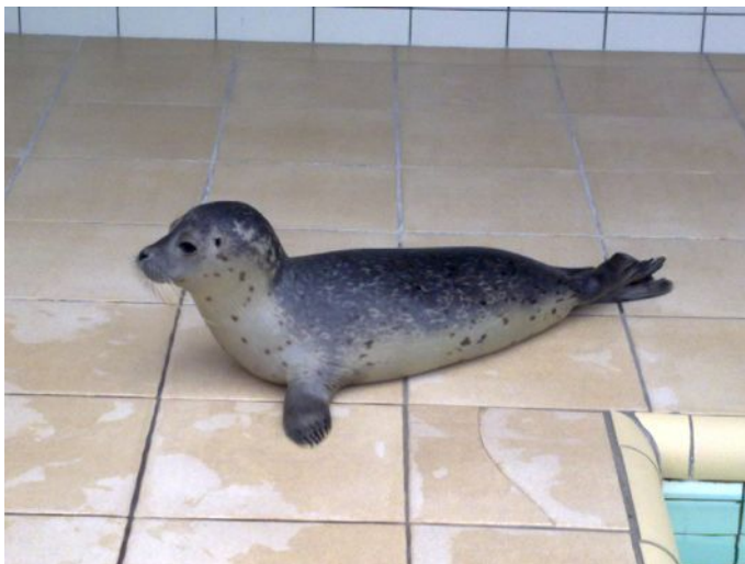
Piccolo di foca in cura presso il centro

Partiamo per l' Ecomare , troviamo parcheggio vicino all'entrata ed entriamo per la visita del museo, dell'acquario e le vasche esterne dell'ospedale per le foche.(2 adulti + 1 bambino 25,00€)