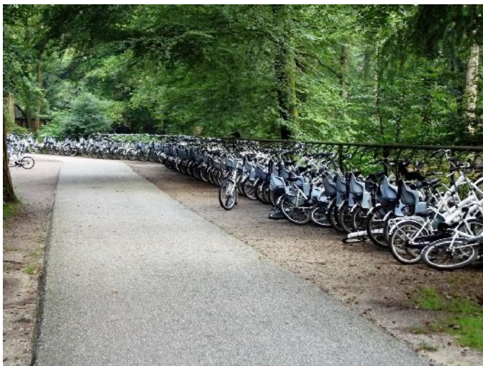
National Park De Hoge Veluwe

Chi è sprovvisto di bici può utilizzare quelle messe a disposizione dal parco!