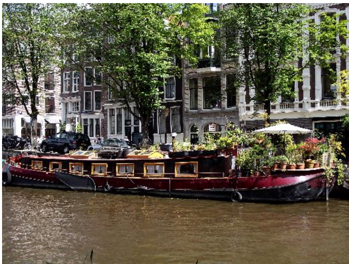
Amsterdam "Casa galleggiante" visitabile

A pancia piena ci dirigiamo verso i canali con le case galleggianti e ne visitiamo una adibita a museo, tentiamo di visitare la casa di "Anna Frank" ma la coda interminabile ci spaventa e tiriamo dritto. Passiamo per il quartiere Jordan e poi arrivati alla stazione centrale ritorniamo al camping.