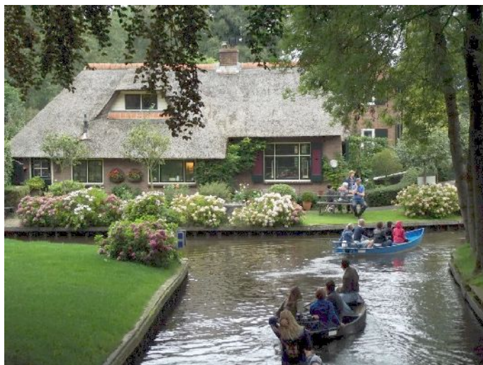
Giethoorn “per i canali”