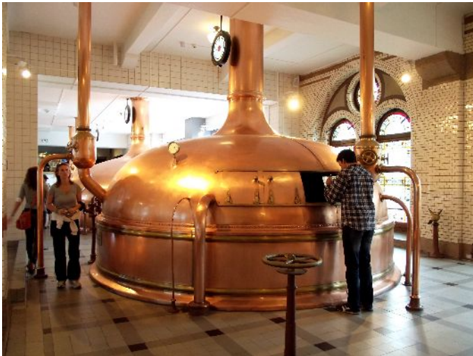
Amsterdam "Haineken experience"

Dopo esserci rilassati in mezzo a tanto verde, rientriamo al camping, dove iniziamo con una doccia, (0,75€ a gettone) per cena prendiamo delle pizze che mangiamo in camper.