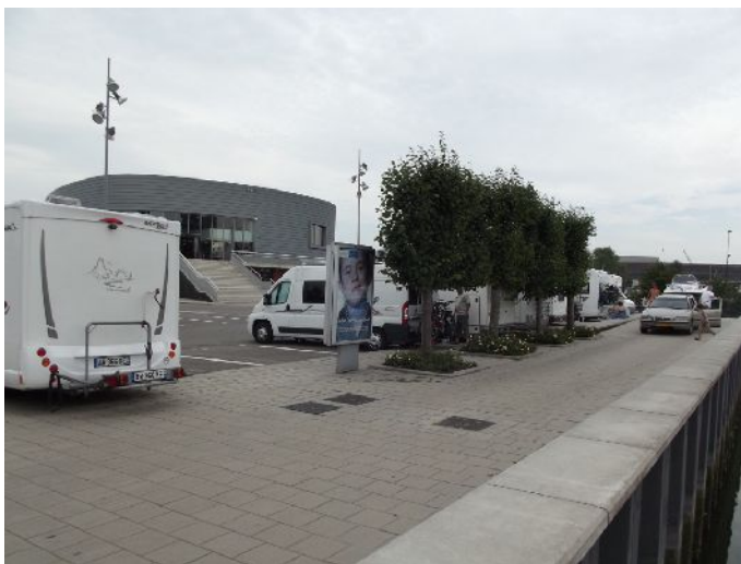
Alblassedam (N51°51,675' E4°39,404') Parcheggio gratuito

Ripartiamo dopo pranzo con destinazione Alblassedam , punto di partenza per visitare i mulini a vento, parcheggiamo alle 16:45, nei pressi del porto, 14 piazzole gratuite su asfalto. sempre nei pressi si trova l'ufficio informazioni. Facciamo una passeggiata per il paese e ceniamo in un snack bar.