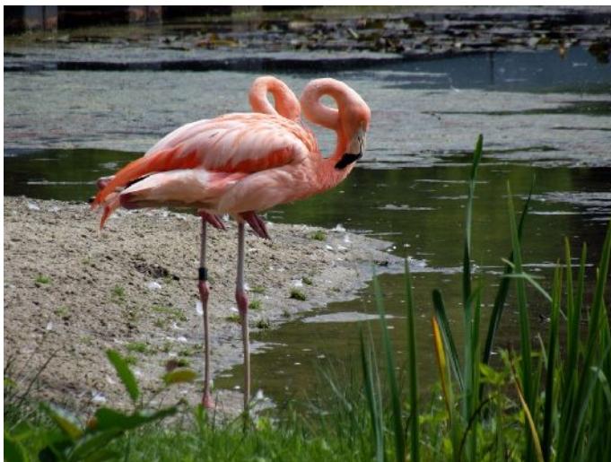
Arcen – Parco del castello “Lago dei fenicotteri”