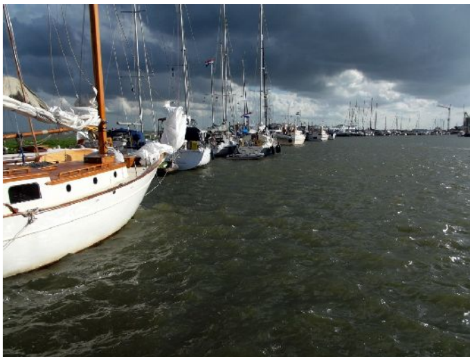
Volendam "Il porto"

Alle 18:40 partiamo alla volta di Enkhuizen dove arriviamo alle 19:45, parcheggiamo al porto dove ci sono dei posti riservati ai camper. (N52°41,875' E5°17,418')