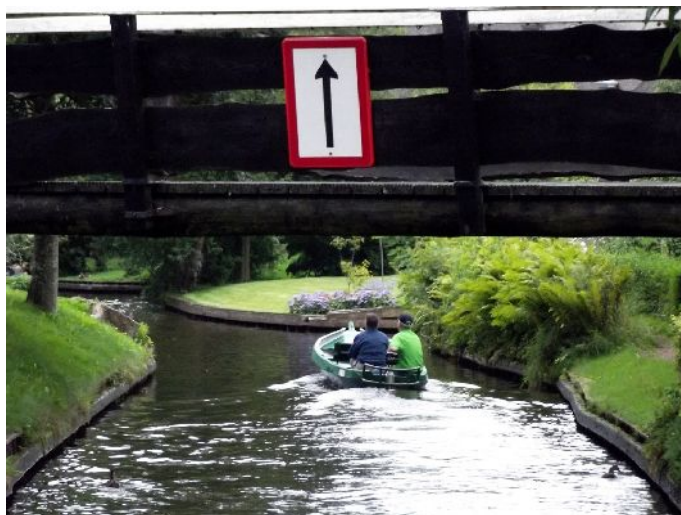
Giethoorn “per i canali seguendo la segnaletica”