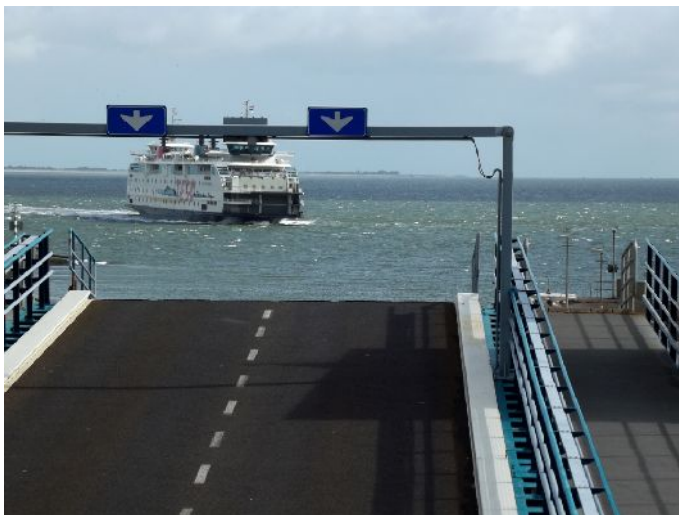
Terminal del traghetto per l'isola di TEXEL

Alle 9:45 siamo al terminal del traghetto, paghiamo il biglietto, andata e ritorno 40,30€ e ci mettiamo in coda per l'imbarco. Fino ad ora il vento forte e la pioggia ci hanno fatto compagnia. Partiamo alle 10:30 ed in 20 minuti siamo sull'isola di Texel. I gabbiani accompagnano il breve tragitto del traghetto e dai ponti si riesce a dare loro da mangiare mentre sono in volo.