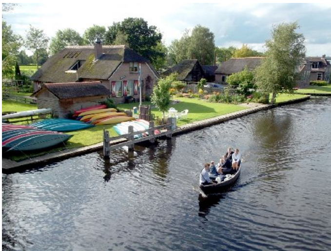
Vrijdag località "Belt-Schutsloot"