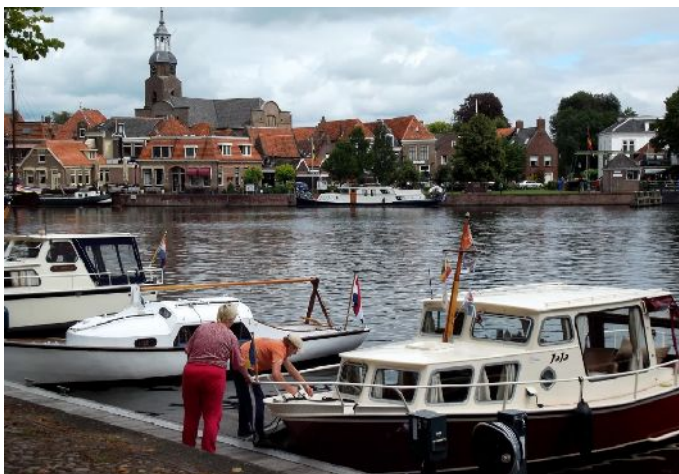
Il porticciolo di Blokzijl