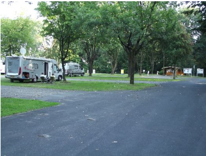
Waldfreibad Camperplatz (N51°29,688' E6° 13,591')