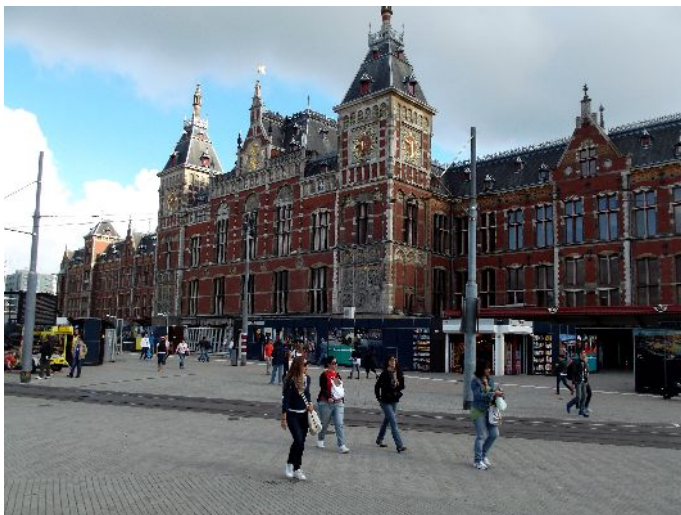
Amsterdam (Stazione centrale)