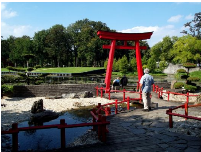
Arcen – Parco del castello “giardino Cinese”