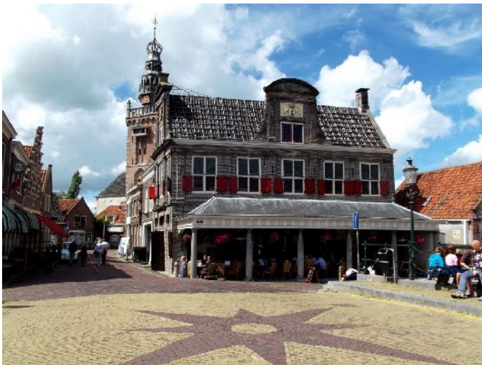
Monnikendam "Piazza principale"

Nella guida che abbiamo consultato, si descriveva la visita agli affumicato per le anguille, ma la scarsità del pescato ha portato alla chiusura di questa attività,, niente più anguille e affumicato, una statua in bronzo ricorda questa attività di altri tempi.