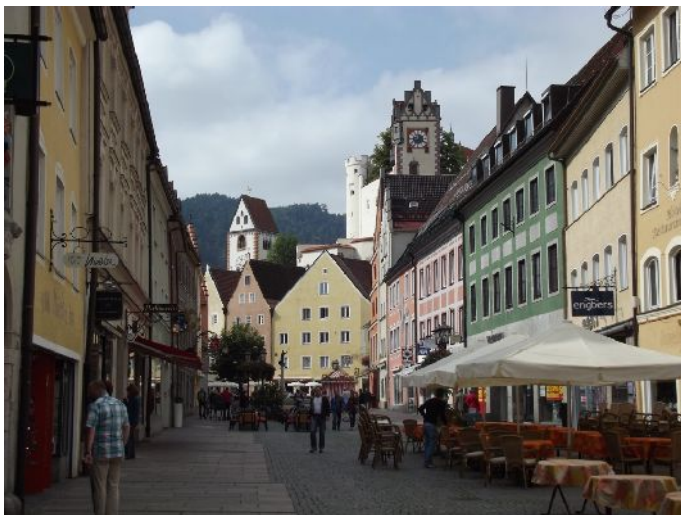
"Reichenstrasse" Via centrale di Fussen