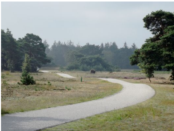
National Park De Hoge Velluwe – lungo i percorsi ciclabili