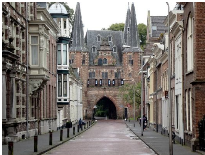
Kampen “Accesso al paese attraverso la porta sulle mura”