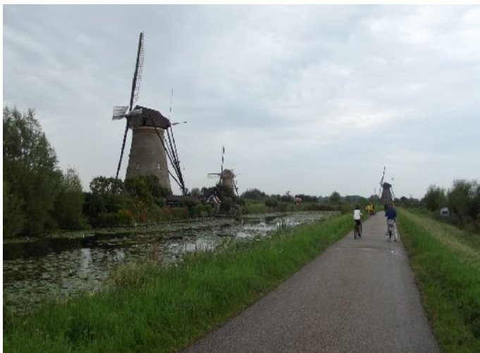
Alblassedam "Molenkade" (percorso dei mulini)