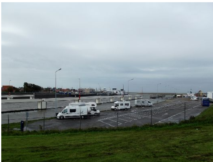
Mix-parking nei pressi di Harlington

Vediamo il porto e poi girovaghiamo per il centro storico, alle 12:30 siamo al camper per il pranzo.