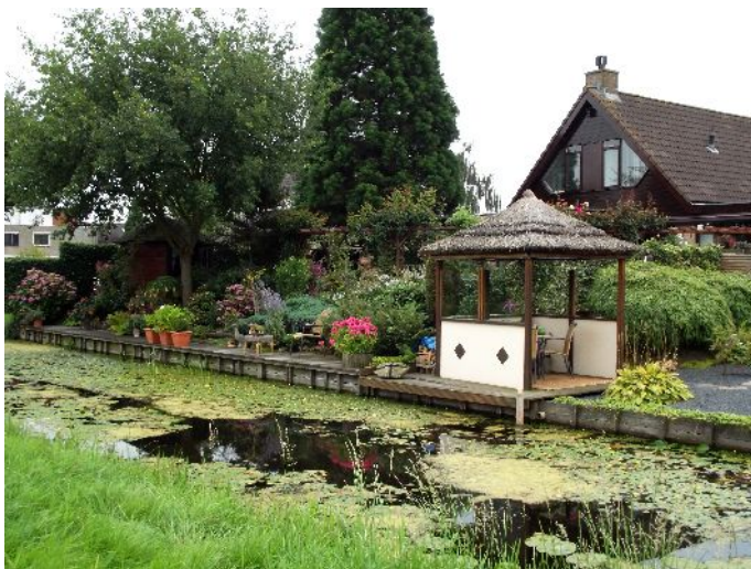
Alblassedam "Molenkade" (percorso dei mulini)