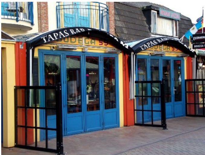
Per le vie di De Koog

verso le 16:40 ci mettiamo alla ricerca di un camping dove trascorrere la notte, troviamo posto al campeggio nei pressi di De Koog , al De Shelter Texel Camping , un po' caruccio ma non ci sono alternative, 46,40€ in tre persone. Alle 19 siamo sistemati in piazzola, facciamo uno spuntino veloce, due birre e poi via a fare una passeggiata per il paese,. Molto turistico e ci ricorda le zone balneari dell'alto adriatico, locali tutti attaccati e negozi di souvenir e articoli per il mare. Ci prendiamo dei gelati e poi facciamo ritorno al campeggio. Alle 21:30 siamo di nuovo in camper e ci prepariamo per la notte.