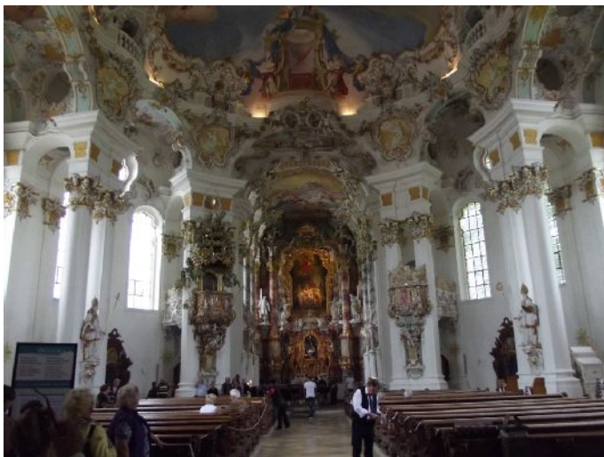
Cattedrale di "Wieskirche"