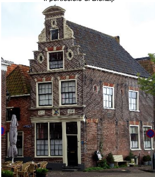
La casa più vecchia di Blokzijl edificata nell'anno 1666