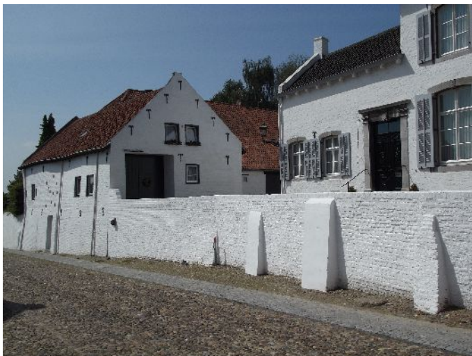
Thorn. Le caratteristiche case dipinte di bianco

Colazione e poi operazioni di carico e scarico, alle 10:00 si riparte, destinazione Thorn .