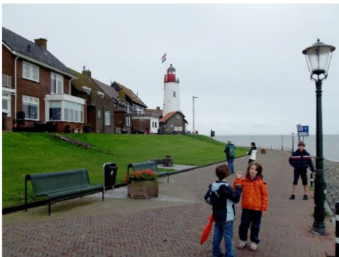
Per le vie di URK, passeggiata verso il porto ed il faro

Partiamo sotto la pioggia ma smette subito e un timido sole ci accompagna per il resto della mattinata.