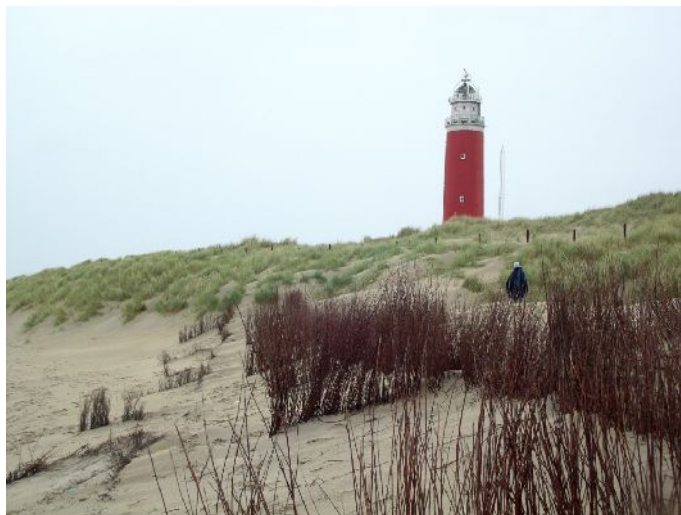
Il faro nella estremità nord dell'isola

terraferma, percorriamo la strada sulla costa est dell'isola passando per dei piccoli e graziosi paesini, peccato che su questa costa dell'isola ci sia un argine alto che ostacola la vista del mare e piove troppo per fermarci e salire una delle molte scalinate che portano in cima all'argine, dove corre anche la pista ciclabile.