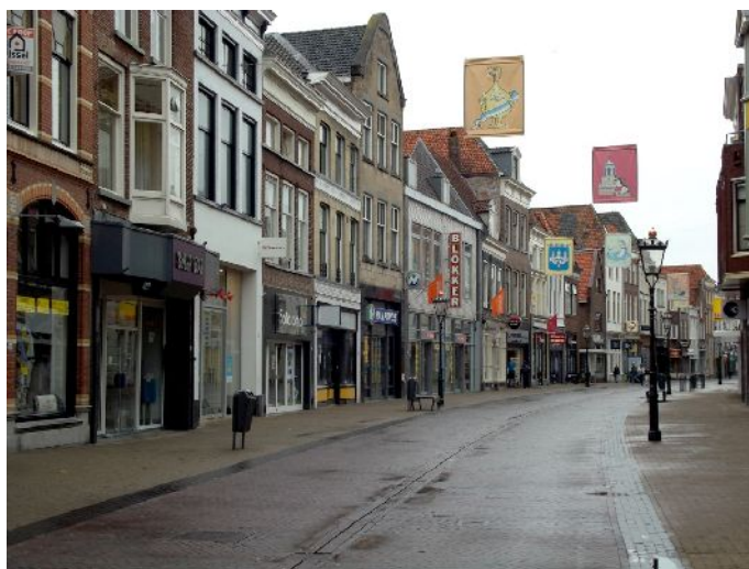
Kampen “per la via centrale”