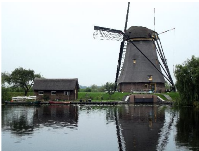
Alblassedam "Molenkade" (percorso dei mulini)