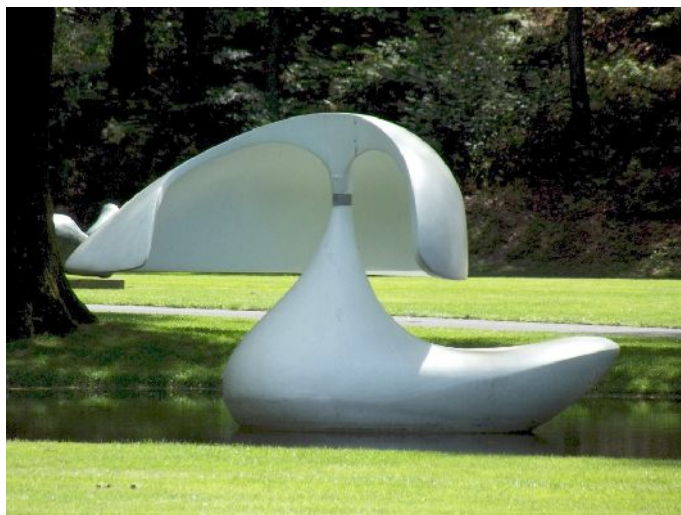
National Park De Hoge Velluwe – Kroller-Muller Museum Una delle innumerevoli opere esposte all'aperto