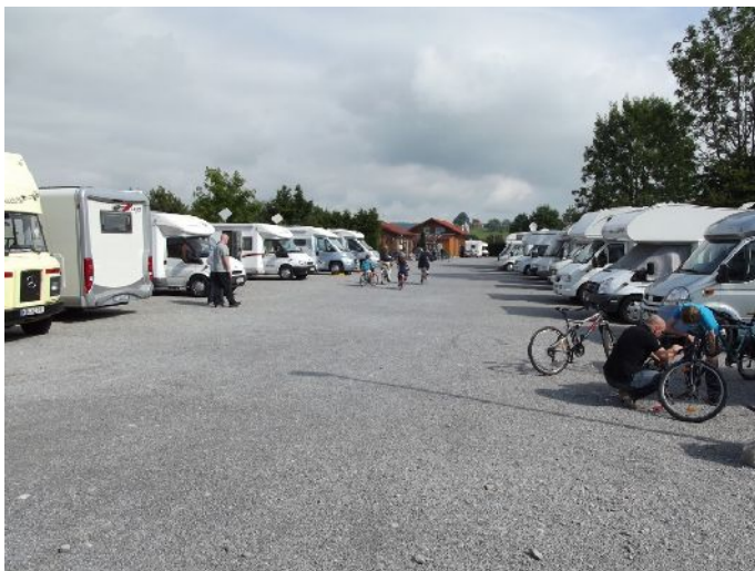
"Wohnmobilplatz" in Hafner-strasse, n°9. (N47°34,936' E 10°42,050').