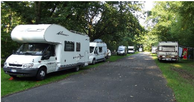
Waldfreibad Camperplatz (N51°29,688' E6° 13,591')