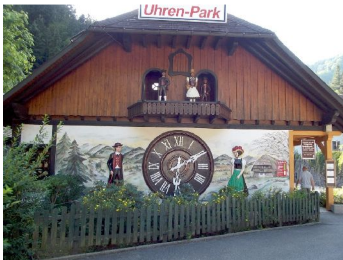
(Schonachbach) Orologio a cucu

Ripartiamo alle 18:45 verso l'area di sosta "Solemar", Huberstraße, Bad Dürkheim ", (D). dove arriviamo alle 19:30 circa, Alla reception non c'è nessuno, compiliamo un modulo (con: targa, corrente sì o no, pane sì o no) e lo infiliamo in un'apposita cassetta, entriamo e ci sistemiamo a nostro piacimento. Ceniamo tutti assieme e poi il consueto giro di briscola, alle 23 siamo a nanna.