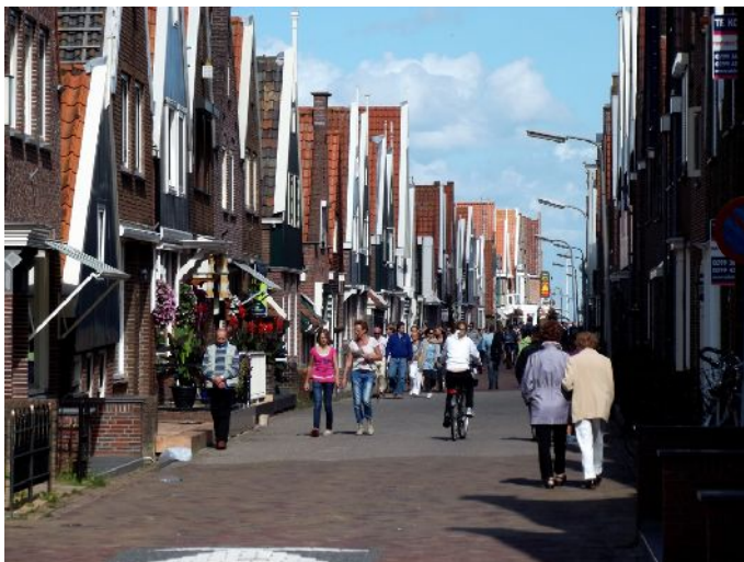
Volendam "Per le vie del centro"

Dopo una moltitudine di foto completiamo la visita di Volendam con una porzione di fisch & chips che mangiamo in riva al porto.