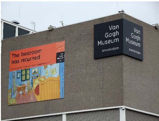
Amsterdam "Van Gogh Museum"

Pranziamo nel bar all'interno del museo e dopo la visita al piano interrato, anche questo interessante, usciamo verso le 14:00.