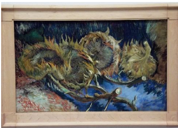
National Park De Hoge Velluwe – Kroller-Muller Museum Ci troviamo di fronte ad uno dei molti “Van Gogh” esposti!