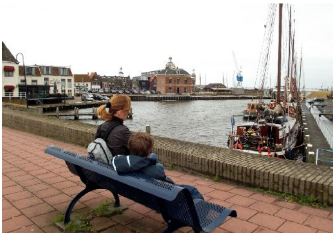
Il porto di Harlington (sopra) e vista del centro storico (sotto)