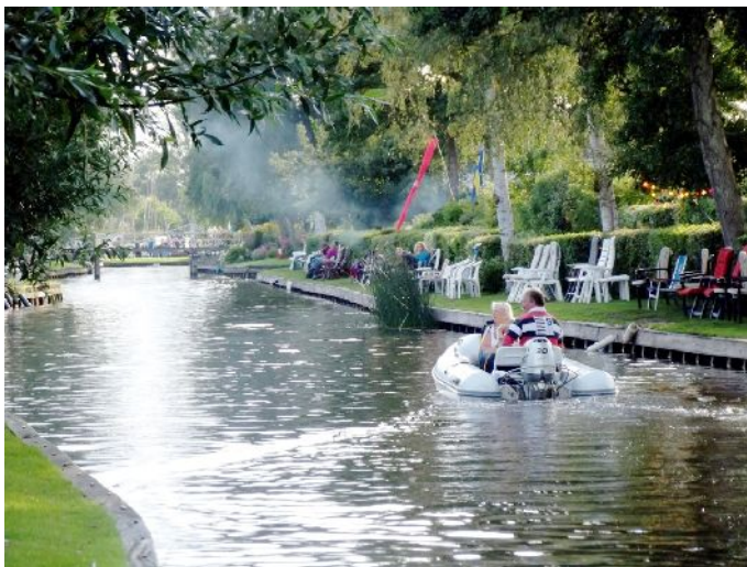
Vrijdag località "Belt-Schutsloot" Tutto è pronto per la sfilata

Verso le 20:00 ci portiamo lungo le sponde del canale principale del paese dove ci sarà la sfilata delle barche allegoriche, (tipo i nostri carri) le sponde sono già piene di sedie, pronte per accogliere gli spettatori, un barcone pieno di pirati che cantano e uno con una banda a bordo, intrattengono il pubblico in attesa dell'inizio della sfilata.