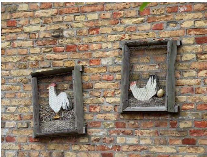
Hindeloopen decorazioni sui muri delle abitazioni

Si riparte alle 17:30 e facciamo rotta su Urk . Arriviamo alle 19:00 e parcheggiamo nel apposita area presso il porto. (N52°39,600' E5°35,979') chiediamo informazioni e ci dicono al mattino passa un incaricato a ritirare la quota per la sosta notturna.