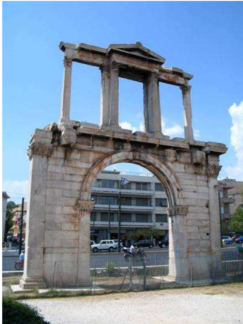
Arco di Adriano