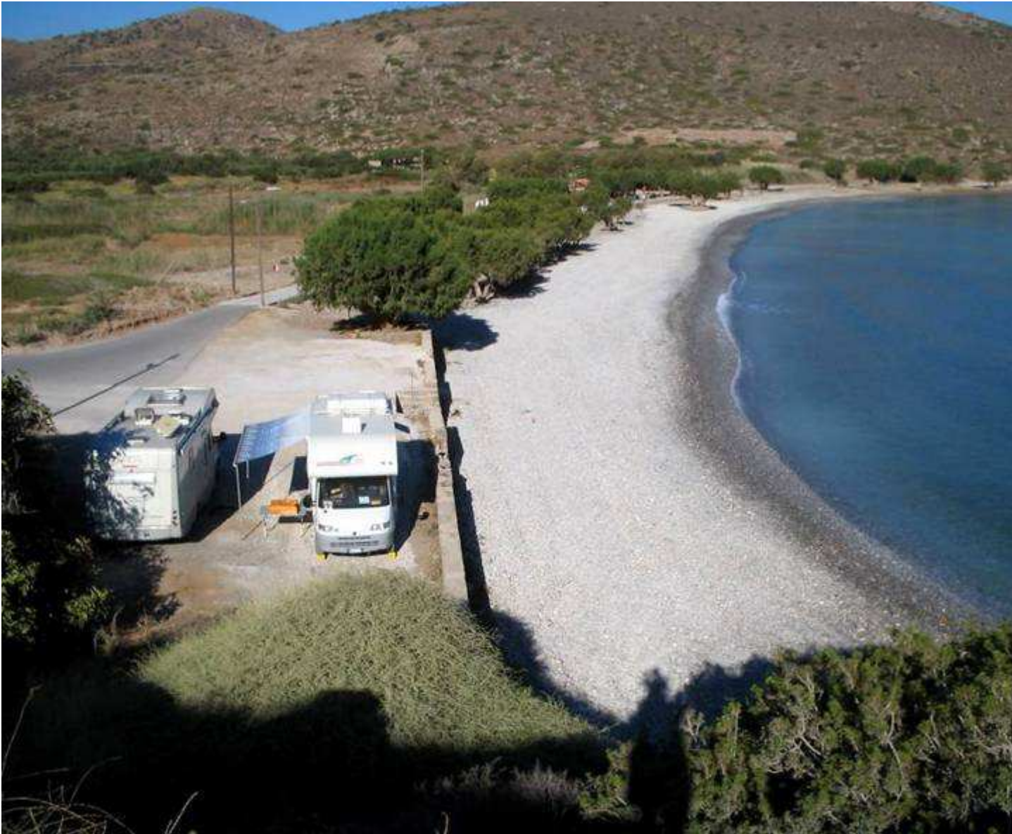
Tholos Beach (sistemazione ottima direi)

Nel pomeriggio del 13/08 ci mettiamo in movimento per raggiungere Xerokambos nella parte Est dell'isola, ove contiamo rifermarci sino a dopo ferragosto.