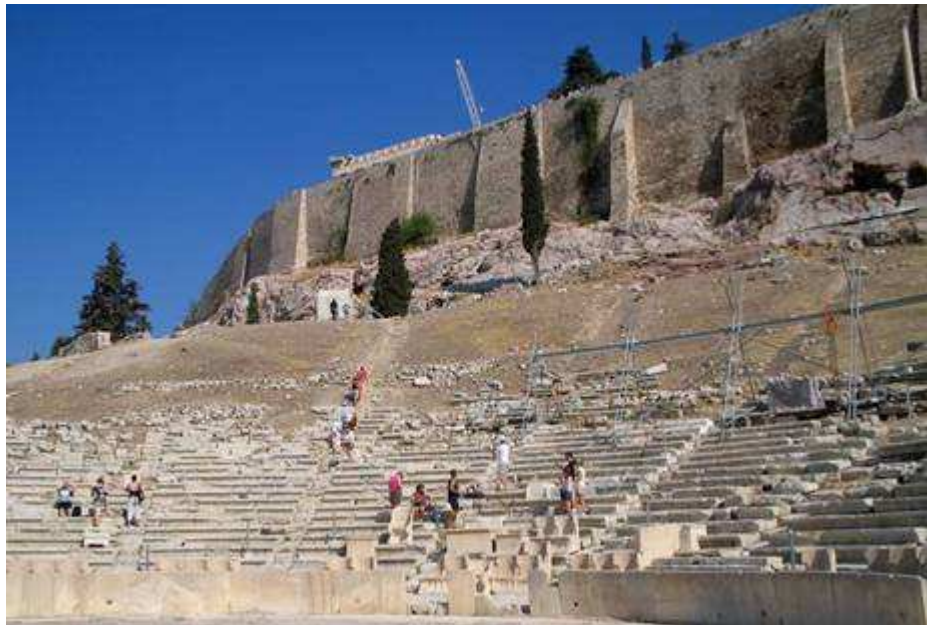
pie di dell'Acropoli