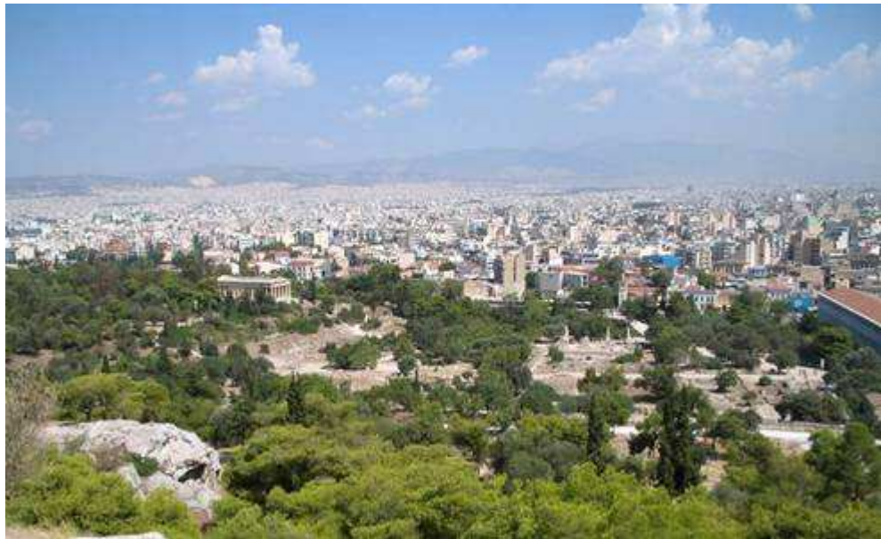
Atene e l'Agorà