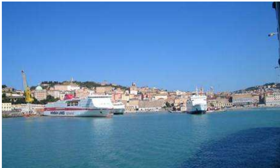
porto di ancona