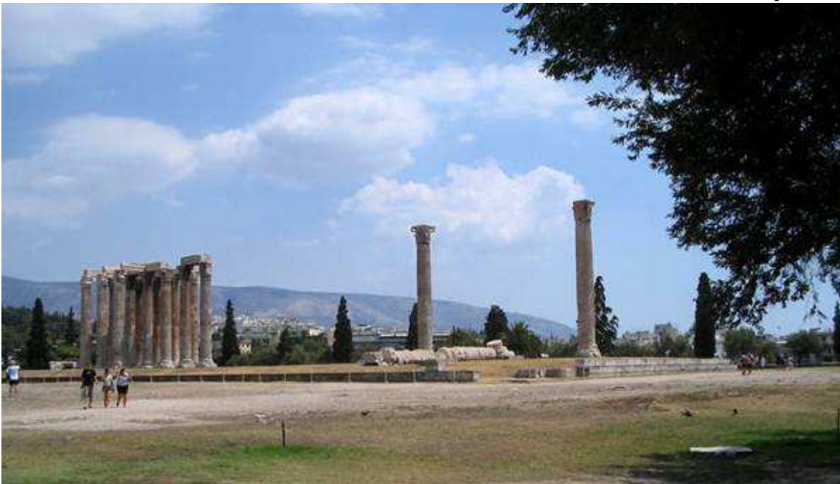
Tempio di Zeus