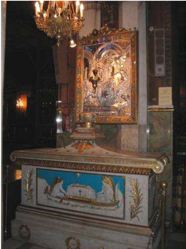
Interni della Cattedrale