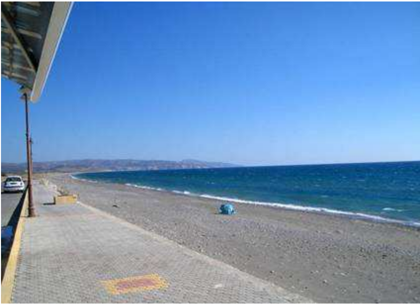
foto della spiaggia scattate