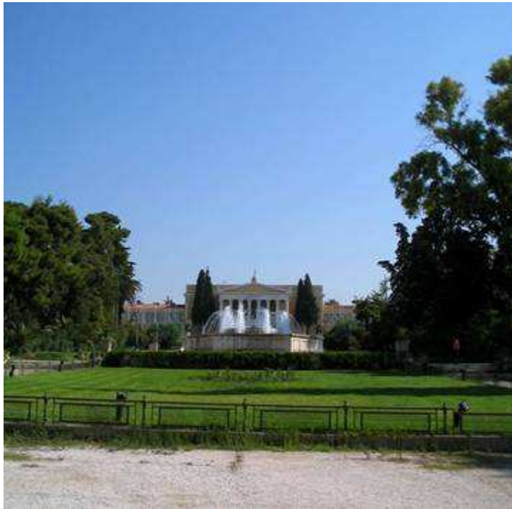
Pal. dei Congressi