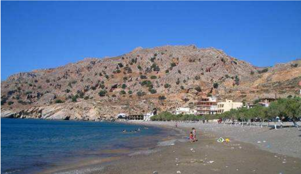
La baia di

ritirare il motorino oltre ai tavoli e sedie, i camper ballavano la samba e nuvole di sabbia rossa investivano i camper, nostro malgrado la mattina del 15/08 ci siamo spostati nella costa sud dell'isola, alla ricerca di altra soluzione a noi gradita, la troviamo nel pomeriggio a Keratokambos e li ci sistemiamo ai bordi della spiaggia