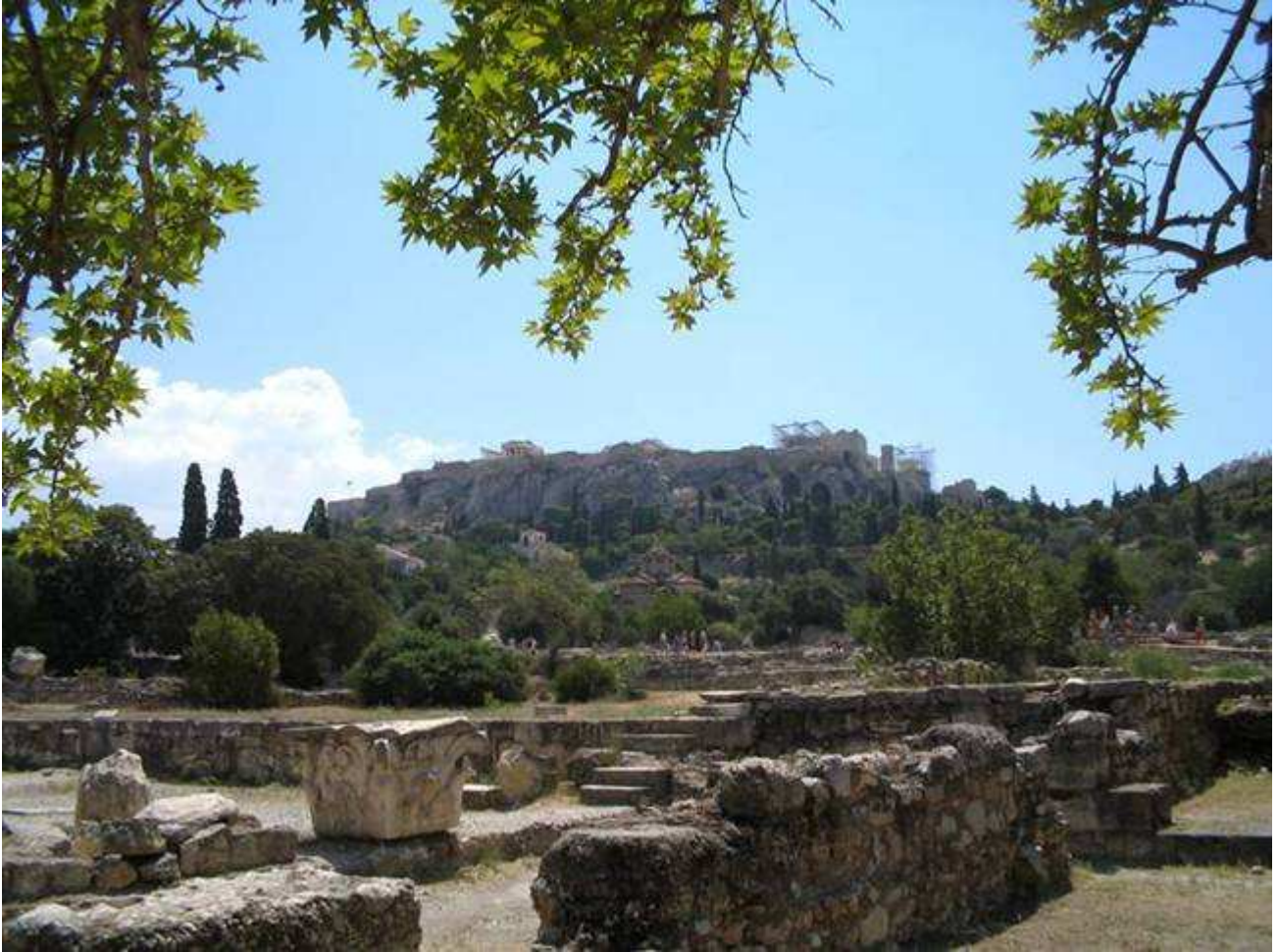
Vista sull'Acropoli dall'interno dell'Agorà