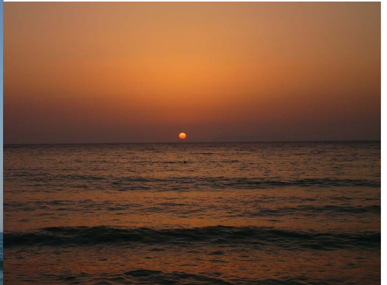
tramonto a Diros