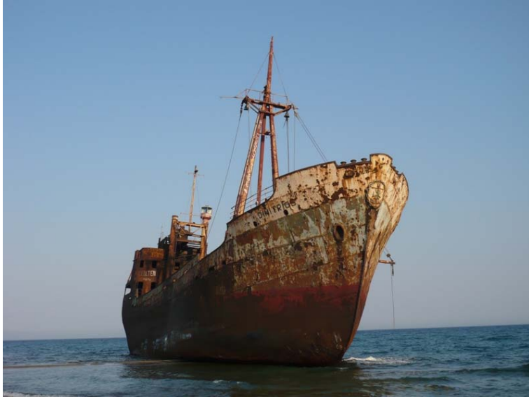
Glifada beach e il relitto