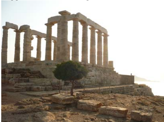
Tempio di Poseidone

16/8 ci imbarchiamo per Lavrio e da qui ci dirigiamo verso capo Sounion per visitare il tempio di Poseidone, molto suggestivo. Poi ci dirigiamo ad Atene, dove dormiamo al campeggio Athens.