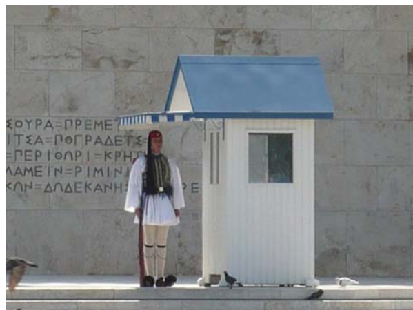
Le guardie del Parlamento

Prossima tappa: il Peloponneso, che abbiamo già visitato lo scorso anno, ma cercheremo di vedere qualcosa di nuovo. Quindi direzione Corinto e quindi verso epidauro. Ci fermiamo a Korfos, una località sul mare che si trova prima di Epidauro. Troviamo una bella spiaggia e ci fermiamo proprio lungo il mare, dove ci sono numerosi bagnanti greci e un camper francese parcheggiato tra gli alberi dietro la spiaggia. Verso sera arriva la guardia costiera, ma non per noi, ha visto un sub che pescava e l'ha multato. Visto il posto tranquillo, il mare bello e caldo e la vicinanza con il paese ci fermiamo 2 giorni.