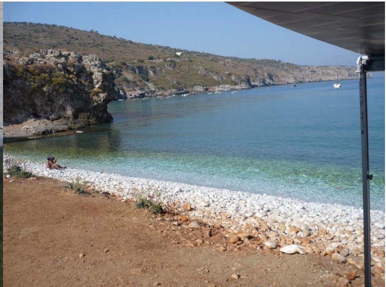
la spiaggia di Diros

25/8 ci dirigiamo verso Mistra , ma ci fermiamo al mare a Elos per essere a Mistra il 26/8 quando c'è la festa dell'estate. Troviamo una spiaggia dove è parcheggiato un camper tedesco; c'è la doccia e il bar e decidiamo di fermarci.