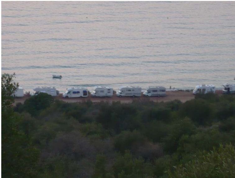
I camper a Diros