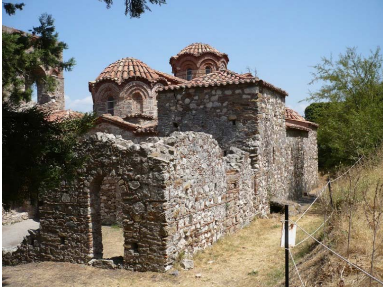
Mistra la chiesa di S. Sofia

Da mistra andiamo a Kalogria vicino a Patrasso per goderci gli ultimi 2 giorni di vacanza al mare. Il parcheggio a Kalogria è grande e ci siamo tutti, unico difetto le zanzare al tramonto sono accanite, quindi ci armiamo di repellenti e racchette antizanzare.