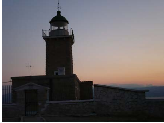
Faro di capo Herion

12/8 Partiamo in mattinata e ci dirigiamo verso Atene che oltrepassiamo lungo l'autostrada e raggiungiamo Lavrio per imbarcarci per Kea. Il traghetto (circa €100 camper e persone) parte alle 8 di sera, quindi andiamo in paese a fare la spesa e attendiamo in una bella spiaggia vicino al porto l'ora dell'imbarco. Arriviamo a kea con il buio e sostiamo ad Akrotiri per la notte.