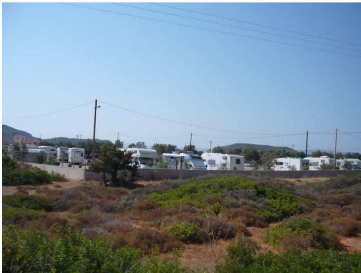
parcheggio camper al campeggio Simos di Elafonissis

19/8 si parte in direzione Elafonissis, anche se l'abbiamo già visitata abbiamo voglia di rivedere i Caraibi del Mediterraneo, ci imbarchiamo a Neapolis alle 4 del pomeriggio, quindi alle 5 siamo già in campeggio (campeggio Simos). Purtroppo il campeggio è ancora pieno e ci parcheggiamo nel piazzale di ghiaia come lo scorso anno; però ci sono tutti i servizi a parte la corrente che è presente solo nelle piazzole. Il mare è veramente fantastico e ci fermiamo 3 giorni.