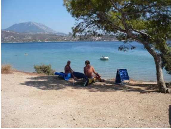
Lago di Vousiltraki