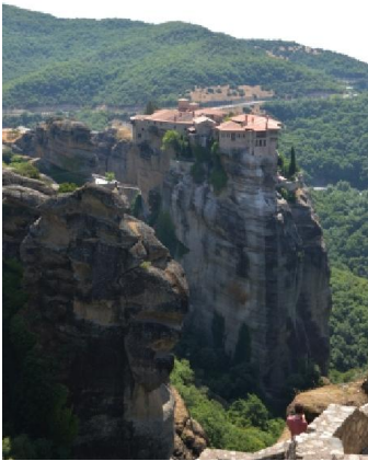
Monastero della Trinità

polverose. La piscina abbastanza ampia e con un bel panorama sulle strane formazioni rocciose tipiche delle Meteore. Servizi puliti ma con pecche varie (a volte manca l'acqua calda).