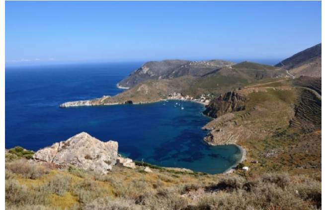
Porto Kagio visto dalla strada per Gýthio

Nota 3: appena passata Vathia, ampia piazzola con vista delle case-torri e del mare; il punto ideale per fotografare