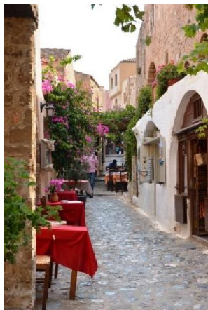
Le stradine di Monemvasia

Nota 1: la strada indicata dal navigatore (dapprima verso Archangelos, poi, 20 km prima di questa cittadina, deviazione verso Poros e, quindi, Monemvasia) è, da tale deviazione in poi, seppur molto panoramica, sconsigliabile per mezzi grandi, soprattutto per il passaggio attraverso un paesino, oltre che per la ridotta