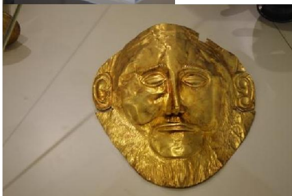
Museo Archeologico: arpista di Keros e maschera funeraria di Agamennone

eccezionali reperti custoditi: dalla maschera funeraria (d'oro) di Agamennone al Poseidone di Capo Artemisio; incredibile la modernità della piccola e stilizzata statuina dell'arpista di Keros. Comunque la sala dei reperti provenienti dagli scavi di Micene è, a nostro parere, la più interessante. Un'occhiata dall'esterno allo Stadio Panatenaico (non è estremamente interessante) e cena a Monastiraki sulla terrazza del ristorante Cafè Avyssia (consigliato dalla Lonely Planet), sulla piazzetta del mercato delle pulci: splendida vista sull'Acropoli illuminata (50 € in due). Molti locali con roof garden con vista sull'Acropoli (al campeggio ci consigliano "A for Athens Cocktail Bar").