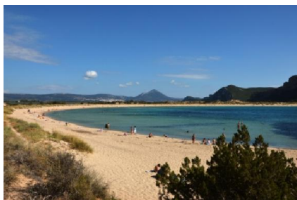
La baia di Voidokilia

La spiaggia di Kalo Nero (Kaló Neró) è una delle spiagge greche dove le tartarughe Caretta Caretta vanno a deporre le uova. Abbiamo letto su alcuni diari che alcuni sono riusciti (la mattina prestissimo) a vedere le piccole tartarughe, una volta rotto il guscio, uscire dalla buca scavata nella sabbia dalla madre e correre, guidate da un istinto preciso, verso l'acqua. Ho provato, la mattina presto, a vedere se per caso anch'io ci riuscivo, ma nulla da fare, di tartarughe nemmeno l'ombra (probabilmente il periodo è agosto, i citati diari, infatti, si riferivano a quel mese). Ho visto, invece, i giovani volontari arrivare e, dopo averle individuate, delimitare con canne le buche scavate e sommariamente ricoperte da mamma tartaruga per deporvi le uova, apponendovi cartelli di protezione in varie lingue. La spiaggia non è eccezionale (in discesa, mista sabbia e ciottoli) ma il mare è splendido. Eccezionale è invece quella di Lagouvardos (N 37°05'16" - E 21°34'53"): in una baia, al di là di una cortina di dune, si stende una lunga spiaggia di sabbia e ciottoli con un'acqua limpidissima e calda. Un posto, oltre che incantevole, anche estremamente