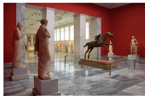
Una sala del Museo Archeologico

Cominciamo con Piazza Syntagma (o Síndagma), ma per fare foto alle guardie (Euzoni), dalle caratteristiche (e un po' buffe) divise, occorre ritornare pomeriggio perché la mattina c'è il sole contro. Pensavamo che le divise fossero riservate alle parate o occasioni ufficiali, invece visitando, alcuni giorni dopo, il museo allestito all'interno del monastero Metamorphosis, nelle Meteore, vediamo che in realtà erano, con tanto di calza bianca, gonnellino e pon pon sulle scarpe, divise da combattimento. Imperdibile il Museo Archeologico per gli