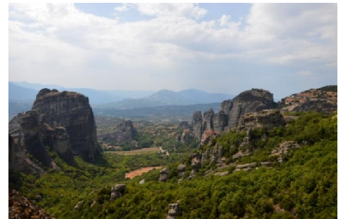
La vallata delle Meteore vista dal monastero di Roussanou

Nota 3: abbigliamento per entrare nei conventi: pantaloni lunghi e maglietta (no canotta) per gli uomini; gonna e maglietta (no canotta) per le donne. All'ingresso ci sono dei pareo a disposizione per coprire gambe (nel caso si indossino pantaloni) e braccia (se si indossano canotte). Se, per il caldo, non si riesce a stare coperti, si consiglia, per motivi igienici, di portarsi appresso un pareo per non utilizzare quelli "pubblici".