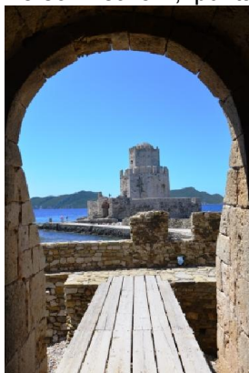
La fortezza di Methóni

Nota 1: il parcheggio davanti all'ingresso del castello di Methóni è troppo piccolo e angusto per i camper (anche piccoli). Usare quello che si trova a circa 200 m a sx del castello (N 36°49'04" – E 21°42'28").