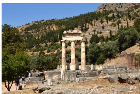
Delfi: la Tholo

Nota 2: al passaggio per Arachova, l'incrocio con eventuali pullman (non raro visto che è la strada per Delfi) richiede molta attenzione