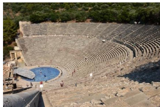
Il teatro di Epidauro

Anche se in piedi è rimasto ben poco, il sito dell' Antica Micene (Míkines) ha un fascino particolare. Vedendo la grandezza dei blocchi che costituiscono le imponenti mura ciclopiche si resta stupefatti e si stenta a credere che 3000 anni fa abbiano potuto effettuare tali imprese con gli scarsi mezzi a disposizione (non a caso, secondo la mitologia greca, furono i giganteschi Ciclopi a costruirle). Grandiose le tombe di Clitennestra e Egisto. Per la visita completa (8 €), compreso il Tesoro di Atreo (o Tomba di Agamennone), 200 m prima del parcheggio, occorrono circa 3 ore. Una strada nuovissima, che non risulta neppure sull'aggiornatissimo TomTom, porta, ripassando per Náfplio, ad Epidauro (Epídavros) dove, nel sito archeologico, troviamo