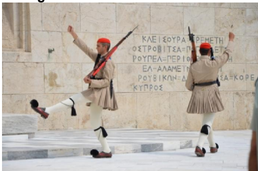
Cambio della guardia a Piazza Syntagma

Giornata archeologica (d'altronde ad Atene ...). Ovviamente, per prima cosa, l'Acropoli; questo "masso", piazzato in mezzo alla città che si è sviluppata tutta attorno, è visibile da ogni punto della città. Celeberrimo (a ragione) e strapieno di gente (ondate di giapponesi) fin dalle prime ore del mattino (più tardi penso che sarebbe difficoltoso entrare e muoversi). Poi l'Aeropago, l'Agorà e il quartiere di Monastiraki con il simpatico mercato delle pulci. Visto il caldo (qui manca la ventilazione, presente sempre lungo la costa) il primo pomeriggio è il momento migliore per il Museo dell'Acropoli (L 8/16 – Ma-D 8/16 – V 8/22). Chiusura della giornata con l'Arco di Adriano e il Tempio di Zeus.