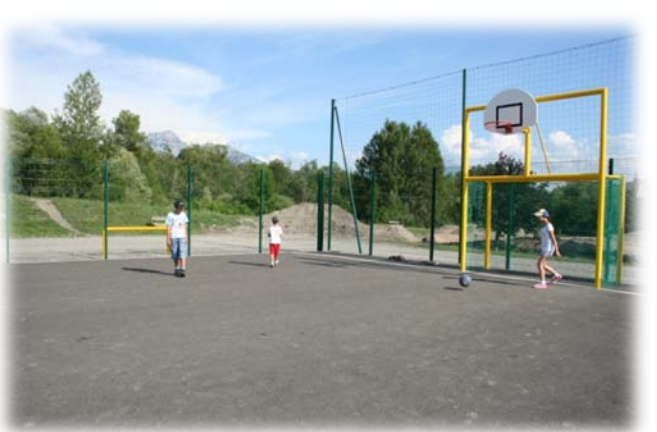
L'area di sosta di Chorges