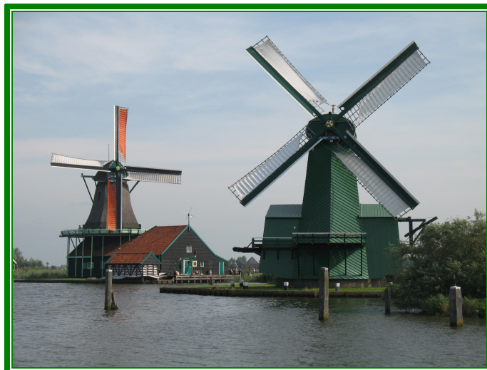
De Zaanse Schans

Dopo aver visitato il mulino a vento, ci spostiamo all'interno del villaggio dove si svolge il mercato settimanale.