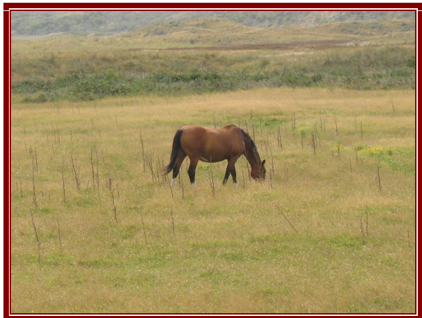
Isola di Texel

Dopo pranzo inforchiamo le bici e dopo aver lottato non poco con il vento che ci soffiava contro, abbiamo raggiunto una bellissima spiaggia affacciata sull'Oceano. Lungo il tragitto abbiamo attraversato un paesaggio quasi surreale, senza abitazioni con mucche pecore e cavalli che la facevano da padroni.