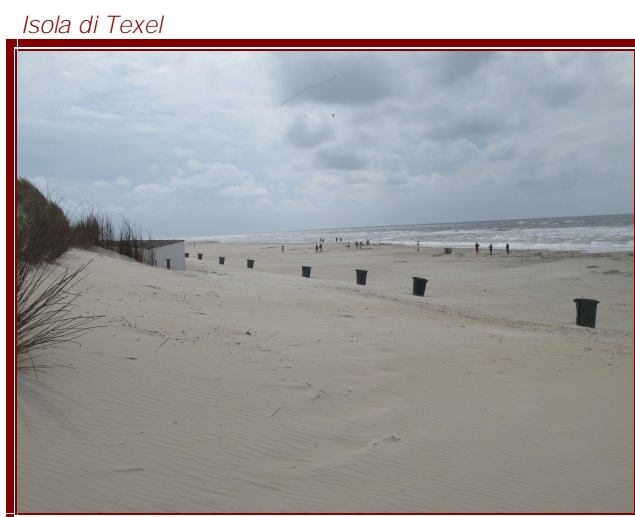
Isola di Texel

Sulla strada del ritorno seguiamo un'altra bellissima pista ciclabile che ci porta al faro