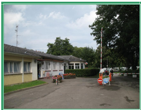
Reception Camping de la Montagne Verte

Ci sistemiamo al " Camping de la Montagne Verte " (GPS 48°34'52"N 007°43'03"E). E' un posto tranquillo, immerso nel verde e a due passi dal centro (€ 52.00 per 2 notti)