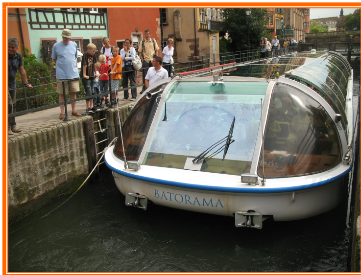
La chiusa sul fiume a Strasburgo

In mattinata ha quasi sempre piovuto e ne abbiamo così approfittato per un giro in battello, molto suggestivo, con l'attraversamento di due chiuse necessarie vista la differente altezza dei canali.