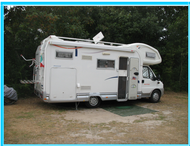
Camping Landal Sluftervallei

E' un camping immenso, immerso nel verde dove regna il più assoluto silenzio. Inoltre dispone di una fantastica piscina coperta aperta fino alle 22 (Temperatura interna 30°)