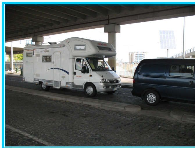
Imbarco per Isola di Texel

L'isola di Texel è la più grande delle isole Frisone, e nei suoi 24 Km. di lunghezza e 9 di larghezza concentra tutti i paesaggi tipici olandesi: le dune, le foreste, le dighe, le fattorie, i canali e le riserve naturali. Noi ci dirigiamo nella zona più settentrionale, ed appena superato il villaggio di De Cocksdorp , arriviamo al " Camping Landal Sluftervallei ". (GPS 53°09'73" N 004°50'72" E). (€ 47.60 per 1 notte).