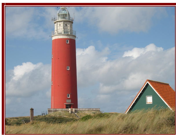
Isola di Texel

Sulla strada del ritorno seguiamo un'altra bellissima pista ciclabile che ci porta al faro