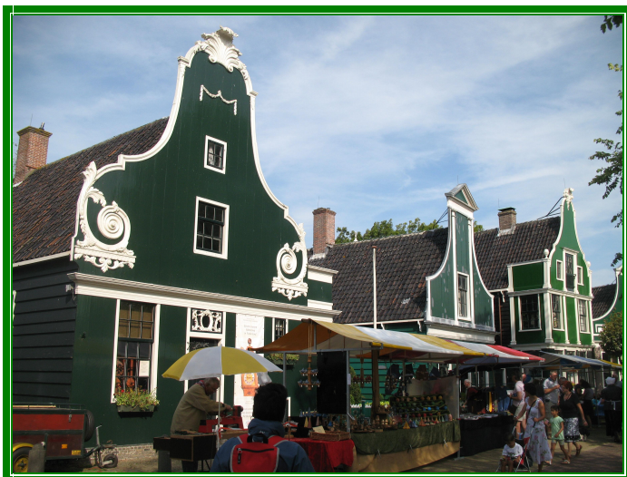
De Zaanse Schans

Partiamo da Amsterdam diretti a De Zaanse Schans , un piccolo villaggio dove si trovano sei mulini a vento perfettamente funzionanti, uno dei quali visitabile al costo di €3 a persona. Finalmente cominciamo ad usare le biciclette e anche per noi, che non siamo certo così allenati, è veramente piacevole muoversi con questo mezzo. Da quanto abbiamo potuto constatare in Olanda tutta la rete stradale è affiancata dalla pista ciclabile e i ciclisti sono più rispettati dei pedoni.