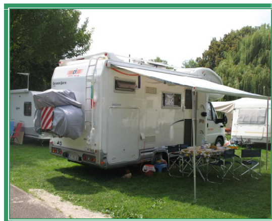
Camping de la Montagne Verte