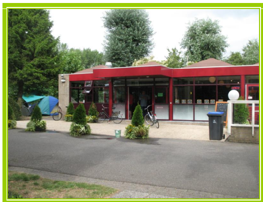
Reception Gaasper Camping

Partiamo di buon'ora, dopo le consuete operazioni di C/S, attraversiamo Germania e Belgio e dopo 580 Km., in cui peraltro abbiamo viaggiato benissimo (autostrade gratuite e prezzo del gasolio sempre inferiore che in Italia!!), arriviamo a metà pomeriggio ad Amsterdam . Ci sistemiamo al " Gaasper Camping " (GPS 52°18'72" N 004°59'47" E). Molto bello e pulito (€ 128.50 per 4 notti). Metro comodissima (200 mt. dal camping) con possibilità di acquisto dell'abbonamento presso la reception.