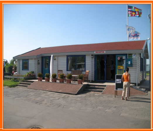
Reception Camping Strandbad

Tornati al camper che avevamo lasciato in un parcheggio ben segnalato dove però non era possibile sostare per la notte, carichiamo le biciclette e partiamo alla volta di Edam . Ci sistemiamo al " Camping Strandbad " (GPS 52°31'07" N 005°04'32" E).