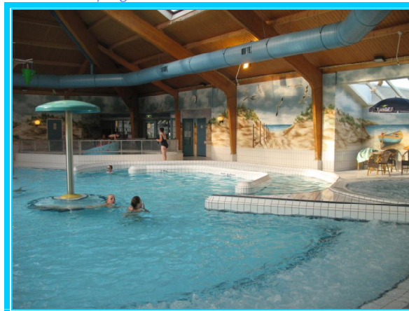
Piscina Camping Landal Sluftervallei