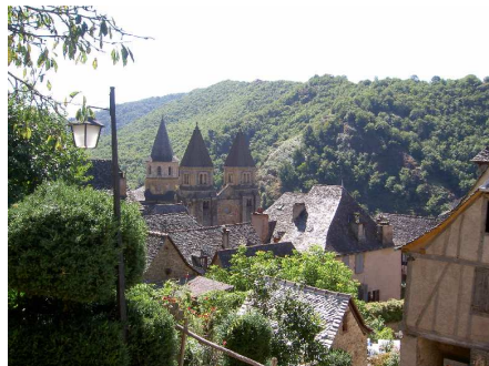
Panorama di Conques.

Ci spostiamo a Conques e parcheggiamo al costo di 3€ nell'unico grande P a disposizione (gli addetti alla sosta ci consigliano di sistemarci alla fine del P, con il muso rivolto verso l'uscita, perché è facile rimanere imbottigliati tra le macchine). Visitiamo il meraviglioso centro, ricco di scorci ed impreziosito dalla magnifica chiesa di Sainte Foy (in particolare dal mirabile rilievo del timpano del portale ovest).