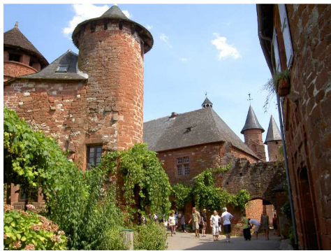
Collonges la Rouge.

Proseguiamo per Beaulieu sur Dordogne e la visitiamo, concentrandoci particolarmente sulla sua chiesa romanica, che presenta un portale riccamente scolpito. Prima di cena ci spostiamo a Saint Céré , ci sistemiamo nella AA gratuita vicino allo stadio di rugby ed al cimitero e facciamo una breve passeggiata.