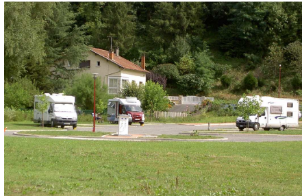
L'area di sosta di Boisset – Penchot.

Nel pomeriggio partiamo alla volta di Figeac, dove pensiamo di sostare per la notte. L'area di sosta è però lungo una strada trafficata, piccola ed in pendenza...insomma non ci convince! Ripartiamo per la prossima meta (Conques) e lungo il percorso ci fermiamo in una piccola e deliziosa AA nel paese di Boisset – Penchot , lungo il Lot.