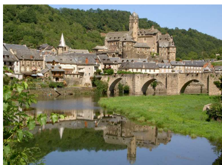
Estaing ed il Lot.

Pranziamo al parcheggio e ripartiamo seguendo la stretta e tortuosa D107 che segue le anse del Lot, passiamo per Entraygues sur Truyère e per Estaing : il paese merita assolutamente una sosta, anche solo per immortalarlo mentre si specchia nel Lot!