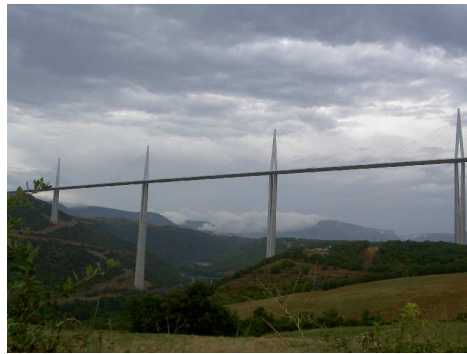
Il viadotto di Millau.

Terminate le gole ci fermiamo ad ammirare l'avveniristico Viaduc di Millau ed il suo centro visitatori...impressionante!