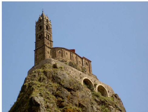
Aiguille Saint Michel a Le Puy en Velay.

Ven 22 agosto Seguendo la D590, attraversando zone montane molto suggestive, raggiungiamo Le Puy en Velay : in centro il traffico è intenso e l'area di sosta occupata da un mercato, preferiamo quindi sistemarci nel Camping municipale Le Bouthezard, nei pressi della Aiguille Saint Michel, al costo di 16 € al giorno.