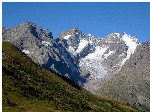
Il ghiacciaio della Meije.

Dom 24 agosto Dopo aver immortalato il ghiacciaio della Meije, che si mostra in tutta la sua bellezza baciato dal sole, raggiungiamo Briançon .