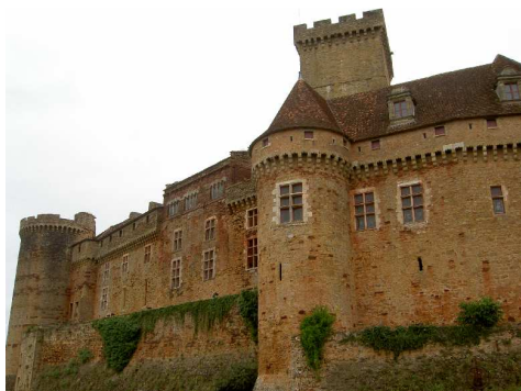
Il Castello di Castelnau – Bretenoux.

La mattinata è dedicata alla visita del vicino Castello di Castelnau – Bretenoux (6,5€ a persona): la visita degli interni è guidata, mentre quella degli esterni è libera.