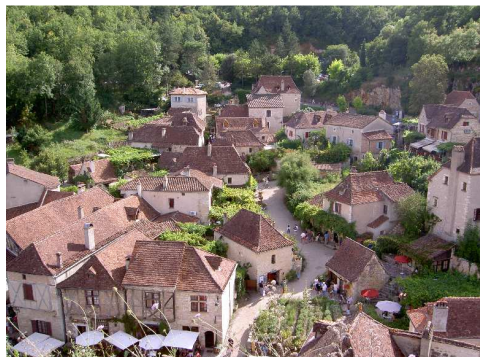
Il paese ed il panorama verso il Lot visti dal belvedere che domina Saint Cirq Lapopie.

Per raggiungere il centro del paese seguiamo il percorso pedonale che si arrampica fino al meraviglioso villaggio: la fatica viene ampiamente ripagata dai panorami e dagli scorci che questo paesino sa offrire!