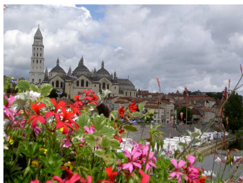
La Cattedrale di Perigueux ed il parcheggio per camper visti dal ponte Saint Georges.

In mattinata ci spostiamo a Perigueux , sistemiamo il camper nella AA segnalata lungo il fiume Isle, nei pressi del ponte Saint Georges e visitiamo l'animato centro, dominato dalla maestosa Cattedrale.