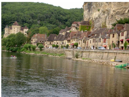
La Roque Gageac e la Dordogna.

Poco prima delle 9 ci dirigiamo verso il sito trogloditico di La Roque Saint Christophe : apre solo alle 10 e quindi lo vediamo solamente dalla strada. Proseguiamo per Les Eyzies de Tayac (già visitata nel 2003) ed arriviamo a Beynac et Cazenac : il parcheggio gratuito per i camper si trova in alto sopra il paese, ma si raggiunge senza problemi. Visitiamo il bel centro e saliamo fino al Castello (la cui visita ci sembra abbastanza cara..7€..visto che si è costretti a seguire una guida che parla unicamente francese). Dopo pranzo ci spostiamo nella vicina La Roque Gageac , parcheggiamo nel P per camper lungo la dipartimentale 703 (2€ per il giorno e 5€ per la notte) e visitiamo il paesino arroccato e quasi a strapiombo sulla Dordogna.