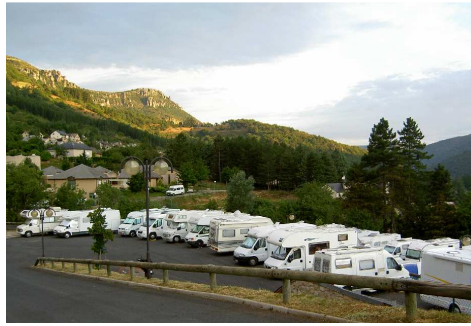
L'area di sosta di Florac.