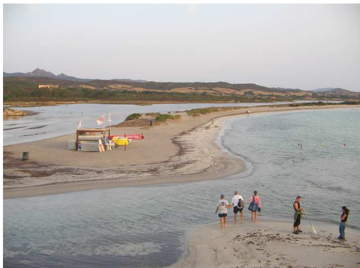
SPIAGGIA DI LU IMPOSTO

la spiaggia di Cala Brandicchi detta anche piccola Taiti; le due spiagge sono molto simili con acqua turchese e sabbia bianchissima.