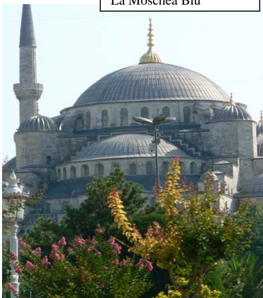
La Moschea Blu