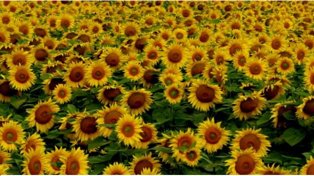
b) i girasoli di Mirepoix

Quest'anno abbiamo deciso di affrontare un viaggio un po' impegnativo che rimandavamo da un po' di anni: Spagna del Nord – Portogallo. L'itinerario è fra i più classici: il cammino del Nord di