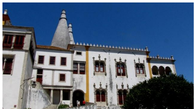
28 - Sintra, palazzo reale

Arriviamo a Sintra (▼) verso le 11:00. La cittadina, famosa come soggiorno estivo dei re portoghesi, è ricca di palazzi. Avevamo già deciso di visitare quello più insolito che è il Palacio da Peña , ma attratti dai due enormi e singolari camini del Palacio Nacional , finiamo per visitare quest'ultimo. L'edificio, anch'esso abbastanza insolito, è ricco di saloni arredati con mobili pregiati, maioliche e vasellami; inoltre quasi tutte le stanze presentano soffitti