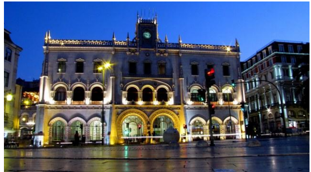
d) Lisbona - la stazione di notte

Cibi e bevande: Abbiamo mangiato diverse volte nei ristoranti, spesso ottima cucina e prezzi contenuti: lungo l'Avenida di Porto, per un pranzo completo abbiamo speso meno di 20 € a testa, in un ristorante della Stazione Oriente, una spigola alla griglia con contorno di patatine a meno di 8 €. Diffusi nelle grandi città ristoranti a consumazione libera e prezzo fisso: a Saragozza, decine e decine di specialità dagli antipasti ai primi, ai secondi, con possibilità di riempire il piatto tutte le volte che si voleva e con tutto quello che si voleva al prezzo fisso di 11,5 €. In Portogallo ci siamo lasciati tentare dal Bacalà in tutte le salse, apprezzando la bontà e la varietà delle proposte.