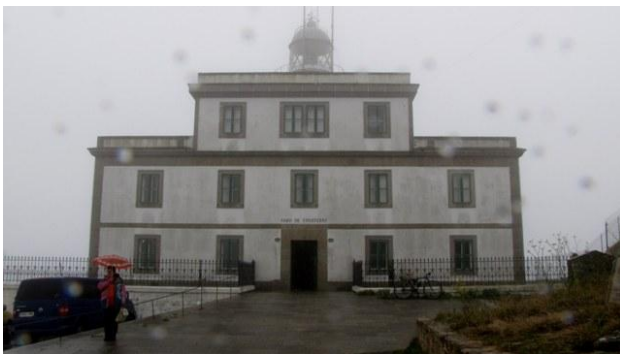
14 - il faro di Cabo Finisterre

e dei Pimientos de Padróns , piccoli peperoni verdi appena un po' piccanti cotti in padella: veramente squisiti. Innaffiamo il tutto con un boccale di birra. Sono le 14:00 quando raggiungiamo il parcheggio e partiamo in direzione di Cabo Finisterre (▼), dove arriviamo dopo un centinaio di chilometri alle ore 16:30. Il Capo rappresenta il chilometro zero del cammino di Santiago, è il punto dove i pellegrini