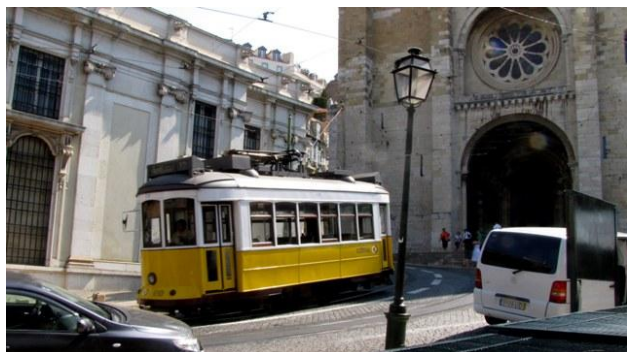
31 - Lisbona - la cattedrale

Abbiamo dedicato a Lisbona due giornate piene, dormendo in campeggio per tre notti.