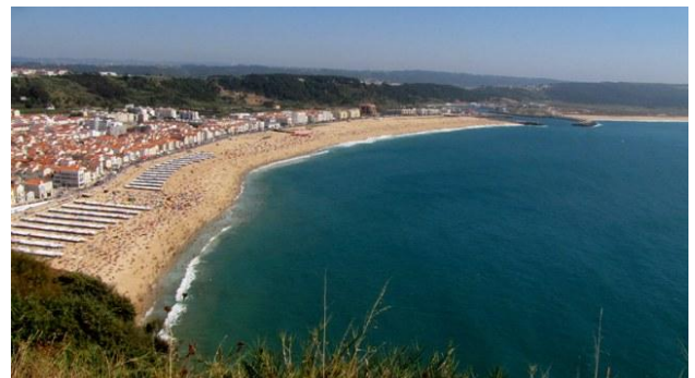
26 - Nazaré, la spiaggia Sud

La città di Nazarè non è lontana e, anche se non previsto, decidiamo di vedere questa famosa località turistica. Raggiunta la cittadina ci dirigiamo verso la spiaggia Nord nei pressi del faro. La zona è brulla, molto desolata e c'è molta incuria. Abbandoniamo presto questo posto e risaliamo, non senza difficoltà, verso la parte alta del promontorio dominato dal Santuario di Nossa Senhora de Nazaré . Turisti e venditori ambulanti affollano la piazza e numerosi autobus sono in manovra o fermi nei punti più impensati. Nel giro