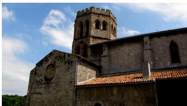
4 - Sain Lizier

Lasciamo la cittadina dopo qualche ora e a mezzogiorno raggiungiamo Foix; seguendo le indicazioni della "peppinella", ci dirigiamo a colpo sicuro nel largo parcheggio (▼) individuato prima della partenza, a circa 5 minuti dal centro. Foix si presenta come una cittadina molto elegante, che conserva nella sua parte Nord, nei pressi della cattedrale, il suo impianto medioevale con vicoli stretti e case a graticcio, mentre da una collina rocciosa un castello con tre torri di epoche diverse sovrasta tutto l'abitato. Qui, vista l'ora, ci lasciamo tentare da un restaurantino dove pranziamo con soli 30 Euro.