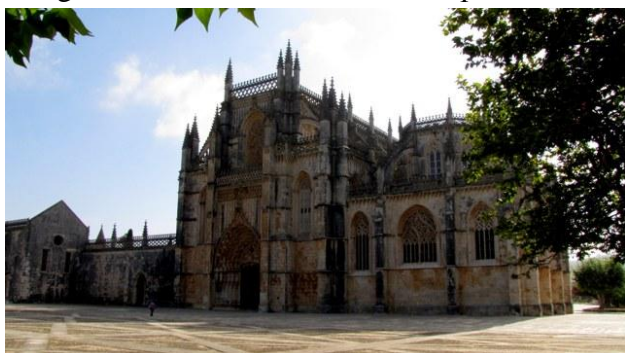
24 - Monastero di Batalha

Oggi ci aspettano Batalha e Alcobaça, due dei più imponenti e magnifici monasteri gotici del Portogallo, dichiarati dall'UNESCO patrimonio dell'umanità.