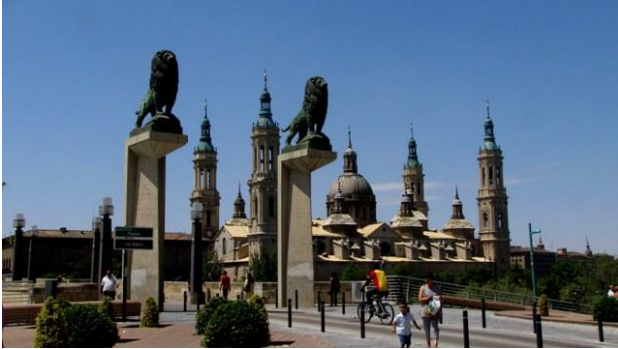
36 - Saragozza

Dopo qualche ora di viaggio il caldo è già meno soffocante. È ancora buio, perciò mi sembra di avere le travogole quando lungo la strada incontro i cartelli triangolari col fiocco di neve tipico delle strade di montagna. Un attimo di smarrimento per poi capire che, senza accorgercene, lentamente siamo saliti sulla Meseta, a oltre 1000 metri di altezza: ci sentiamo rinfrancati.