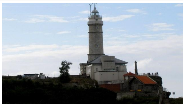
7 - Cabo Mayor

Abbandoniamo il Capo poco dopo le 19:00 e raggiungiamo la cittadina di Santillana del Mar alle 20:30 dopo poco meno di 50 chilometri. Ci dirigiamo direttamente verso il parcheggio che avevo