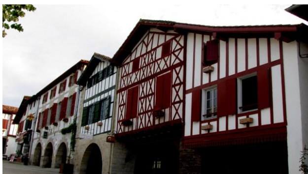
5 - Bastide de Clairence

Alle 14,30 ci dirigiamo verso la Bastide de Serou, la raggiungiamo dopo 40 minuti: a parte un antico mercato coperto, non c'è altro, questa tappa poteva essere tralasciata tranquillamente. Proseguendo nell'itinerario, poco prima delle 16, siamo a Saint Lizier. Troviamo ampio spazio in un parcheggio alberato (▼) quasi a ridosso della cattedrale; il paesino, ai piedi dei Pirenei, è come ce lo aspettavamo, raccolto attorno alla mirabile chiesa romanica che è caratterizzata da una torre campanaria esagonale contornata di bifore e da un pregevole portale; all'interno è notevole la zona absidale che nella volta centrale conserva l'affresco di un Cristo benedicente di chiaro influsso bizantino; bellissimo anche il chiostro al quale si accede dall'interno della chiesa.