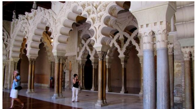
37 - Saragozza - l'Aljaferia

Mangiamo in un ristorante in piazza, uno di quelli a consumazione libera e a prezzo fisso, poi raggiungiamo il camper per spostarci al palazzo dell'Aljaferia, dove parcheggiamo nei pressi del castello. Non ci sono parole per descrivere la bellezza dell'architettura di questo enorme edificio; da un ampio patio si passa ai portici realizzati con splendidi archi poliovalati,