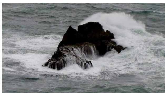
a) l'oceano a capo Machichaco

Un viaggio in camper è una scelta legata all'essenza del viaggiare; viaggiare è la geografia del