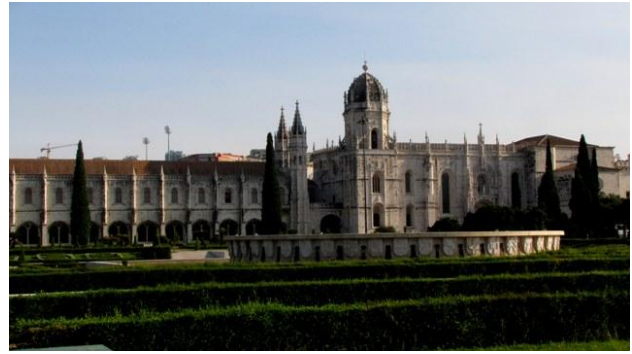
32 - Mosteiro dos Jeronimos

Noi abbiamo preso l'elevador de Santa Justa , un ascensore monumentale, ma la lunga fila che abbiamo dovuto fare e i tempi morti ad ogni discesa o salita (praticamente partenze ad orario) sono veramente spropositati in confronto ai 5-10 minuti che si impiegherebbero per salire a piedi. Se vi piace il Fado e volete ascoltare questa musica, approfittatene appena trovate un locale dove lo eseguono. Abbiamo scoperto che ascoltarlo non è poi così facile come si pensava: il primo giorno, in un locale nell'Alfama, la città vecchia, in un ristorante all'aperto, un gruppo di musicisti eseguiva questa musica tradizionale; abbiamo pensato di tornarci per ora di cena, ma purtroppo la sera ci siamo aggirati inutilmente nel