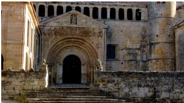
8 - Santillana del Mar - la collegiata

Santillana del Mar è famosa per la presenza sul suo territorio della grotta preistorica di Altamira. Il sito originale non è accessibile al pubblico, è invece visitabile una sua riproduzione. Ma la cittadina di Santillana deve la sua fama anche alla sua mirabile architettura che la colloca fra i villaggi più