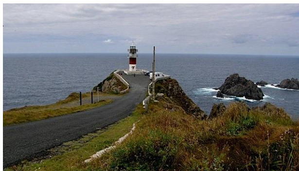
13 - Cabo Ortegal

Ortegal . Il capo non è molto distante da dove siamo, ma per raggiungerlo impieghiamo una mezzora lungo una stradina a tratti molto impervia; nell'ultimo tratto si scende fino a una piccola piazzola (▼) che ospita il piccolo faro di Ortegal. La giornata ora è decisamente migliorata, e con facilità si individua il vicino Cabo Bares; fatta eccezione per un piccolo camper che staziona su un terrapieno riparato