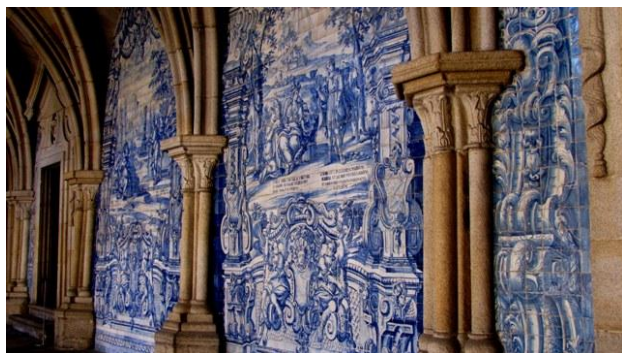
20 - Porto - gli azulejos della cattedrale

Porto è una città molto pittoresca; a noi è venuto spontaneo paragonarla a Napoli. Nelle strade