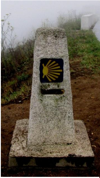
16 - chilometro zero del Cammino di Santiago

Lasciamo il Capo poco dopo le 18:00. Attraversando il paese di Fisterre abbiamo modo di ammirare diversi Horreos Galiziani, particolari costruzioni rurali usate come magazzino di derrate alimentari. Queste costruzioni poggiano su colonne in pietra particolarmente levigate per impedire ai topi di accedere all'interno. Decidiamo di proseguire verso il confine portoghese che dista poco più di 200 chilometri e, sempre alla ricerca di paesaggi suggestivi, costeggiamo l'oceano per poi addentrarci nella Ria de Muros, in fondo alla quale troviamo la cittadina di Noya. Su un ampio parcheggio (▼) a due passi dal mare, un vecchio camper sembra farci da esca. Accettiamo la provocazione e decidiamo di fermarci anche dopo esserci accorti che il camper è disabitato. Cena in camper, piccola passeggiata per il paese, che non ci è sembrato un gran che, e poi a nanna.