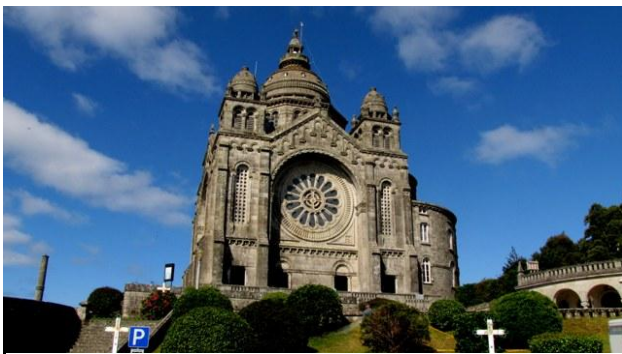
17 - Santa Luzia

Partenza verso le 8:00 su strade secondarie, fino ad entrare dopo 35 chilometri sull'autopista (a pagamento) nei pressi di Padron; verso le ore 10:00 attraversiamo il confine e il Portogallo ci