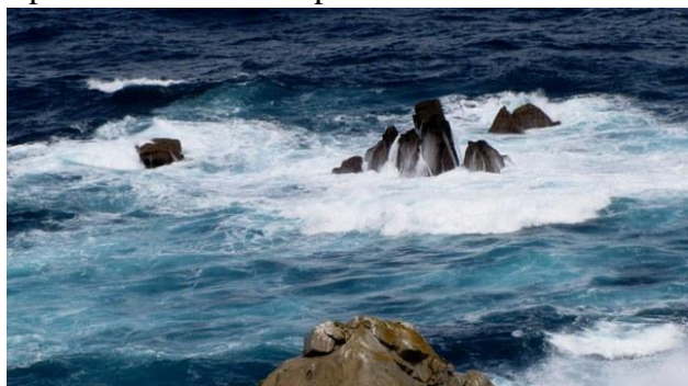
12 - Punta de la Estaca de Bares

Riprendiamo la strada per Bares. Per tutti i 75 chilometri costeggiamo il mare (anche qui bellissimi