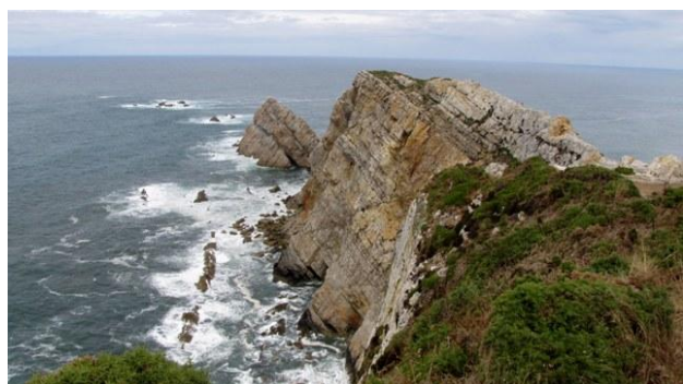
c) Cabo de Penas

L'attraversamento della Francia del Sud ci ha permesso di aggiungere alle tante piccole città medioevali del Midy Pirenei scoperte nel 2009, tre piccoli gioielli: Mirepoix, Foix e Saint Liziers; la Bastide de Serou, invece, non vale la sosta. La Bastide Clairence, cittadina dell'Aquitania dove abbiamo pernottato prima dell'ingresso in Spagna, seppure tenuta molto bene, ci è sembrata artificiosa e poco originale.