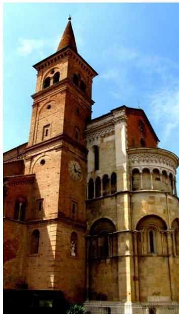
1 - Duomo di Fidenza

Di solito ci piace partire presto, ma poiché vogliamo essere da nostra figlia a Milano non prima di sera, ce la prendiamo comoda partendo alle 8.00; ben presto lungo l'autostrada il caldo comincia a farsi sentire, a Bologna verso le 12,30 il termometro segna 36°.