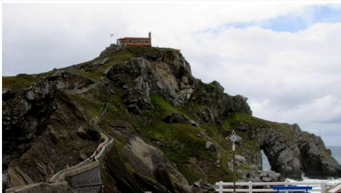
6 - San Juan de Gaztelugatxe

La giornata non è bellissima, ogni tanto il sole fa capolino fra le nuvole, ma il paesaggio è