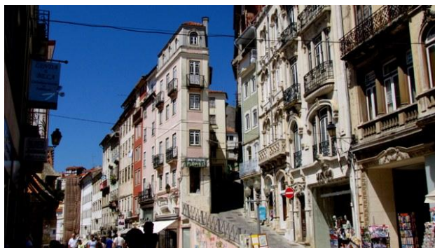
22 - Coimbra

Continuiamo per la centrale Rua Visconde Luz: sulla destra, scendendo una scalinata, si incontra Sao Tiago, una raccolta chiesetta romanica con un ricco portale. Prima di salire verso la cattedrale e la collinetta dell'università, arriviamo fino a piazza del Commercio e poi ci addentriamo lungo i caratteristici vicoletti vicino al fiume. Entriamo nella parte alta della città attraversando l'arco di Almedina, e di lì a poco raggiungiamo la cattedrale Sé Velha, una