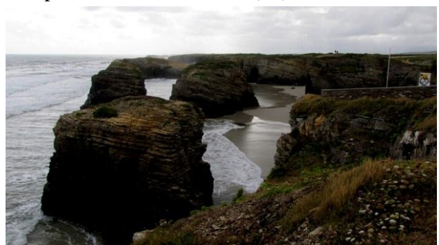
11 - Playa as Catedrais

Appena oltrepassati Ribadeo "la peppinella" ci fa lasciare la A8 e ci porta dritti a Playa as Catedrais. Sono le 10:20, ci fermiamo in uno dei grandi piazzali vicino al mare (▼) dove troviamo anche altri camper che probabilmente hanno passato qui la notte. Qualche passo e le cattedrali di roccia ci appaiono maestose: sono enormi faraglioni separati fra loro e dalla terra ferma da profonde gole che solo la bassa marea scopre. Lo spettacolo è insuperabile: qua e là grotte e cavità naturali violentate dall'Oceano, all'interno di esse l'acqua si insinua con impeto crescente fino a quando la risacca non le abbandona grondanti, pochi attimi di respiro, poi il nuovo assalto.