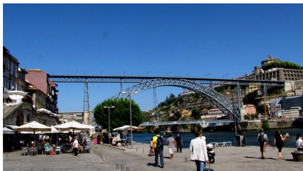
19 - Porto, la zona di Ribeira

con all'interno un severo chiostro a due piani. Lasciato l'edificio religioso, dopo qualche centinaio di metri, imbocchiamo il lungo ponte di ferro Dom Luis I che collega la città a Vila Nova de Gaia ; dal ponte la vista è veramente eccezionale: la sottostante zona del vecchio porto e, sulla sponda opposta del Duero, le cantine. Continuiamo attraverso stradine strette e vicoli e scendiamo al Cais da Ribeira , la giornata è calda e soleggiata e in Praza de Ribeira ci concediamo una sosta seduti davanti a due boccali di birra. Torniamo nella parte alta e vi trascorriamo il resto del pomeriggio facendo anche un po' di shopping (i prezzi ci sembrano particolarmente convenienti). A sera, prima di tornare in camper, ceniamo in un ristorante nella centrale ed elegante Avenida dos Aliados : un pranzo completo che con sorpresa paghiamo solo 35 €, in due. Alle 20:30 torniamo al parcheggio, il custode è andato via e naturalmente la sbarra è alzata. Abbiamo le coordinate del campeggio