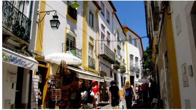
34 - Evora

L'uscita da Lisbona è rallentata da un notevole traffico in prossimità del ponte Vasco de Gama, ma, presa la A12 e attraversata l'ampia foce del Tago, la circolazione diventa scorrevole. Dopo circa 120 chilometri prendiamo l'uscita per Evora (€ 14,90) e poco dopo ci fermiamo in una ombreggiata piazzola di sosta, accanto ad un altro camper di italiani: una simpaticissima famiglia veneziana con quattro splendidi bambini e con tre gatti a bordo. Poiché anche loro sono diretti ad Evora ripartiamo assieme e visitiamo la città in loro compagnia. Troviamo parcheggio in una spianata (▼) appena al di fuori delle antiche mura.