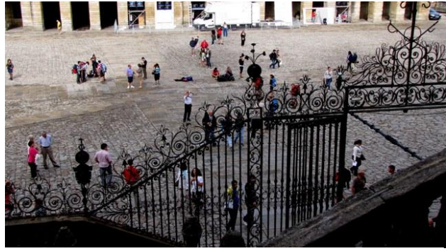
15 - Santiago de Compostella - Obradoiro

Verso le ore 8,30 mi rimetto alla guida del camper, confidando di raggiungere il parcheggio di Praza de Abastos del quale abbiamo le coordinate. Ma la sosta a Santiago di Compostella è quella che si rivela più difficoltosa; non siamo in grado di raggiungere il parcheggio in quanto la strada di accesso ( rua das Trompas ) si presenta molto stretta e temiamo di incontrare difficoltà nel passarvi, proviamo a fare larghi