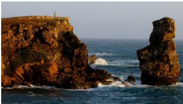
27 - Cabo Carvoeiro

Meno male che il ritorno sull'oceano, come sempre, ci rinfranca e ci appaga. Proprio nella zona del faro veniamo affiancati da un altro camper italiano, una simpatica coppia di Monza; siamo tutti del parere che non si può perdere l'occasione di pernottare qui. Torniamo indietro di qualche chilometro, al promontorio di Papoa e ci sistemiamo assieme ad altri camper su una sterrata a picco