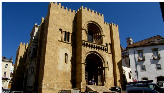
22 - Coimbra, la Sé Velha

sovrasta e domina tutti gli altri edifici. Poco distante dalla torre si trova la chiesa delle Carmelitane la cui fiancata destra è ricoperta da splendidi azulejos. Gironzoliamo ancora fino a mezzogiorno e poi raggiungiamo il parcheggio: questa volta il custode è presente, ma al nostro gesto di pagare fa cenno di andare; noi ringraziamo e non ce lo facciamo ripetere due volte.