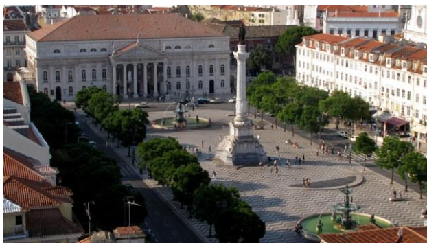
33 - Lisbona - Il Rossio

Bairro Alto e poi nell'Alfama senza trovare un posto nel quale ascoltare il Fado.