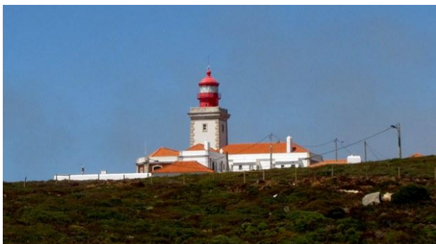
29 - il faro di Cabo da Roca

passate esperienze: forse hanno voluto compensare così l'aver usufruito dell'ingresso gratuito (la domenica) al palazzo reale. Alle 14:30 siamo pronti per ripartire.