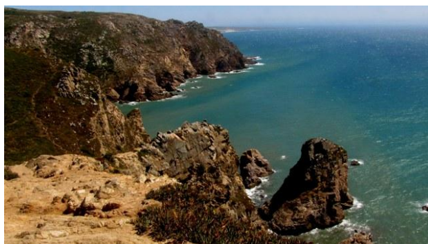
30 - Cabo da Roca

Il campeggio si presenta veramente bene, abbiamo anche la fortuna di trovare all'ingresso un dipendente che parla benissimo l'italiano e che ci aiuta nel disbrigo delle prime formalità e nell'uso del pass elettronico.