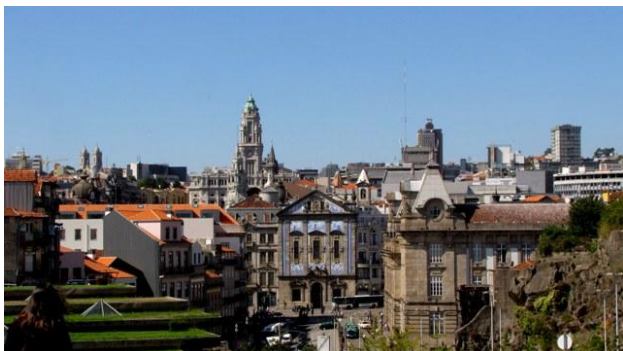
21 - panorama di Porto

Poco prima delle 8:00 lasciato il campeggio raggiungiamo di nuovo il parcheggio di ieri. La sbarra è alzata ma non c'è il custode, ci sistemiamo ugualmente e contiamo di regolare il conto al ritorno.