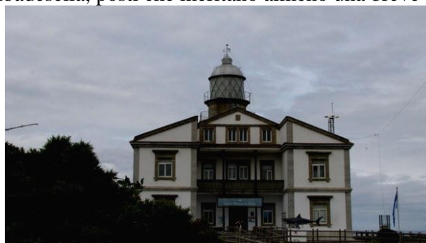
9 - il faro di Cabo de Penas

sosta. Nei pressi Di Berbes, verso le 14:00, ci fermiamo per la sosta pranzo: siamo su una piazzola al margine della strada che è pochissimo trafficata. Il paesaggio che ci circonda è di nuovo un paesaggio montano: speroni di roccia si alzano attraverso una folta vegetazione lussureggiante e in basso, oltre le rocce, si intuisce l’Oceano. Poco dopo questa sosta riprendiamo la A8 per un breve tratto che ci permetterà di aggirare la città di Gijon. Poco dopo le 16:00, dopo circa 180 chilometri raggiungiamo Cabo de Penas (▼), una lingua di terra che addentrandosi nel mare Cantabrigo rappresenta il punto più settentrionale della penisola Iberica: la sua scogliera si innalza a più di cento metri di altezza.