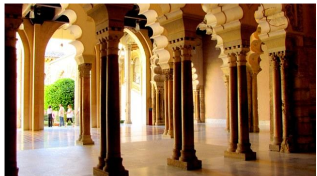
e) Saragozza - l'Aljaferia