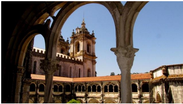
25 - Monasto di Alcobaca

Pedro I del Portogallo e di sua moglie Ines. Avevamo letto a Coimbra della loro tragica storia d'amore. Le loro tombe furono poste, per volere del re, uno di fronte all'altra nel transetto della chiesa, perchè nel momento del giudizio universale, alla resurrezione dei corpi, i due infelici amanti potessero immediatamente ricongiungersi.