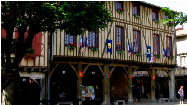
2 - Mirepoix

L'itinerario ci permette di visitare Saint Lizier e La Bastide Clairence che fanno parte del circuito "villaggi più belli di Francia", marchio che viene dato ad alcuni dei paesi più pittoreschi della Francia (avevamo già avuto modo di conoscere e apprezzare molte di queste località nel 2009). A queste due soste abbiamo aggiunto anche Mirepoix, Foix e la Bastide de Serou.