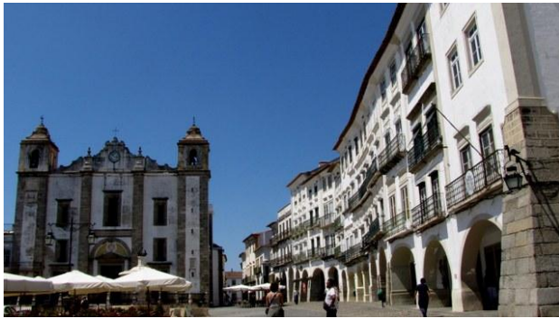
35 - praza do Giraldo

Evora, pur essendo una città, ci colpisce per l'aspetto di paesotto molto tranquillo e per la varietà di