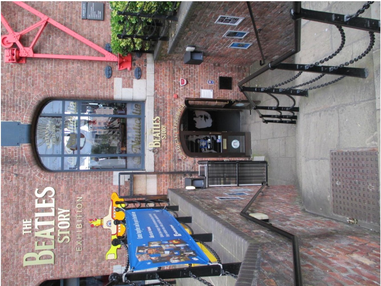
La Cantina dei BEATLES