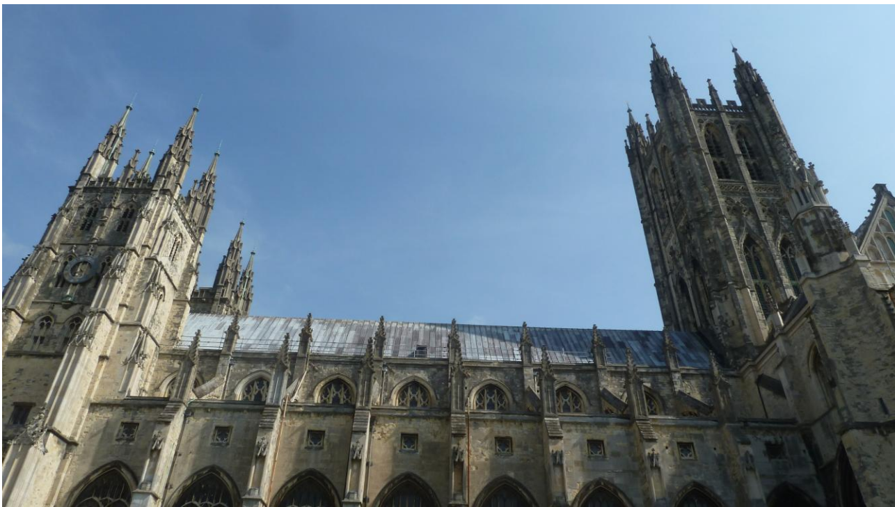
Canterbury la Cattedrale

Alzati di buon mattino, facciamo Chek-in e ci disponiamo per l'imbarco. Partenza puntuale ore 5:40 e arrivo a Dover ore 6:10. Spostiamo gli orologi avanti di 1 ora e dopo tante raccomandazioni delle nostre mogli per la guida a sinistra, cominciamo l'avventura in terra Inglese. Siamo nel Sud Est della Gran Bretagna. Scendiamo dalla nave con molta cautela per la guida a sinistra. Giungiamo a Canterbury e sostiamo in un Park & ride GPS. 51°15'41"- E. 1°06'02" , e con la modesta cifra di 3£. ( €. 3,75) danno la sosta, bus per il centro città e sosta notturna. Fantastico, considerato che sul bus c'è anche W.F. gratis. Andiamo in centro per visitare la stupenda cattedrale, St. Augustine's Abbey e il centro storico. Saturi di tanta bellezza della Cattedrale riprendiamo il bus che ci riporta al parcheggio. Dopo cena sosta notturna tranquilla.