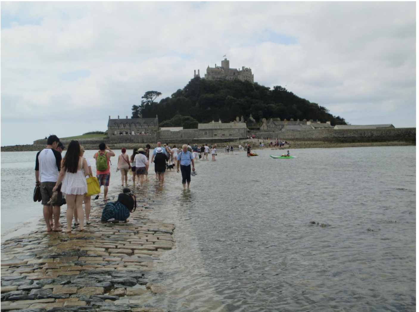
Verso St. MICHAEL'S MOUNT

Percorsi 107 km giungiamo a ST. MICHAEL'S MOUNT. Fronte mare troviamo il parcheggio, per la sosta pagando £. 6.00. stazionati i camper, approfittiamo per andare a visitare il castello essendoci la bassa marea. Il castello è carino ma non al pari di "Le Mont San Michel" in Francia. Ritornati dopo la visita decidiamo di acquistare Fish and Chips che portiamo in camper per mangiare accompagnato da un'ottima bottiglia di bianco Italiano. Caffè e pussa caffè e dopo un breve riposino partiamo alla verso EXETER. Trovato dove lasciare i Camper anche per la notte GPS 50°42'6"N – 3°31'56"O – Supermercato LIDL. Da qui col bus si va in centro per visitare la Cattedrale stile Gotico con i suoi giardini, stupenda. Un ampio giro e poi ai camper. Nota particolare, il supermercato Lidl prima accetta le sterline cambiate in banca a Belfast, ma più tardi riandiamo per fare altri acquisti ma ci dicono che non sono accettate perché non c'è l'effigie della regina, valli a capire questi Inglesi. l'ufficio postale ce li cambia con altre sterline da poter spendere tranquillamente.