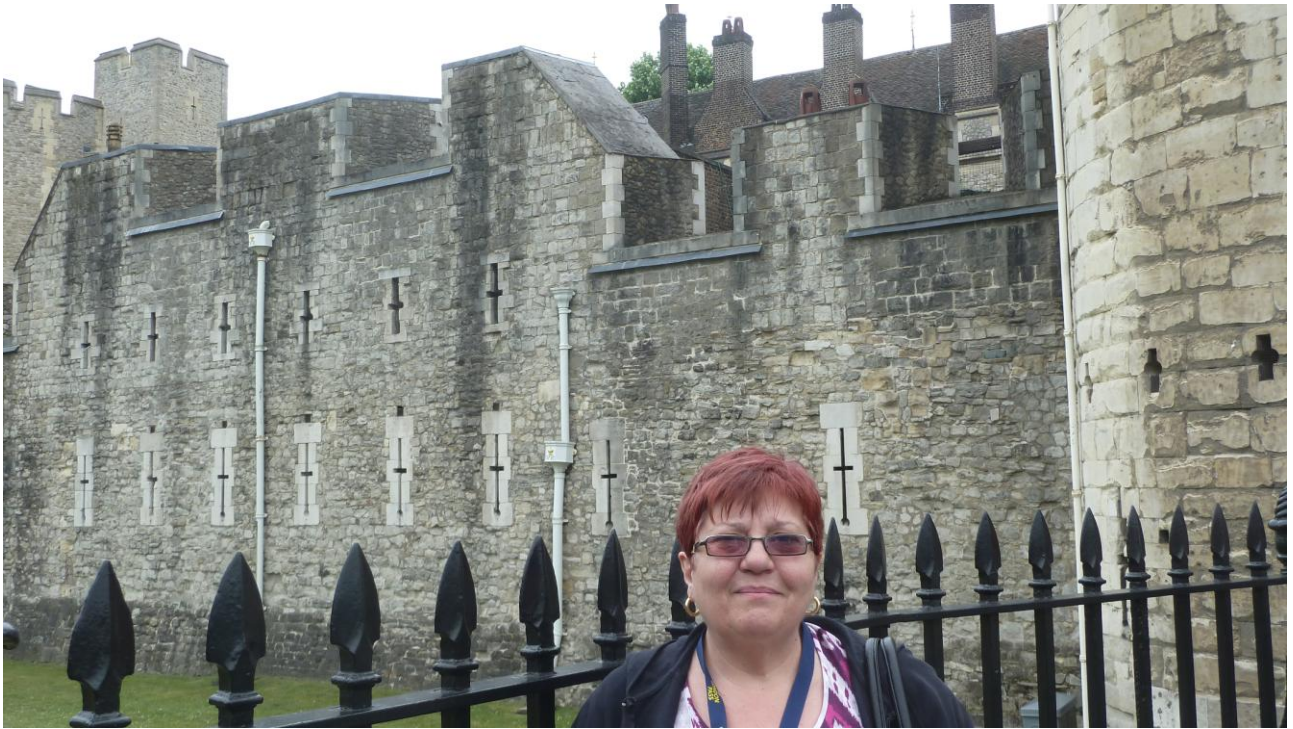
Tower of London