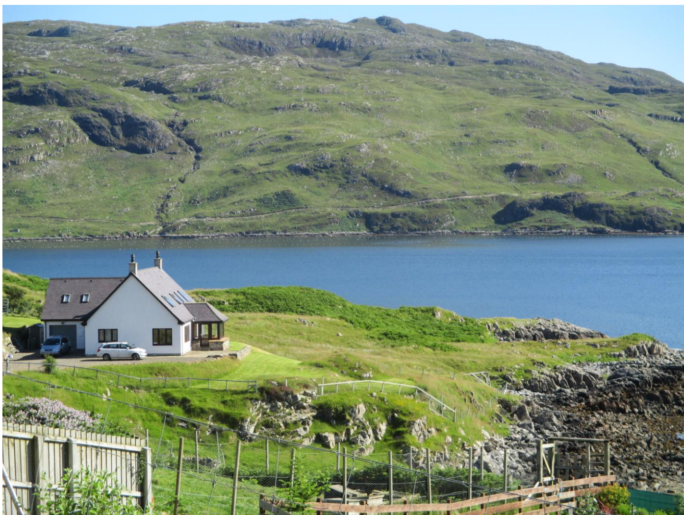
Un paesaggio verso Applecross

Al mattino partenza, e ci fermiamo dopo 81 km. A Ledmore, sosta per breve visita al paesino e poi ripartenza. Da qui la strada è veramente infernale, una sola corsia per i due sensi di marcia con slarghi ogni 100 m. circa per fermarsi e dare precedenza a chi si incontra. Per fortuna gli automobilisti sono gentilissimi e quasi sempre si fermano loro per agevolare il nostro passaggio. Da qui in compenso, attraversiamo paesaggi stupendi, da favola, cieli azzurri, calette con un mare fantastico, verde a perdita d'occhio. Saliamo su una montagna e poi riscendiamo per trovare Applecross Camp Site GPS 57°25'55.67"N- 5°48'44.99"O- £. 24,50/giorno, molto bello e ordinato. Chi vuole venire qui può fare la strada che aggira la montagna allungando di una quindicina di km, ne vale la pena di allungare. Qui relax assoluto anche perché non c'è niente da visitare.