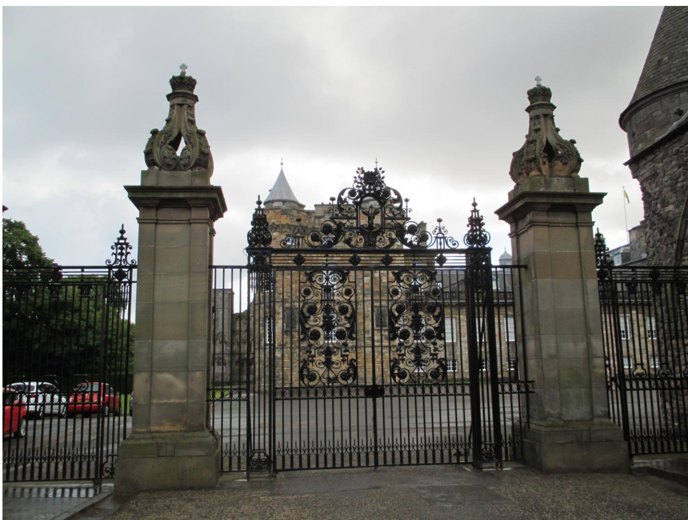
Residenza della REGINA in Scozia

Arrivati a Newcastle, troviamo un posto per sostare liberamente lungo la Marden Road South GPS. 55°2'8" N. – 1°26'37" O. Fatto il giro della città ripartiamo verso Edimburgo. Sosta in campeggio Mortonhall £. 25,75/g. = € 32,49 GPS. 55°54'000"N. – 3°10'33" O. Bus n.11 per centro città. Dopo aver pranzato prendiamo il bus per il centro. Scendiamo a fianco del monumento a Sir Artur Scott e proseguiamo verso la Cattedrale di St. Giles che visitiamo, lungo il percorso incontriamo tanti palazzi stupendi adibiti ad albergo e infine arriviamo al castello di Edimburgo. Ritorniamo indietro per andare a vedere il "Palace of Holyroodhouse" Palazzo della Regina dove dimora quando va in Scozia.