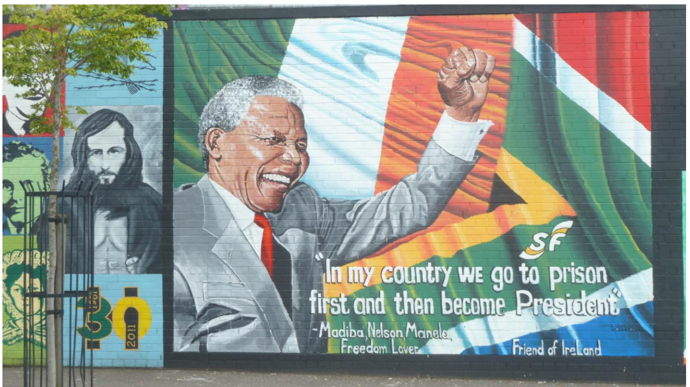
Uno dei tantissimi Murales

16 luglio 2014 – km 70 BUSHMILLS E BAIA DEI GIGANTI-