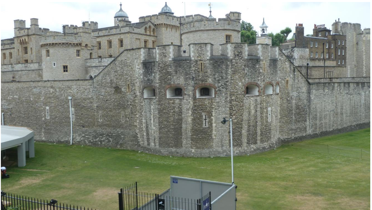
Tower of London