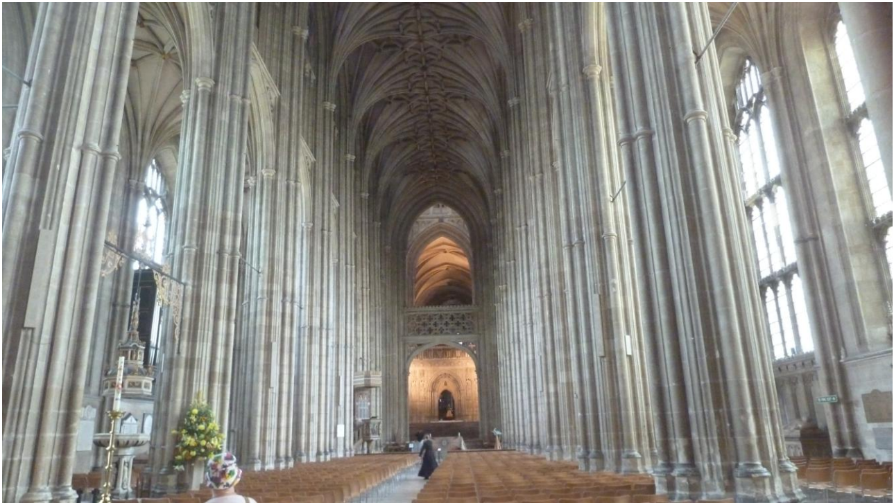
Canterbury – la Cattedrale.

Note di carattere generale per chi vuole andare in Camper o Roulotte.