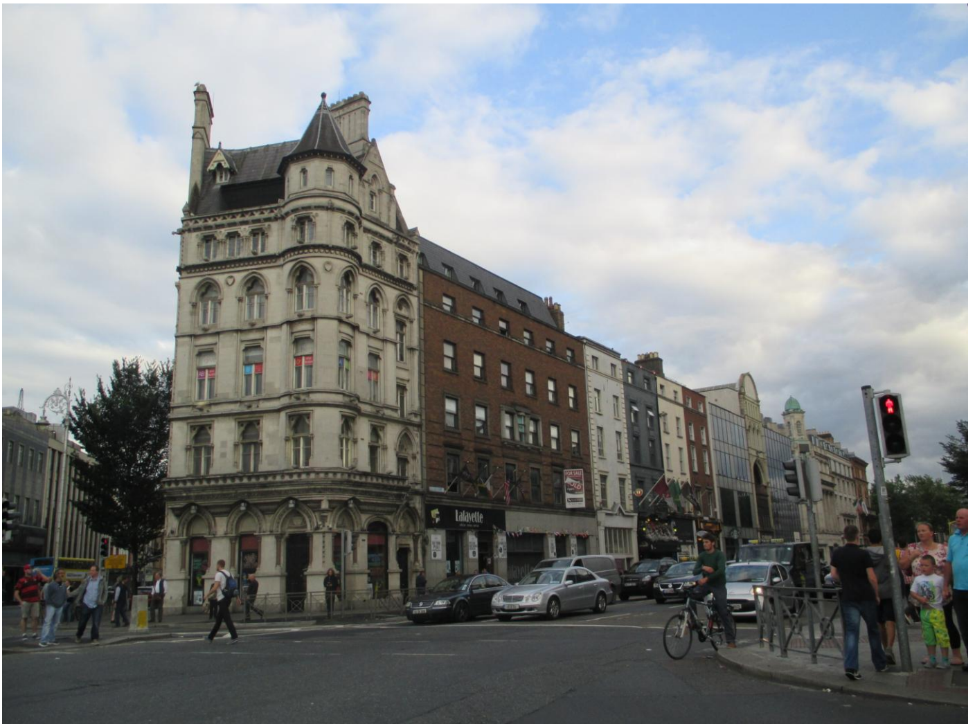
Palazzi nel centro di Dublino

Al mattino percorsi 125 km giungiamo al campeggio che dista circa 10 km dalla capitale, comodissimo perché il bus sosta proprio a fianco. GPS 53°18'16"N – 6°24'53"O- Prendiamo il bus che ci lascia proprio in centro città, comprato i biglietti per il bus turistico della città per due giorni, ne prendiamo uno per fare il primo giro completo. Fissiamo i punti dove scendere per le visite più approfondite, unico neo lo speaker parla solo in Inglese. Città fantastica, bella accogliente, tanti fiori multicolori e tanta storia. La Cattedrale di St. Patrick's, Old Jameson Distillery, Guinness Storehouse, St Patric's Tower, il Trinity College può ospitare fino a 15.000 studenti, immenso, la casa di Oscar Wilde e tanti giardini. La città è viva 24 ore al giorno, tanti musicisti di strada acrobati ,cantanti si esibiscono lungo le strade della città. Ci ha colpito tanto questa allegra e cosmopolita città. Da visitare.