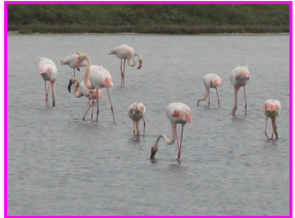
Les Flamants Roses

Sarà che viviamo in una grande città, ma non avremmo mai immaginato di vedere così tante specie di animali in libertà e perfettamente inserite nel contesto in cui vivono.