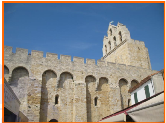
Chiesa Saintes Maries de la Mer

Fu costruita tra i secoli IX e XI come una vera e propria fortezza e serviva come torre di avvistamento e per proteggere gli abitanti dai pirati saraceni che allora imperversavano nella zona.