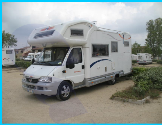
Parcheggio Aigues Mortes