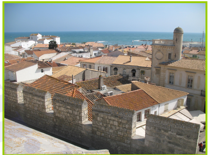
Panorama dal tetto della chiesa

Bighelloniamo in cerca di souvenir, cartoline e quant'altro, e dopo esserci concessi una bibita ristoratrice in un bar sul lungomare rientriamo in campeggio per una bella doccia; dopo cena un po' di Tv ma la stanchezza ha presto il sopravvento.