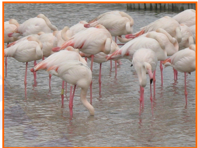
Parc Ornithologique de Pont de Gau

Ritorniamo al camper alle 18.30 dopo aver percorso 17 Km. in bici, e 6-7 a piedi. Il nostro allenamento lascia molto a desiderare e dopo cena non abbiamo bisogno di alcun genere di aiuto per conciliare il sonno, molto soddisfatti però della bellissima giornata trascorsa.