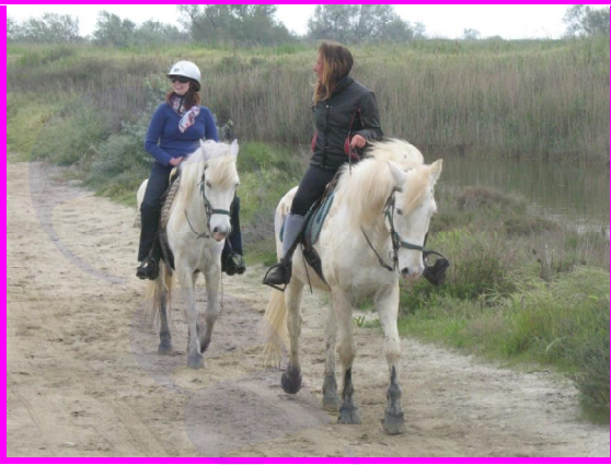
Camargue a cavallo