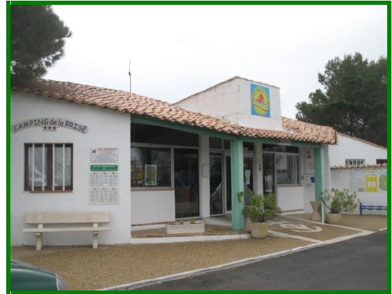
Reception Camping de la Brise

Dopo aver pranzato ci concediamo un po' di relax e fortunatamente torna anche a splendere il sole.