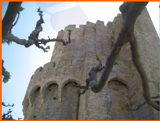
Chiesa Saintes Maries de la Mer

Il monumento più importante del paese è la chiesa che ha sempre avuto un'importante funzione strategica prima ancora che religiosa.