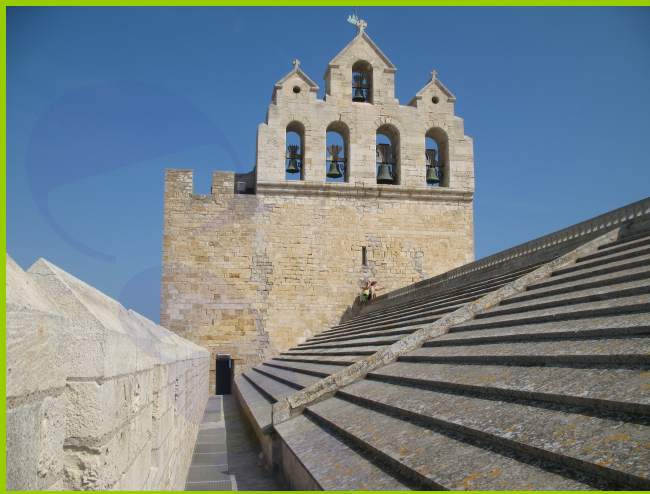
Tetto della Chiesa