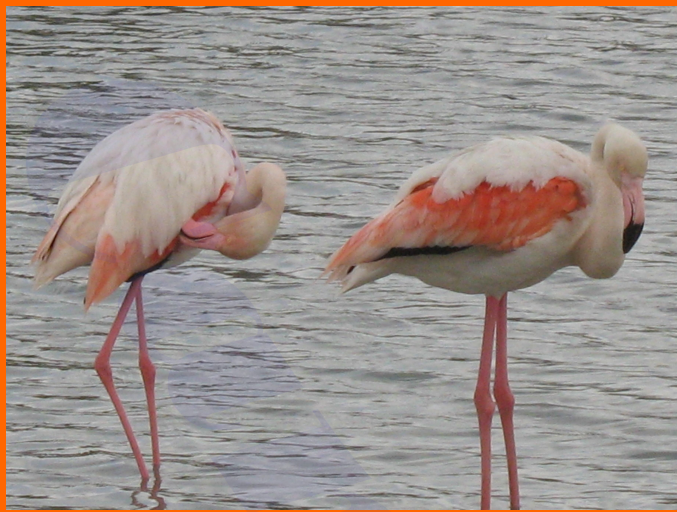
Parc Ornithologique de Pont de Gau