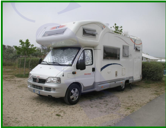
Piazzola Camping de la Brise

Per due notti, camper + 3 adulti + elettricità € 62.50 con il 5% di sconto per i possessori di Camping Card International.