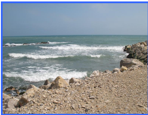
Les Saintes Maries de la Mer

Usciamo dal campeggio a piedi attraverso il passaggio che dà direttamente sul mare e attraverso una bella passeggiata ci avviamo verso il centro del paese.