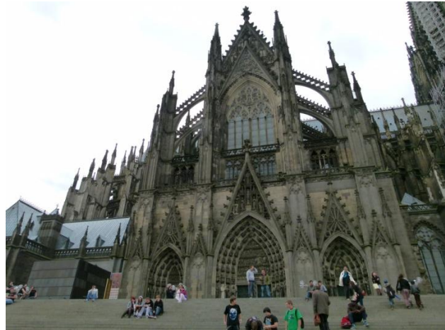
Il duomo di Colonia

Il duomo di Colonia è un'opera veramente imponente che ha richiesto diversi anni di lavoro per la costruzione (circa 6 secoli) ma il risultato è strabiliante. La visita richiederebbe un tempo maggiore ma purtroppo la nostra tabella di marcia deve essere rispettata e dopo aver scattato numerose foto e aver visitato l'interno ci fermiamo per l'acquisto dei soliti souvenir compreso la famosa "acqua di Colonia" e quindi ripartiamo per Aquisgrana.