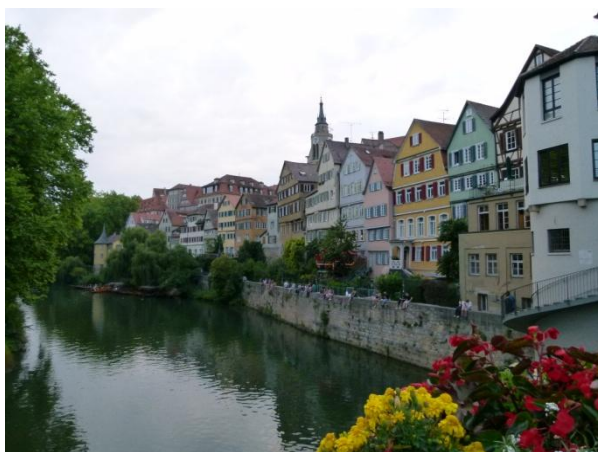
Il centro a Tübingen