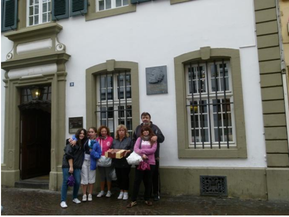
La casa natale di Carlo Marx