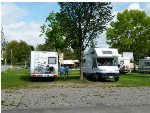
Il campeggio a Koblenza

Ci sistemiamo e pranziamo, quindi alle 14,00 appena fuori dal campeggio saliamo su un barcone che per la modica cifra di 1 euro a testa ci fa attraversare la Mosella e ci fa scendere in prossimità dell'angolo tedesco.