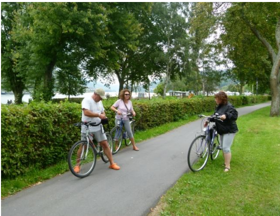
La ciclabile sul Reno

Il tempo purtroppo è cambiato, ovviamente in peggio, e a tratti pioviggina, ma nonostante questo arriviamo dopo circa 6 km nella cittadina di Oberwesel.