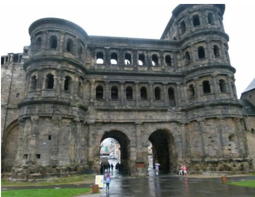
La Porta Nigra

Visitiamo il duomo e poi la Porta Nigra, quindi ci dirigiamo a vedere la casa natale di Carlo Marx.