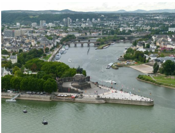
Panorama di Koblenza dalla Fortezza Ehrenbreitstein