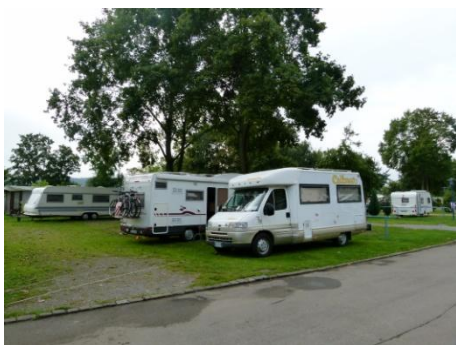
Il campeggio a Tubingen

Ci fermiamo a fare gasolio e poi in un supermercato per fare un po' di spesa, quindi alle 16,00 siamo al campeggio "Neckarcamping" di Tubingen. Gps : N 48°30'38" E 9°2'9"