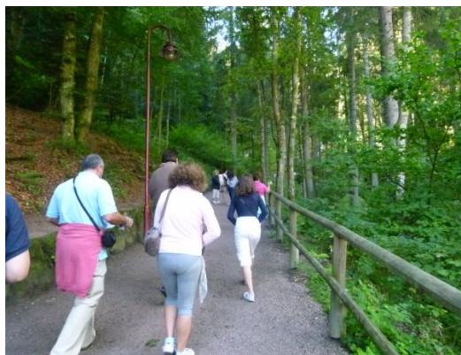
Il sentiero verso le cascate

Andiamo subito a visitare le cascate perché la giornata è stupenda con un bel sole caldo e apprezziamo molto questa passeggiata in mezzo al bosco.