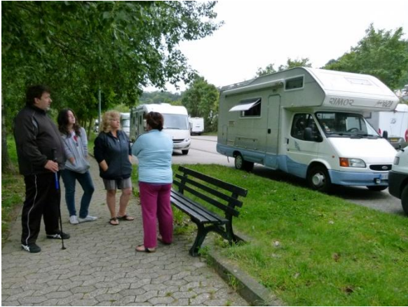
L'area di sosta lungo la Mosella