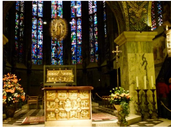
l'urna in oro contenente le spoglie di Carlo Magno

Alle 14,30 usciamo dal locale e decidiamo di cercare il negozio Birkenstok. Lo troviamo abbastanza facilmente e compriamo 3 paia di sandali e un paio di calze per la Virgi.