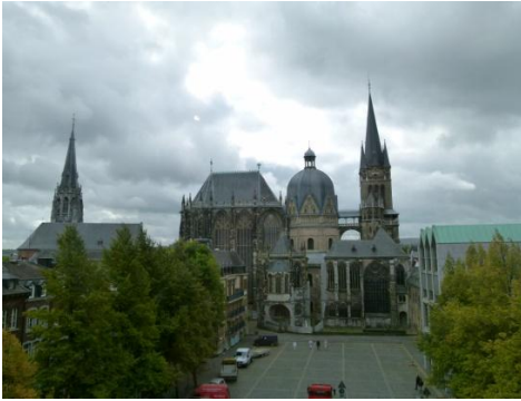
Il duomo di Aquisgrana