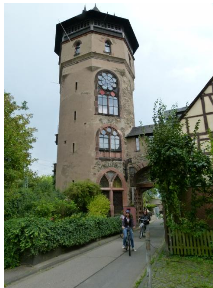
Una torre delle fortificazioni

Alle 18 ritorniamo verso i camper e ci prepariamo per la cena.