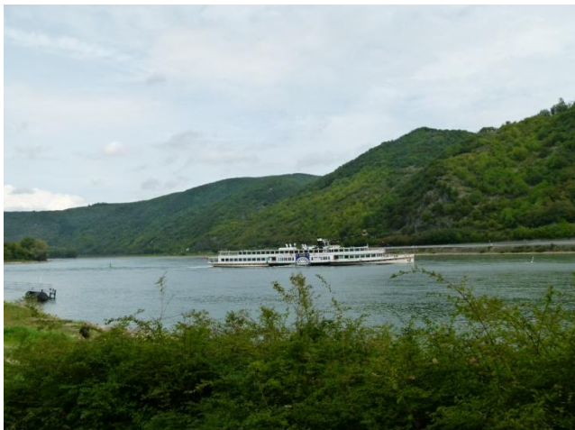
Scorcio lungo il Reno

Anche stamattina il tempo è discretamente bello e dopo le normali operazioni di camper service alle 10.00 partiamo dal campeggio e ci portiamo a Bingen per percorrere tutta la strada che costeggia il fiume Reno fino a Boppard.