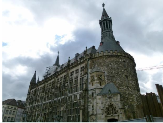
Il Rathaus di Aquisgrana

Il Rathaus è molto bello, forse più da fuori che internamente, è stato completamente distrutto durante la seconda guerra mondiale e abilmente ricostruito in seguito rispettando fedelmente la disposizione originale del palazzo. Terminata la visita ci spostiamo verso il duomo per la visita, curiosi di ammirare la tomba contenente i resti di Carlo Magno.