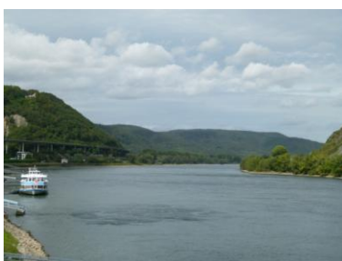
Il battello ad Andernach

Riassetto del camper e dopo il pagamento del campeggio partiamo per andare a vedere il geysir ad Andernach. Giunti sul luogo ci rendiamo conto che la visita prevede l'uso di un battello per poter accedere nel luogo dove si trova geysir e la visita di un museo compresa nel prezzo del biglietto per un totale di circa 3 o 4 ore.