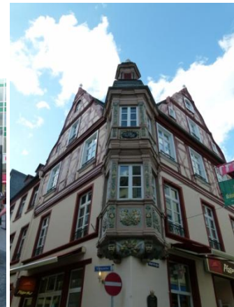
Particolare del centro di Koblenza

Appena arrivati prepariamo tutto l'occorrente per il barbecue e alle 20 riusciamo a cenare con ottimi salamini e lonza, annaffiati dall'ottima birra tedesca.