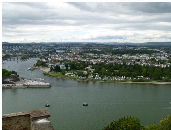
Panorama di Koblenza dalla Fortezza Ehrenbreitstein

Dopo aver scattato un po' di foto cerchiamo il punto dove poter prendere la funivia per salire verso la fortezza Ehrenbreitstein dalla quale si gode uno spettacolare panorama. Riusciamo a trovare il punto ma per potervi accedere bisogna pagare l'ingresso per una mostra floreale dal costo di 20 € a testa che include anche l'accesso al castello.