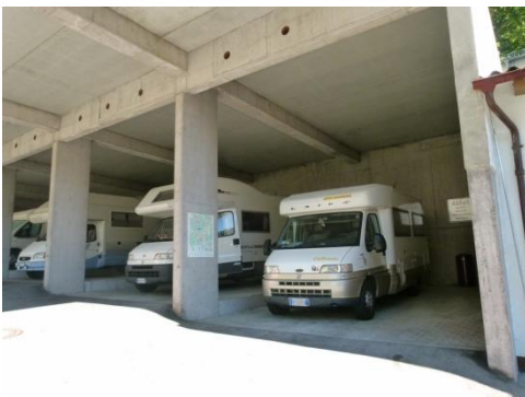
L'area di sosta a Triberg

Sveglia alle 7,30 e partiamo alle 8,00 per Triberg. Appena arrivati in paese ci fermiamo in un supermercato per acquistare un po' di birra da portare a casa e poi ci sistemiamo nell'area di sosta anche se dobbiamo aspettare circa mezz'ora che un paio di camper francesi se ne vadano e ci lascino libera la piazzola.