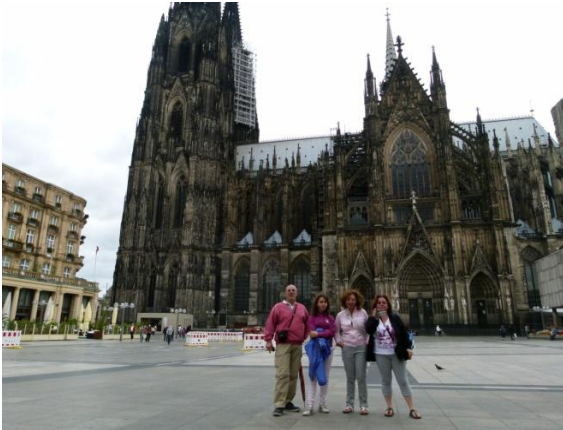
Il duomo di Colonia

Pranziamo e quindi cerchiamo un parcheggio lungo il Reno cercando di avvicinarci il più possibile al centro. Dopo vari tentativi riusciamo a sistemarci a circa 1 km dal centro, paghiamo la sosta € 2,50 per 2 ore, e ci avviamo per la visita del duomo.