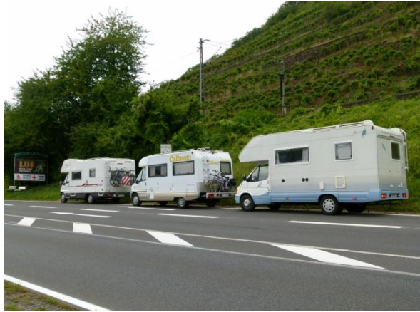
Il gruppo al completo