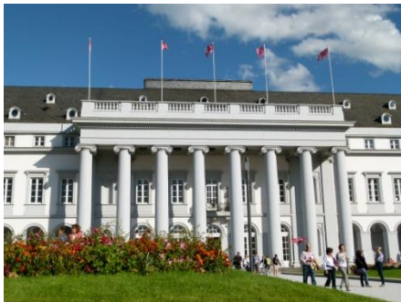
Il castello dei principi elettori di Koblenza