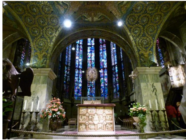
l'interno del Duomo