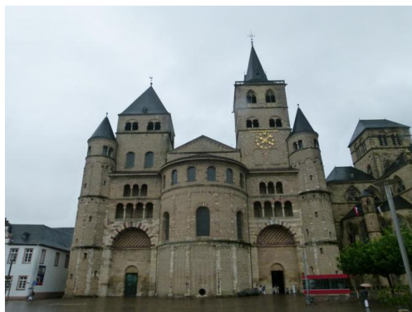
Il duomo di Trier