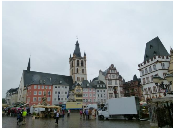
La piazza di Trier

Trier ci appare vivace, pulita e ordinata, come la maggior parte delle cittadine finora visitate, magari con il sole sarebbe ancora meglio.