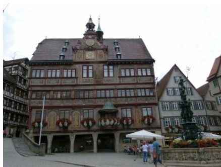
Il Rathaus di Tubingen