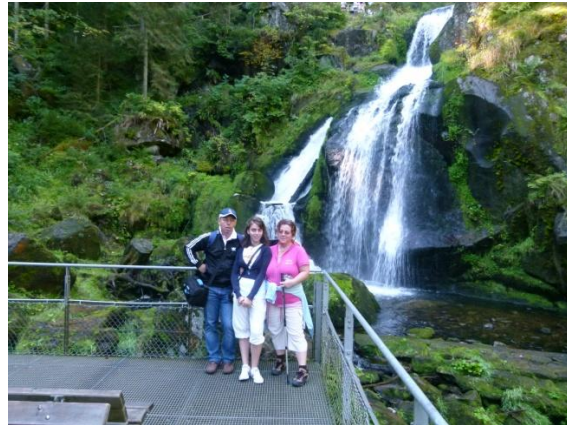
Le cascate di Triberg

Torniamo in paese ed entriamo in un negozio tipico di souvenir dove ci sono ovviamente decine e decine di orologi a cucù, uno diverso dall'altro dal più piccolo a quello di dimensioni esagerate ...anche nel prezzo!!!