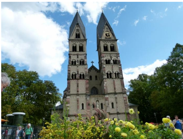
La basilica di Koblenza

Appena arrivati prepariamo tutto l'occorrente per il barbecue e alle 20 riusciamo a cenare con ottimi salamini e lonza, annaffiati dall'ottima birra tedesca.