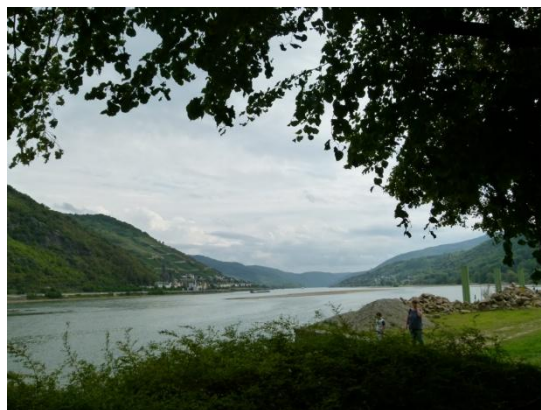
Il Reno a Bacharach