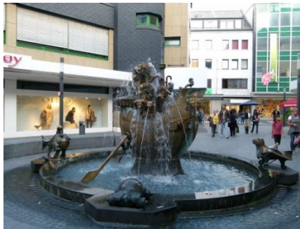
Una fontana a Koblenza