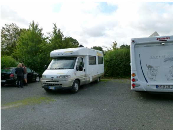
L'area di sosta ad Aquisgrana