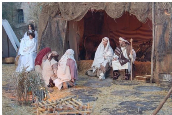
Il presepe vivente a Casole d'Elsa

Alle 17,30 ci mettiamo in viaggio per Castelnuovo della Berardenga nel parcheggio (N 43°20'41.5" E 11°30'06.1" via della Vigna) proprio sotto il paese, bello, tranquillo ma da sconsigliare ai camper perché l'accesso è in forte pendenza (strusciato il paraurti posteriore sia in entrata che in uscita). Dopo un breve giro per il borgo "bandiera arancione" si torna ai camper per la cena e il pernottamento molto tranquillo.