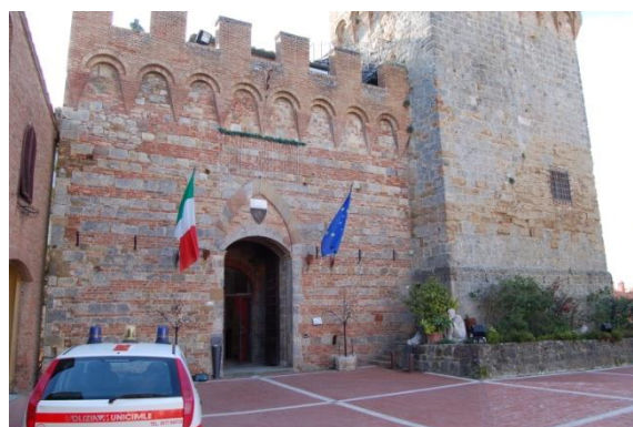
Il borgo bandiera arancione : Casole d'Elsa

Alle ore 09,30 ci dirigiamo a Casole d'Elsa per il "presepe vivente" che si tiene dalle 15,00 alle 19,00. Parcheggiato i mezzi di fianco alle scuole a 200 mt dal centro andiamo alla scoperta del piccolo ma bellissimo borgo. Dopo pranzo alle ore 15,00 si va a vedere il presepe vivente ( 5 €/persona) veramente bello per le persone e i costumi impegnati nella manifestazione.