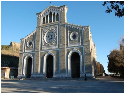
Cortona : il santuario