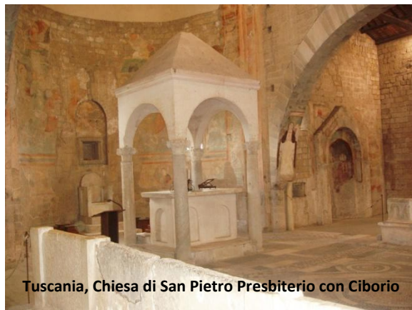
Tuscania, Chiesa di San Pietro Presbiterio con Ciborio

L'interno della chiesa è diviso in tre navate: quella centrale, in cui spicca un pavimento cosmatesco a decorazioni geometriche che indica gli spazi della prima costruzione, risulta separata dalle altre attraverso un basso muro in cui sono ricavati dei sedili in pietra. Nella navata di destra un ciborio risalente al XIII secolo e l'ingresso principale alla cripta. Nella navata di sinistra l'ingresso secondario alla cripta sovrastato da un nicchione affrescato e diversi sarcofagi etruschi. Il transetto