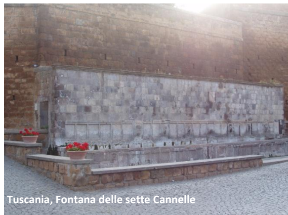
Tuscania, Fontana delle sette Cannelle

Comodamente seduti sull'autovettura dei nostri amici, percorriamo i circa mille metri che ci separano dalla Chiesa di San Pietro che sorge