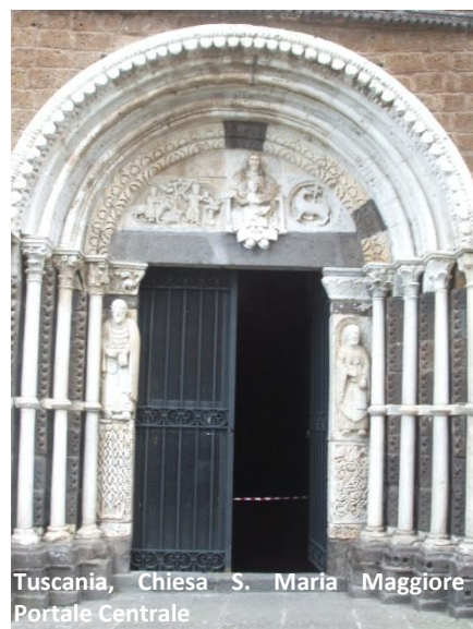
Tuscania, Chiesa S. Maria Maggiore Portale Centrale

Sulla facciata si aprono tre portali finemente decorati. Quello centrale , in marmo bianco, è molto strombato e fiancheggiato da due colonne scanalate a tortiglione. Presenta due leoni sovrastati da una lunetta con quattro archi sorretti da doppie colonne e con differenti capitelli. Negli stipiti sono scolpite le figure degli apostoli Pietro e Paolo, in parte ricostruite dopo un atto vandalico. Nella lunetta sono poste le figure della Madonna con Bambino Benedicente e da sinistra, Balaam