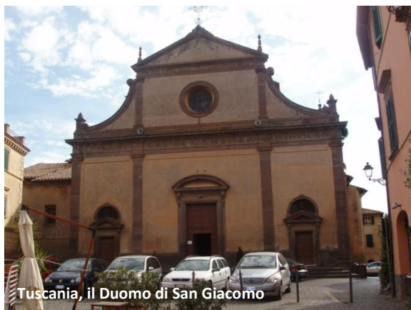
Tuscania, il Duomo di San Giacomo

Il nostro itinerario dentro le mura inizia da Porta del Poggio che immette su Via Roma.