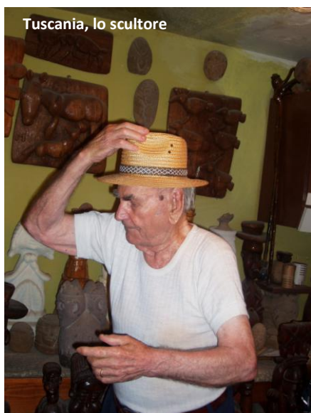
Toscana, lo scultore

Mentre, incuriositi, facevamo qualche foto, esce un anziano signore che è il proprietario e l'artefice delle sculture e ci chiede se vogliamo vedere alcune sue opere.