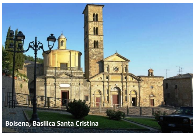
Bolsena, Basilica Santa Cristina

La parte più antica del complesso è costituita dalle