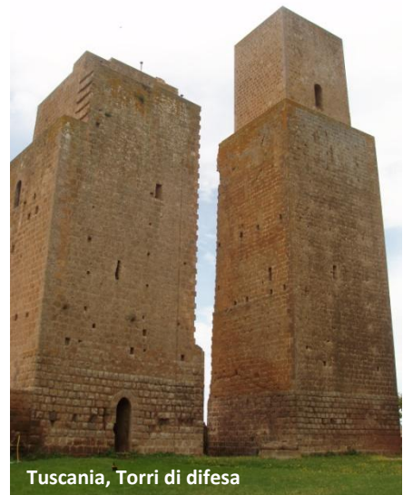
Tuscania, Torri di difesa

iniziato da Pietro Toesca. Secondo questo critico la costruzione di San Pietro, ad opera di maestri comacini, risalirebbe all'VIII secolo, quando Tuscania fu donata da Carlo Magno a papa Adriano I: se questa ipotesi fosse vera, San Pietro sarebbe un caposaldo nella storia dell'architettura italiana in quanto segnerebbe il punto di trapasso dalle forme paleocristiane a quelle romaniche. Studi più recenti, invece, collocano la costruzione all'XI secolo, privandola così di ogni carica innovativa. In un testo del 1997 Renato Bonelli ha visto in San Pietro di Tuscania addirittura un esempio di quel tratto reazionario, tipico della cultura artistica dell'Italia centrale fra il mille e la metà del milleduecento, di rifiuto della costruzione a volta.