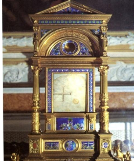
Bolsena, Basilica Santa Cristina – reliquia Sacra Pietra