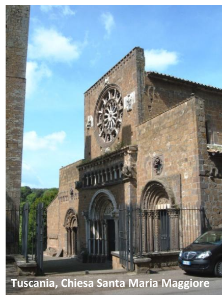
Tuscania, Chiesa Santa Maria Maggiore