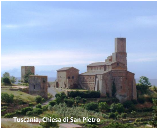
Tuscania, Chiesa di San Pietro

sull'omonimo colle già probabile sede dell'acropoli etrusca. Il fronte della chiesa si affaccia su uno spiazzo erboso tra il Palazzo dei Canonici e le possenti torri di difesa (ne sono rimaste tre, memoria dell'importanza strategica dell'area) mentre l'altissima abside si staglia verso il vicino centro abitato.