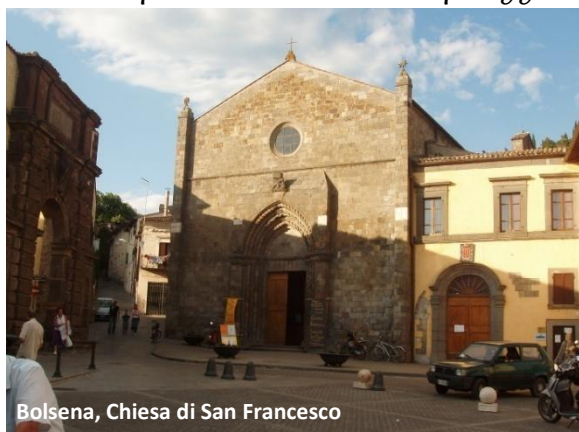
Bolsena, Chiesa di San Francesco

Raggiungiamo in bici la centrale Piazza Matteotti e proseguiamo la visita a piedi. Nella stessa piazza si affaccia la Chiesa di San Francesco;