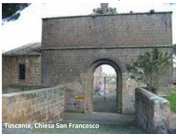
Tuscania, Chiesa San Francesco

Continuiamo il nostro percorso ed arriviamo al complesso dell'ex Chiesa di San Francesco, la cui fondazione risale al 3 luglio 1281.