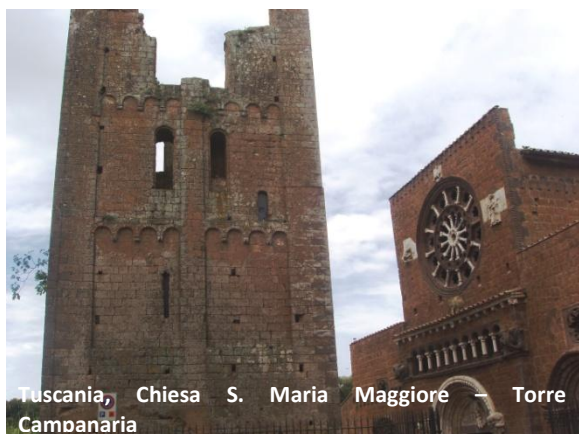
Tuscania, Chiesa S. Maria Maggiore — Torre Campanaria

Staccata dalla chiesa, la poderosa, seppur mozza, torre campanaria di