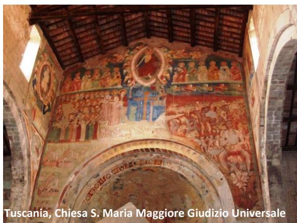
Tuscania, Chiesa S. Maria Maggiore Giudizio Universale

Nella navata centrale si ammira un prezioso pergamo del Duecento con frammenti alto medievali. Al termine della navata sinistra è notevole un altare con "fenestrella" elemento tipico delle "confessio" ossia i luoghi di sepoltura divenuti centri di devozione. Effettivamente nella chiesa erano conservati innumerevoli reliquie e vi erano sepolti molti santi martiri.