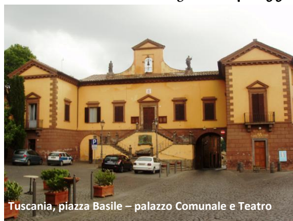
Tuscania, piazza Basile – palazzo Comunale e Teatro

Proseguendo lungo la Via Rivellino si sbocca nella rettangolare piazza Basile, a sinistra l'ex chiesa di S. Croce, risalente probabilmente alla fine del secolo XII: ospita l'Archivio Storico e la Biblioteca Comunale ed è preceduta da un giardino del palazzo già Campanari sul cui muro di cinta sono allineati nove coperchi di sarcofagi etruschi con figure giacenti. Di fronte è il Palazzo Comunale, nel cui interno sono conservate alcune lapidi romane e medievali. Da qui si sottopassa un voltone e si raggiunge la Piazza del Teatro dominata dal moderno Teatro Il Rivellino, costruito sull'area dove un tempo sorgevano il Palazzo del Podestà e la Torre del Bargello.