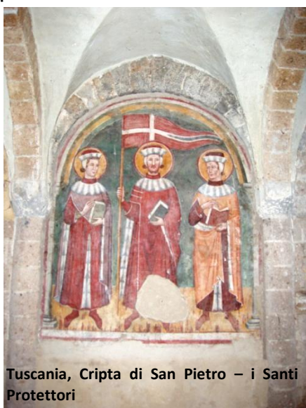
Tuscania, Cripta di San Pietro – i Santi Protettori

rialzato ospita un presbiterio con ciborio (risalente all'XI secolo, vi è una iscrizione del 1093), seggio vescovile (San Pietro fu Cattedrale di Tuscania sino al XV secolo), ambone di epoca romanica costruito utilizzando elementi alto medievali. Il tetto è a capriate lignee. Purtroppo la maggior parte della decorazione pittorica è andata perduta. Fra l'altro, un affresco di scuola romana, pur con influenze bizantine, rappresentante Cristo Pantocrator circondato da angeli risalente agli anni a cavallo fra XI e XII secolo che dominava la parte absidale è andato distrutto nel terremoto del 1971. Rimangono solo alcuni dei soggetti che lo inquadravano: un Cristo benedicente e anche angeli, apostoli e simboli divini. Nell'absidiola di destra un Cristo benedicente fra due vescovi mentre in quella di sinistra il Battesimo del Cristo. Nella parte sommitale del presbiterio rimane, solo in minima parte, un ciclo di affreschi che fanno riferimento alla vita di San Pietro