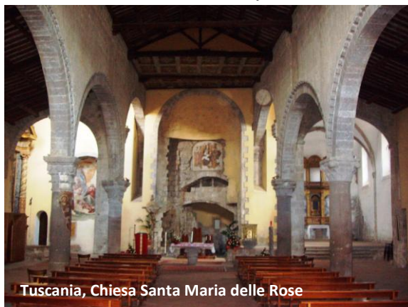
Tuscania, Chiesa Santa Maria delle Rose

Nell'interno, a tre navate, sono molto evidenti i rimaneggiamenti che si sono succeduti nel corso del