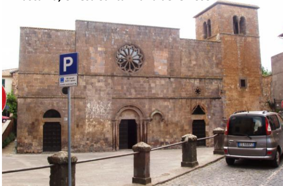
Tuscania, Chiesa Santa Maria delle Rose

mura di Tuscania. Con la guida dei nostri amici, iniziamo il tour partendo dalla Chiesa di Santa Maria delle Rose.