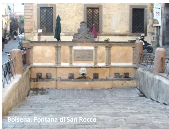
Bolsena, Fontana di San Rocco

L'acqua che sgorga da questa fontana, secondo i Bolsenesi, è miracolosa. Si narra, infatti, che San Rocco, guaritore degli appestati, giunto a Bolsena con una piaga sulla coscia, guarì dopo essersi lavato la stessa con l'acqua della fonte. Da allora, per celebrare questo miracolo, ogni anno, il 16 agosto, viene celebrata una messa durante la quale viene benedetta l'acqua della fontana.