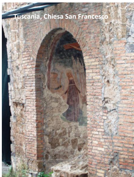
Toscana, Chiesa San Francesco

nel 1882, a causa di un incendio, venne completamente distrutto il tetto. Nel 1898 la navata longitudinale della chiesa fu adibita a mattatoio pubblico, fino al 1971 quando la città fu colpita da un violento sisma. Nel 2000 iniziarono i lavori per il recupero dell'intero complesso: il convento è stato completamente ricostruito, mentre lo status di rudere della chiesa è stato conservato.