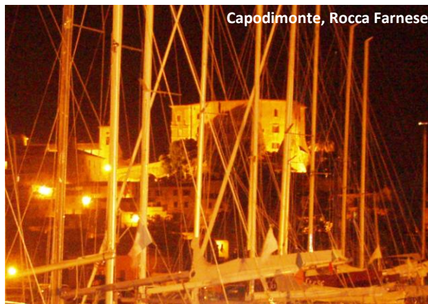
Capodimonte, Rocca Farnese

anche la stupenda isola Bisentina, che rappresenta un'interessante escursione, essendo collegata al paese da un efficiente servizio di motoscafi, muniti di guida turistica. Ha un attrezzato porto per barche a vela e a motore che, assieme all'accogliente spiaggia e al territorio ricco di storia, è motivo d'attrazione per un intenso turismo estivo.