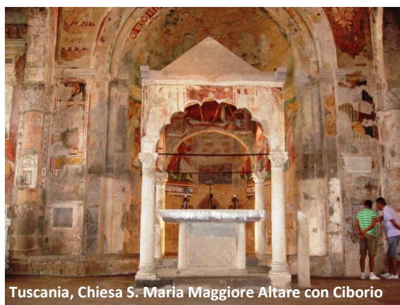
Tuscania, Chiesa S. Maria Maggiore Altare con Ciborio

Il presbiterio è fiancheggiato da due arcate trasversali; il paliotto dell'altare, sormontato da un ciborio in forme gotiche primitive con vele interne affrescate e rozza sedia vescovile, è costituito da un pluteo dell'VIII-IX secolo. Nella navata destra è collocato un fonte battesimale ad immersione di forma ottagonale risalente al XIII secolo.