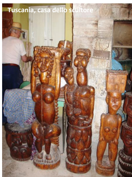
Toscana, casa dello scultore

racconta, "sculpire è come fare all'amore, non riesco a starne senza".