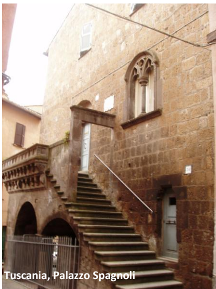
Tuscania, Palazzo Spagnoli

Proseguiamo la passeggiata tra le caratteristiche stradine del borgo medioevale, dove ogni angolo, ogni costruzione ha un suo fascino ed una sua storia da raccontare.