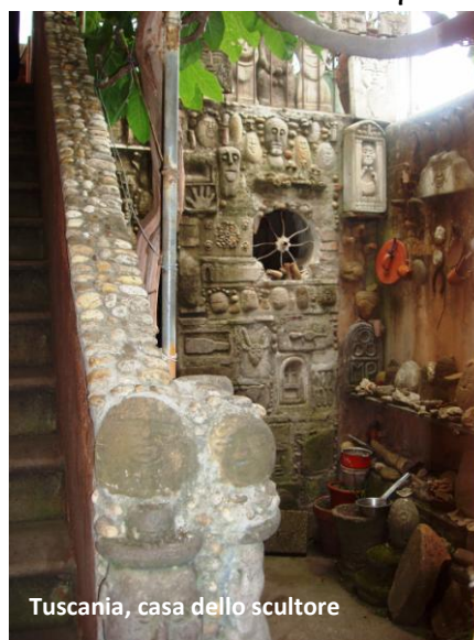
Toscana, casa dello scultore

Ci conduce, così, in uno scantinato pieno di sculture in legno, marmo, tufo e altri materiali.