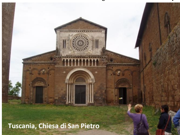
Tuscania, Chiesa di San Pietro

La facciata, avanzata nel corpo centrale, presenta quali elementi