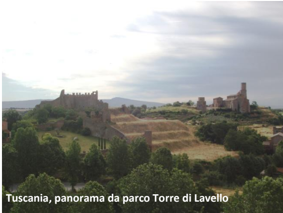
Tuscania, panorama da parco Torre di Lavello

Proseguendo per Via Roma, si giunge al Parco belvedere di Torre Lavello .