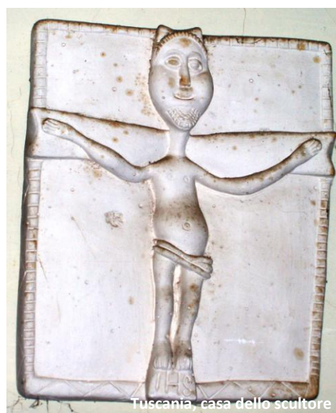
Toscana, casa dello scultore