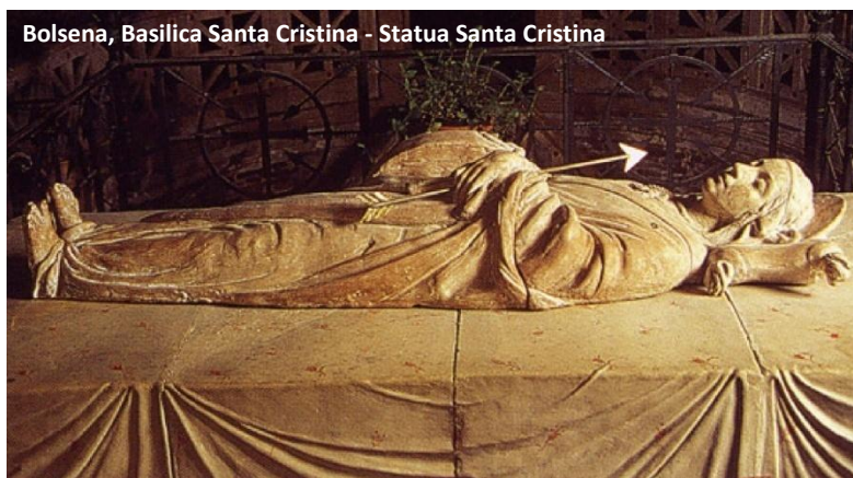
Bolsena, Basilica Santa Cristina - Statua Santa Cristina

Ai primi del XVI secolo, sul luogo sotto il quale giaceva il corpo della Santa venne sistemata una bellissima statua in terracotta, attribuita a Benedetto Buglioni, raffigurante la martire bambina giacente nel sonno della morte.