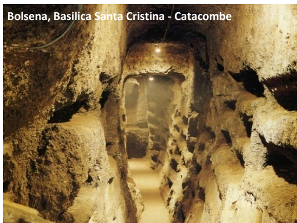
Bolsena, Basilica Santa Cristina - Catacombe

catacombe e dalla Grotta di Santa Cristina, ritenuta il primitivo luogo