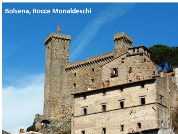
Bolsena, Rocca Monaldeschi

Saliamo ora nella parte alta del borgo antico, dove si trova la Rocca Monaldeschi della Cervara che si erge sulla sommità di un rilievo che domina il quartiere medievale.