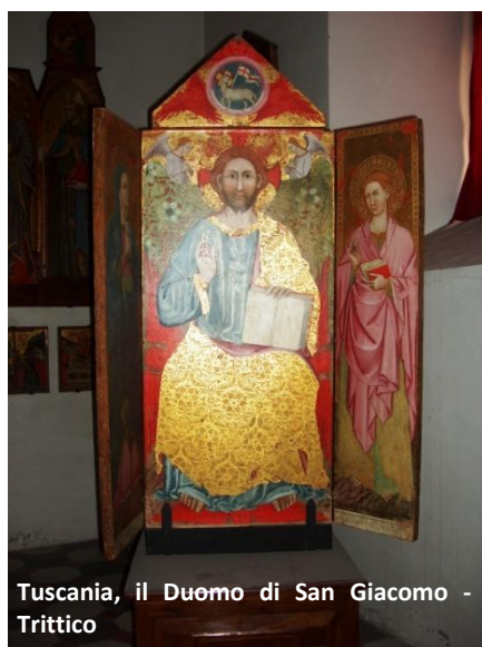
Tuscania, il Duomo di San Giacomo - Trittico

L'interno, a tre navate, presenta tre cappelle: una sul fondo di ogni navata laterale, e una terza, all'inizio di quella di sinistra, che assolve la funzione di battistero. In fondo alla navata di destra, nella Cappella dei Santi Giusto e Giuliano, sono conservati dipinti su tavola di provenienza e di