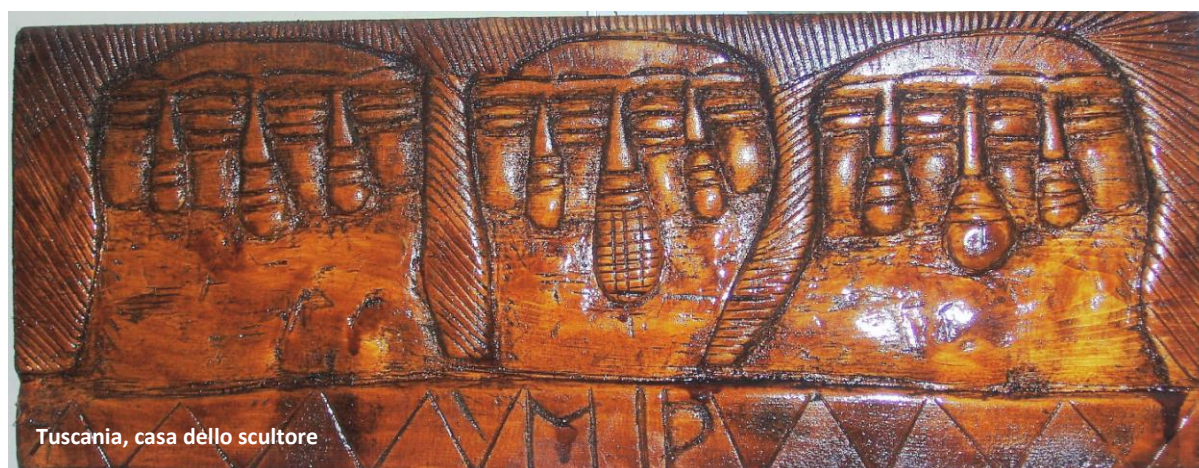
Toscana, casa dello scultore

Si è fatto veramente tardi e ci aspetta un lungo viaggio. Salutiamo e ringraziamo gli amici ritrovati dopo oltre 40 anni e facciamo ritorno a casa.