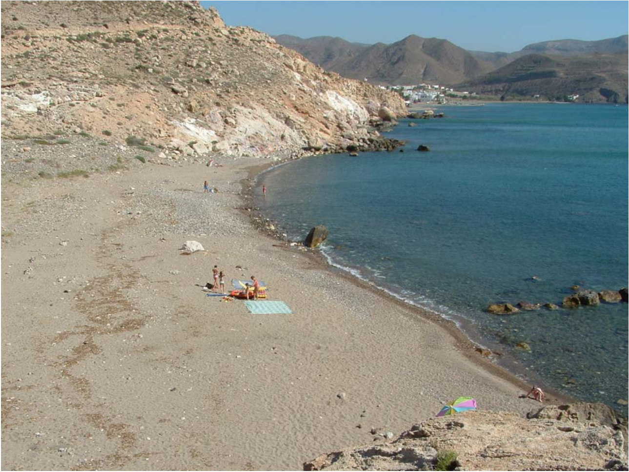
SPIAGGIA DEL CAMPEGGIO