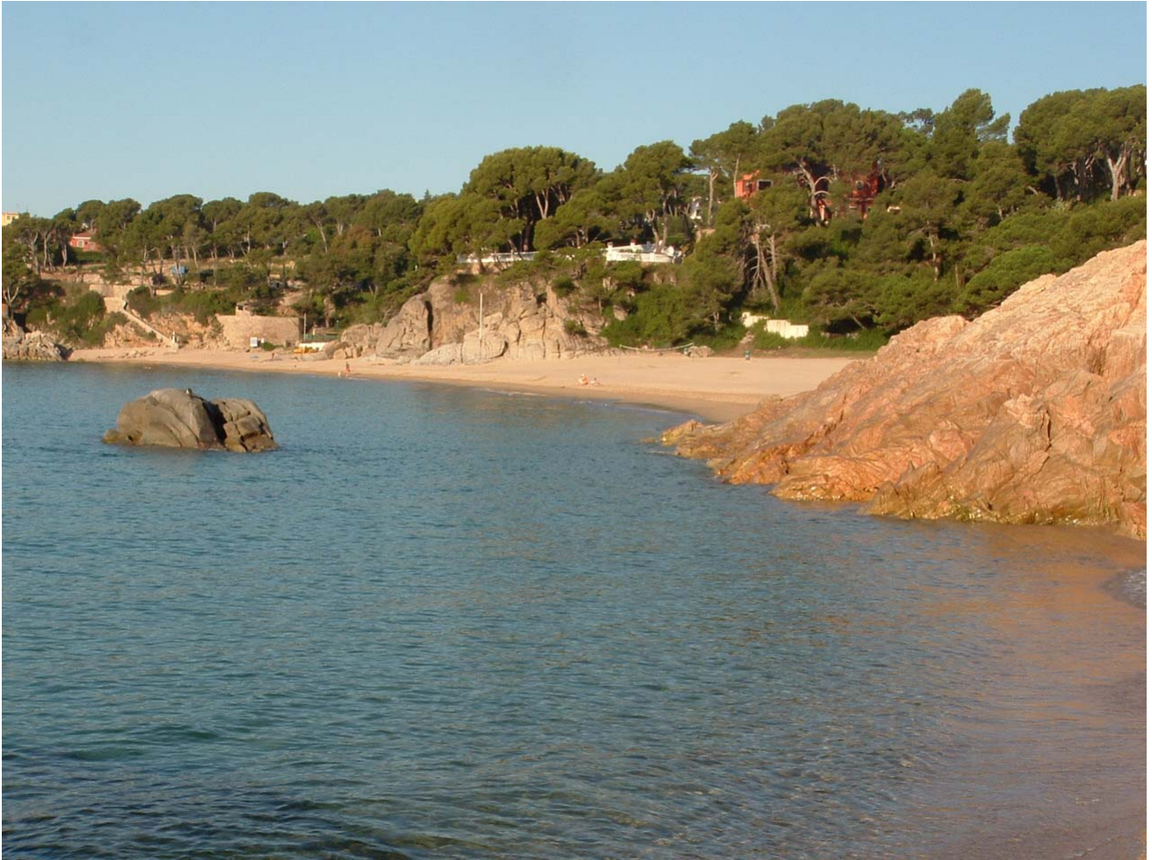
SPIAGGIA CAMPING TREUMAL