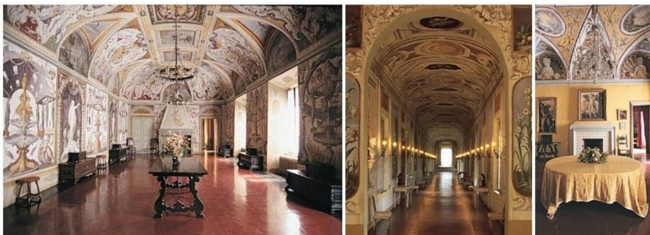
Le immagini delle sale sono prese da internet. All'interno della Rocca non è possibile scattare fotografie.

Lasciata Soragna, prima di fermarci a Fontanellato, facciamo una piccola sosta al Fidenza Outlet Village . Come non approfittare di un outlet per un po' di shopping?