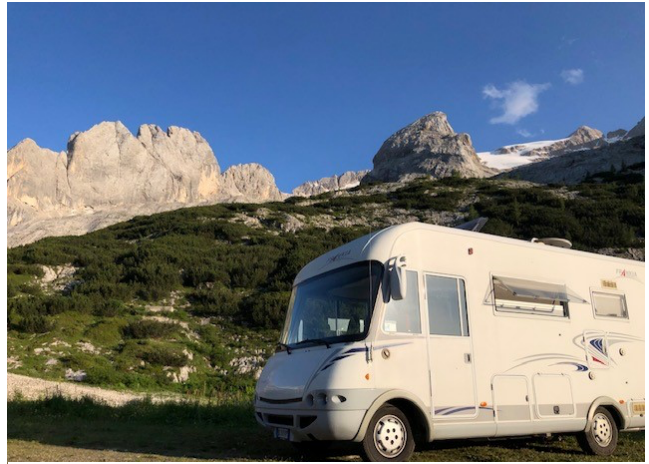
Figura 2 Sosta a Passo Fedaia

Lun 19/07/2021: uno dei miei desideri è visitare il lago di Carezza, per questo ci trasferiamo nel vicino paese di Nova Levante, lasciamo il camper agli impianti di risalita e tramite una faticosa (causa sole a picco) camminata attraverso il sentiero 7 raggiungiamo il lago; in realtà non è così “wow” come me lo aspettavo, purtroppo la tempesta del 2018 ha spazzato via moltissimi alberi dai bordi del lago. Anche le attività (bar, ristorante) in riva al lago sono a mio avviso troppo commerciali; vabbè, dopo uno strudel al volo rientriamo al camper (il ritorno, attraverso il sentiero 10 è molto più piacevole, alla fine il totale sarà di 15km e 450mt di dislivello) e ci spostiamo verso il Passo Fedaia, la meta scelta per la notte. (0€-85km)