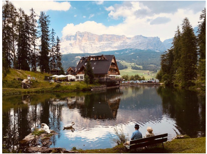
Figura 4 Laghetto Sompunt, quasi una cartolina

Gio 22/07/2021: ci spostiamo verso L'alta Badia, più precisamente a "La Villa", presso "l'area camper Odlina" poiché necessitiamo del c/s. Dall'area sosta parte direttamente un sentiero che in breve ci porta al "laghetto Sompunt" dove si può ammirare un paesaggio da cartolina (vedi foto); nel pomeriggio prendiamo le biciclette e con la comoda ciclopedonale raggiungiamo lo splendido paese di "San Cassiano" per una merenda al volo. Il ritorno verso La Villa è molto comodo, tutto in discesa, anche se accompagnati da un bel temporalone. (30€-48km)