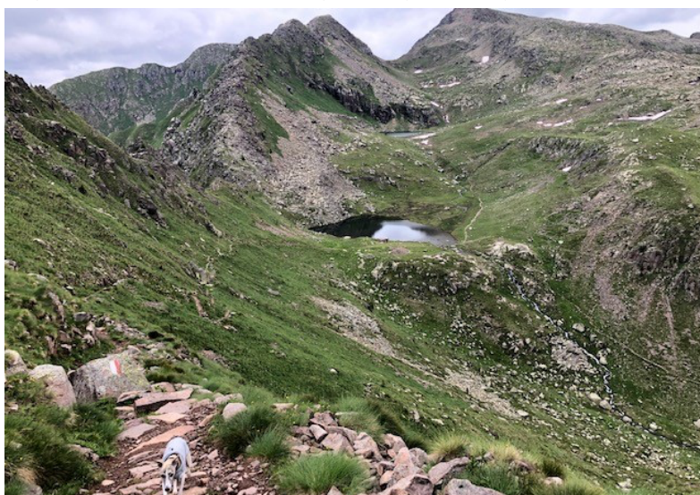
Figura 1 Laghi di Lusia, vista dall'alto

Dom 18/07/2021: oggi si va in mountain bike fino al ponte sospeso, un bel ponte tibetano di 40mt raggiungibile con un sentiero che parte direttamente dal camping; non riusciamo a farlo tutto in mtb poiché una parte del sentiero è franata ma in circa 30 minuti lo si raggiunge. Esperienza carina e tutto sommato rilassante; in serata ci godiamo una magnifica pizza alla "Terrazza Lagorai", mentirei se dicessi che non si tratta di una delle migliori pizze che abbia mai mangiato, quale modo migliore per concludere questa breve esperienza in val di Fiemme (35€-0km)