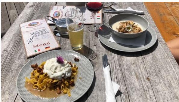
Figura 5 Goduria al rifugio Gardenacia (tagliolini finferli e burrata + gnocchi di polenta nera)

L'ultimo tratto è molto impegnativo ma una volta al rifugio possiamo godere del frutto delle nostre fatiche (vedi foto). A fine giornata il contapassi recita 14km e 600mt di dislivello. Prima di rientrare al camper ci fermiamo al Despar rifornirci (0€-2km)