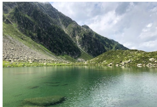
Figura 6 Klaussee

Mar 27/07/2021: con tutta la calma del mondo ci avviamo verso gli impianti di risalita, una moderna cabinovia ci porta a 1600mt, dopo un incontro ravvicinato con alcune mucche decidiamo di salire a piedi al lago denominato "Klaussee" (2150mt) dopo una splendida passeggiata (10km e 400mt di dislivello) ed un altrettanto splendido pranzo in malga facciamo rientro al camper per un'altra serata tranquilla. (0€-0km)