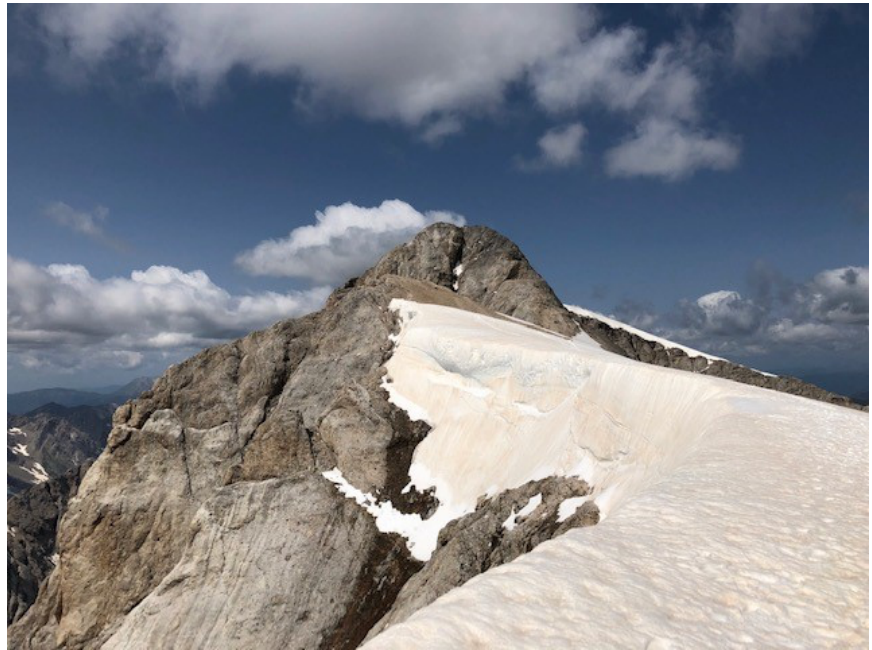
Figura 3 Marmolada

Mar 20/07/2021: l'obiettivo di oggi è la regina delle Dolomiti, ci spostiamo quindi al parcheggio funivia “Malga Ciapela” e tramite le 3 funivie raggiungiamo il ghiacciaio della Marmolada. Esperienza davvero entusiasmante, peccato che a causa del riscaldamento globale il ghiacciaio si stia ritirando anno dopo anno, consiglio a tutti di andarci prima che sia troppo tardi. Il biglietto della funivia consentirebbe la sosta notturna a “Malga Ciapela”, ma ritengo molto più suggestivo il Passo Fedaia, quindi ci spostiamo nuovamente verso questo posto incantevole. (0€-12km)